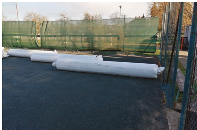
Nový povrch ještě v balení od výrobce