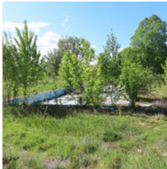
Současná podoba koupaliště

O činnosti TJ Sokol a jednotlivých oddílů bylo psáno v minulém čísle zpravodaje. Samozřejmě celý rok byl pro nás klasicky cvičebním a letos také rokem XV. Všesokolského sletu, na kterém se naše sestry a bratři aktivně podíleli, část vystoupení i s přespolní účastí bylo předvedeno i přímo na hřišti za Sokolovnou v září, bohužel ne s takovou účastí návštěvníků, jaké by si zapálení i více jak 90-ti letých cvičenců zaslou-