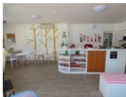
Mezigenerační centrum a Family point

Starostí a práce je opravdu dost, také stav nemovitostí v majetku města je tristní. Máme sice navenek opravené fasády, uvnitř je to ale katastrofa. Do toho jsme neustále osočováni bývalým vedením z nic nedělání, z toho, jak dobře jsme placeni a spousta dalších ataků. To často bere chuť do další práce, a to tím spíš, že já osobně mám dvě malé děti ve věku 18 měsíců a 3,5 roku. Nakonec však při rozhodování, zda setrvat či nikoliv, myslím na to, že právě kvůli podobným přístupům je třeba pokračovat a vydržet. Ukončit staré časy, aby radnice byla slušná, transparentní, aby se na ni nemuseli občané bát přijít a o něco požádat. Aby fungovala ve prospěch všech, nejenom jednotlivců. Vidíte, že je toho opravdu hodně (a to jsem nenapsala zdaleka vše), co jsme za tak krátkou dobu udělali, na čem intenzivně pracujeme. Proto apeluji na nás všechny, neposlouchejme fámy