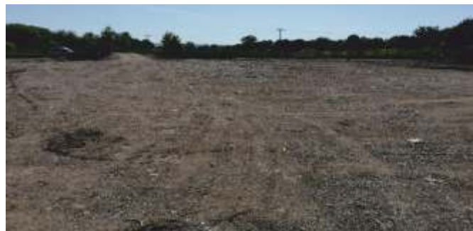
Navýšení a zpevnění pláňe