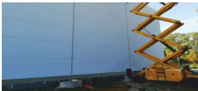
Montáž obvodových panelů