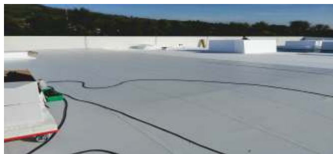
Montáž střešního pláště