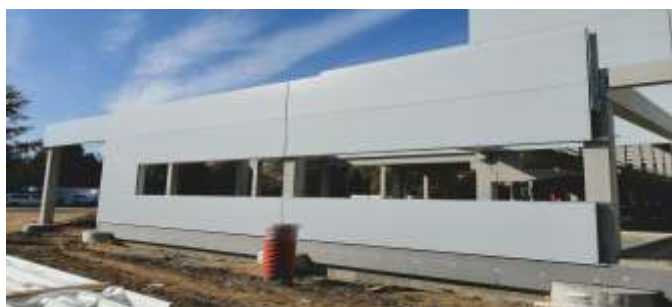
Montáž ocelové konstrukce pro okna a dveře