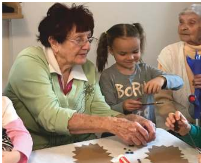
Tvoření v Penzionu pro seniory