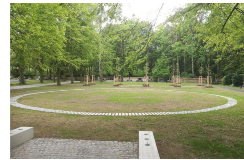
REFERENC ROZPTYLOVÉ LOUČKY, zdroj: Archiweb.cz, Hřbitov Suchdo