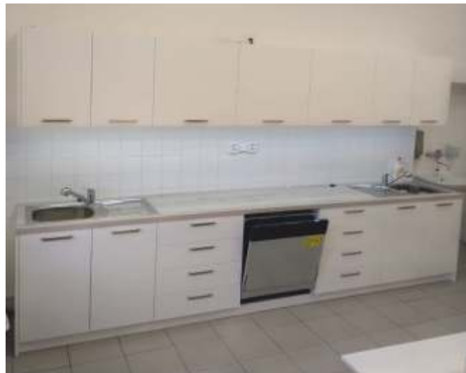
Nová žákovská kuchyňka