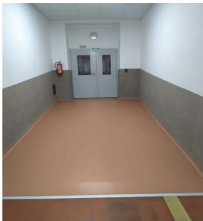
Nová rampa před jídelnou

Poslední změna se týká vyučovací místnosti na praktické činnosti – žákovské kuchyňky. Z důvodu nevyhovujících podmínek a velké opotřebovanosti žákovské kuchyňské linky došlo k její kompletní výměně. Nově mají možnost žáci