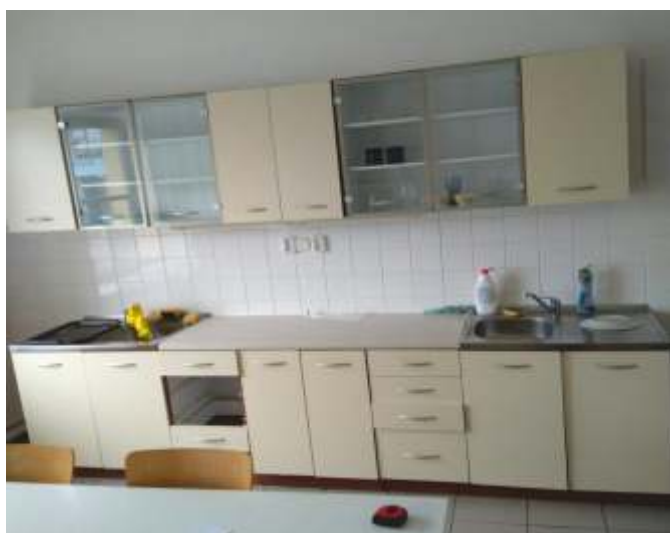
Stará žákovská kuchyňka