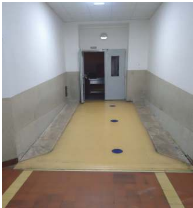
Stará rampa před jídelnou

okénka a nově se používají okénka dvě. Touto změnou došlo ke zkrácení doby čekání ve frontě na oběd i k rychlejšímu a efektivnějšímu vydávání obědů. Před samotným vstupem do jídelny je nově umístěna čtečka obědových čipů, díky níž si každý školní strážník může připomenout, zda jej čeká oběd číslo jedna nebo číslo dvě. Celková doba výdeje obědů se tak zkrátila průměrně o deset minut, což rozhodně dodalo více „obědového“ klidu přespolním žákům.