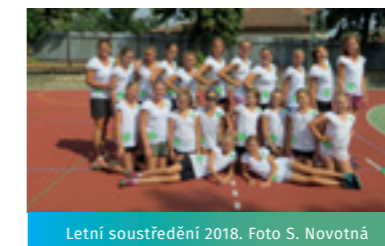
Letní soustředění 2018.