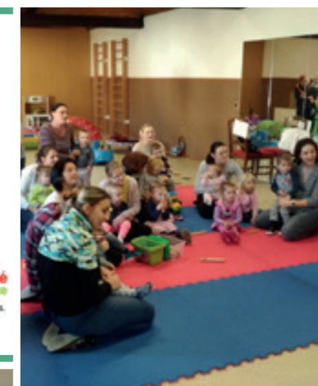
Mateřský klub OVEČKA