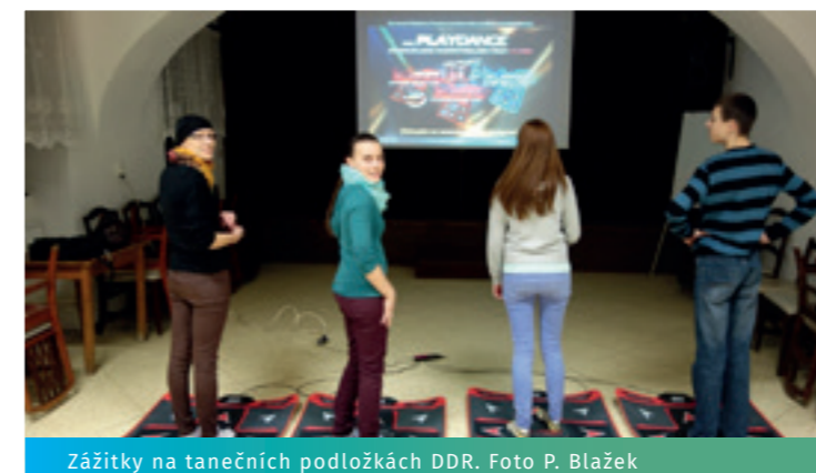
Zážitky na tanečních podložkách DDR.