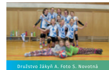
Družstvo Žákyň A.

Volejbal pro děti v Újezdu u Brna funguje již 6 let. Začínali jsme volejbalem v barvách – minivolejbalem, díky kterému