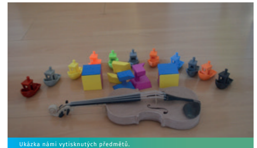
Ukázka námi vytisknutých předmětů.