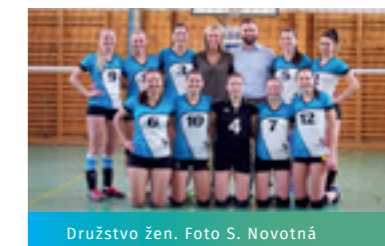
Družstvo žen.

se nám podařilo vypěstovat širší základnu volejbalové mládeže. Letošní sezónu 2018 /2019 jsme se více zaměřili na šestkový volejbal.