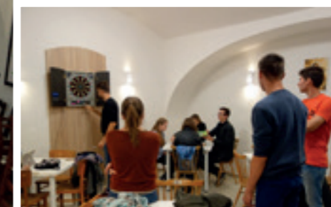
Šipky v baru Komunitního centra Dona Bosca.