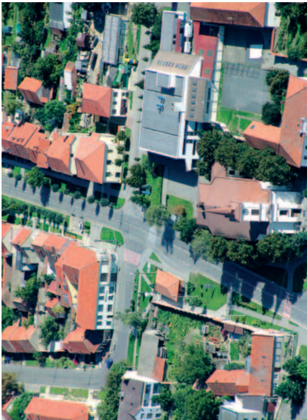
Střed města s budovou radnice