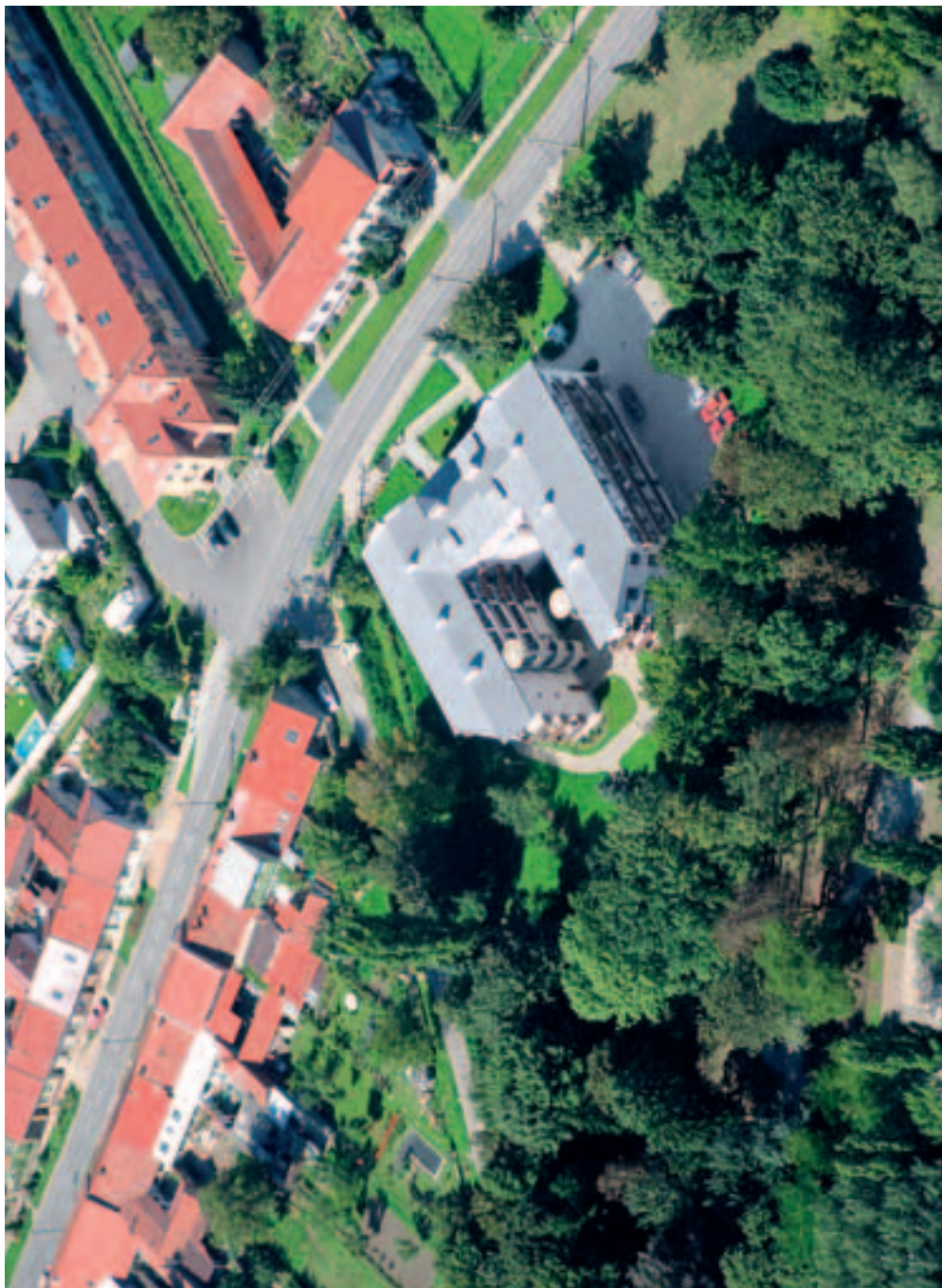
Penzion pro důchodce