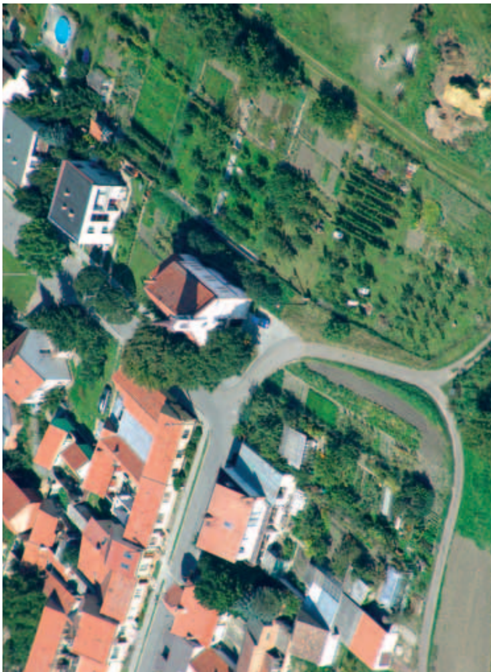
Evangelický kostel na Rychmanově