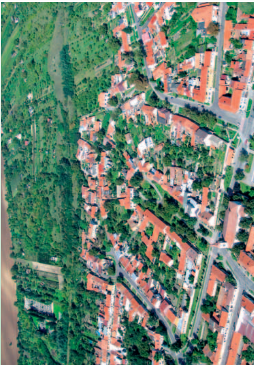
Náměstí sv. Jana, ulice Sušilova, Hybešova a Komenského, ulice Nad Sklepy a Vinohrádky