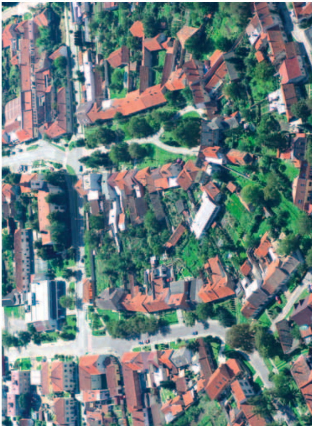
Nejstarší část města – náměstí sv. Jana, Hybešova ulice a ulice Nad Sklepy