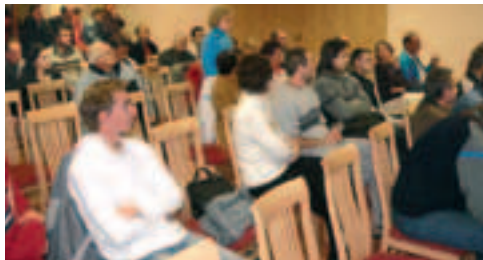
V závěru zasedání dal nový starosta možnost občanům vyjádřit své připomínky i náměty, kterými by se mělo zastupitelstvo zabýrat v příštím roce.