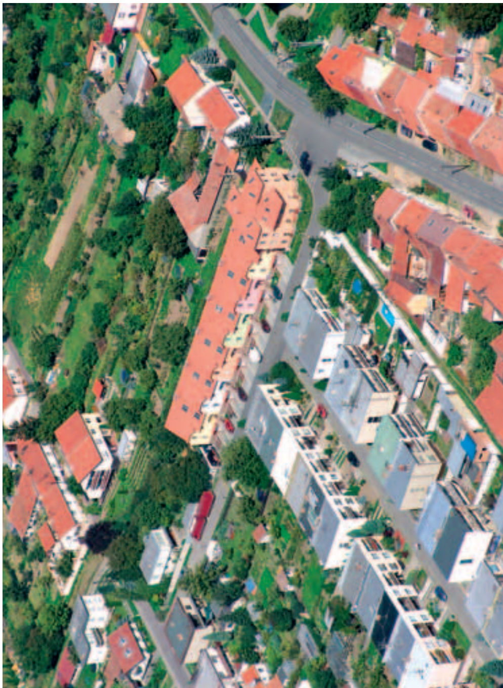
Nejnovější bytová výstavba – 32 bytů v ulici Na Zahrádkách