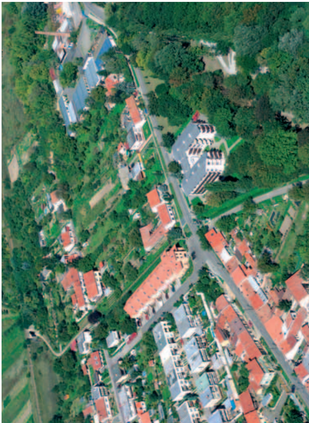
Část ulice Štefanikovy a Na Zahrádkách, park a Penzion pro důchodce