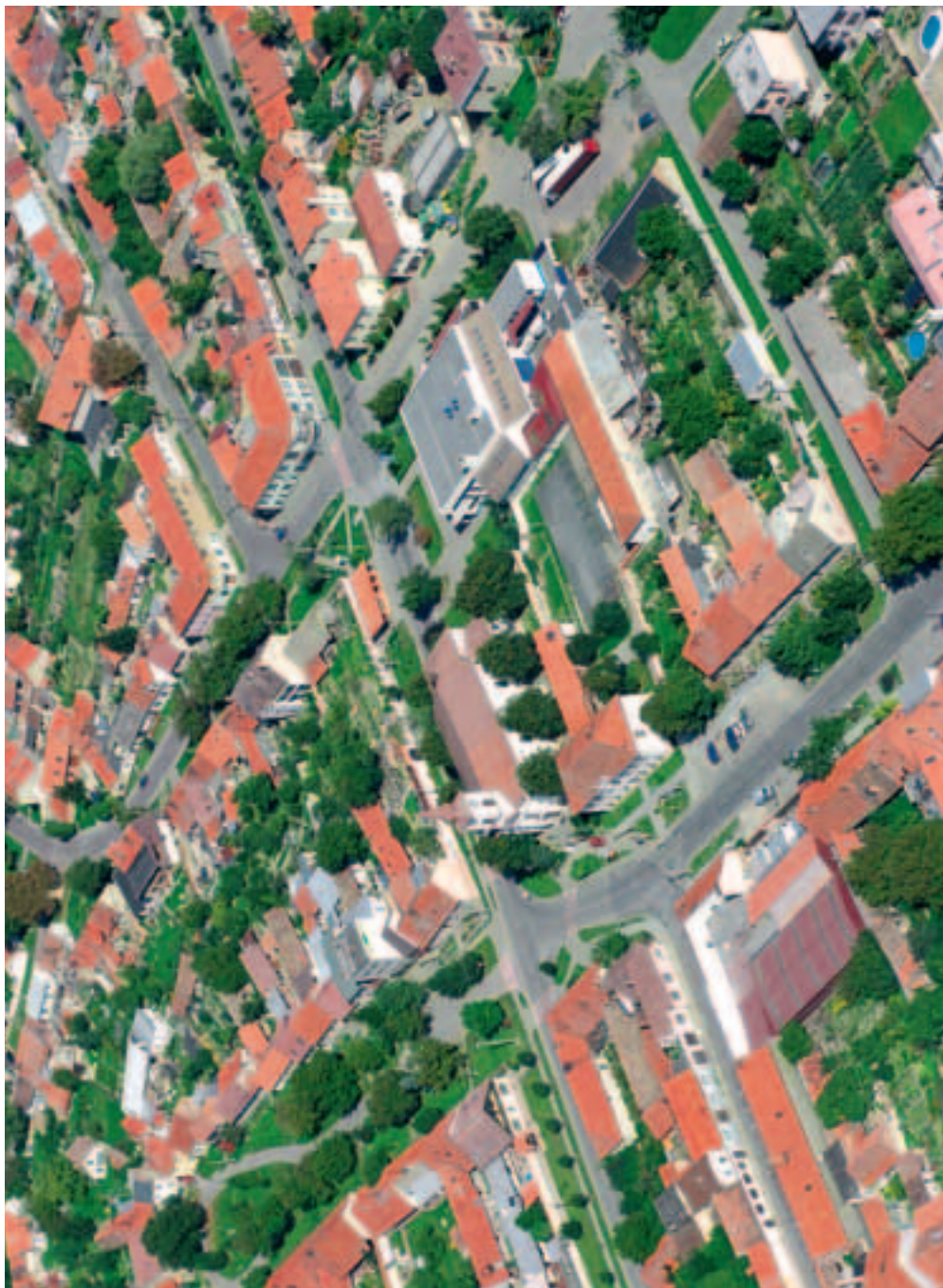
Střed města s katolickým kostelem a famím úřadem