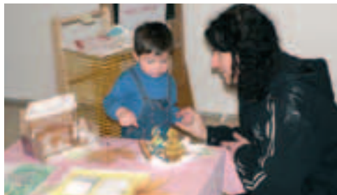
Výstavka výrobků dětí a mlsný školáček