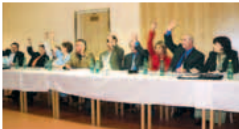
Zdvížené pravice nových zastupitelů při prvním hlasování nového zastupitelstva města pro volební období 2006–10.