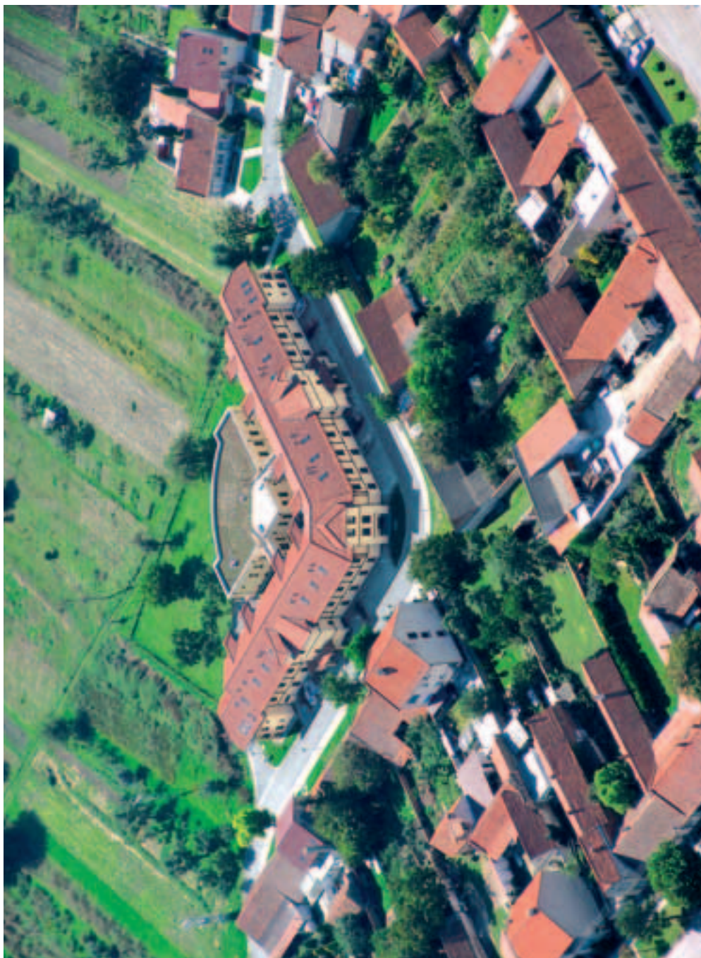
Dům s pečovatelskou službou na Rychmanově – čelní pohled