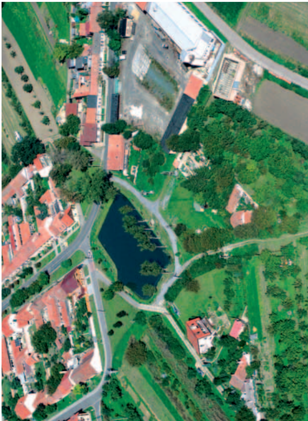
A ještě jednou rychmanovský rybník