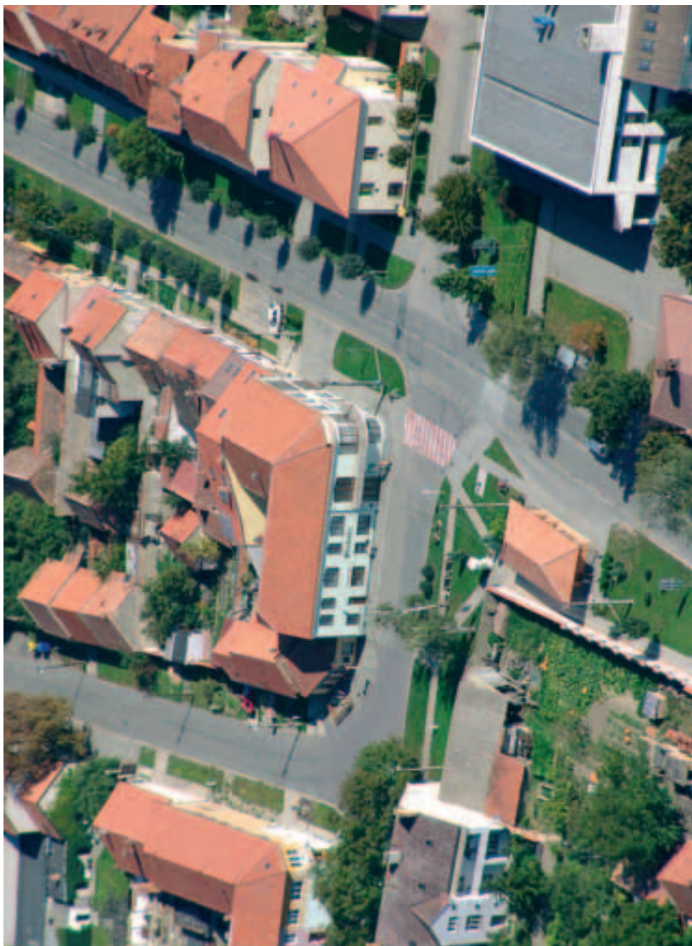
Budova újezdské radnice