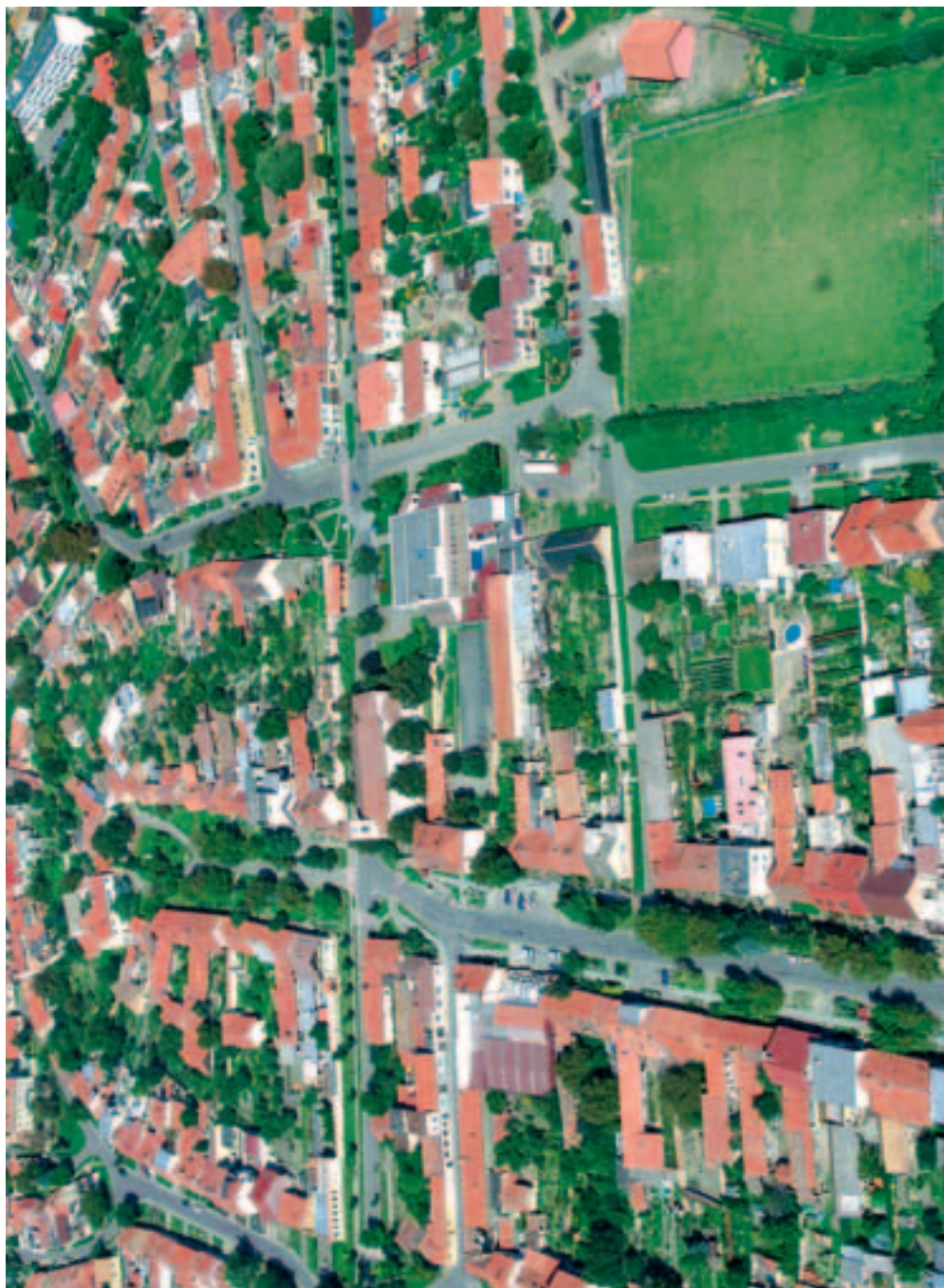
A ještě jednu střed města