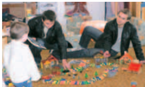
Jak vidět, na věku nezáleží – chlapi si rádi hrají pořád ...