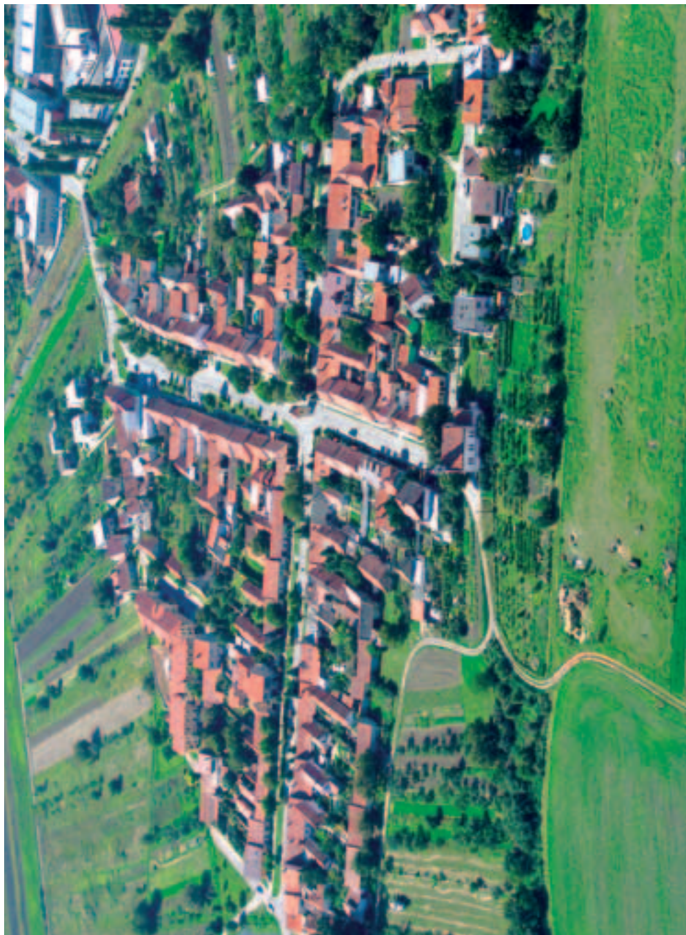
Rychmanov – krásný ptačí pohled