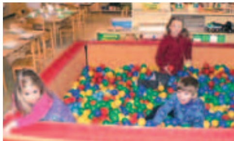
Ti nejmenší se učí plavat.