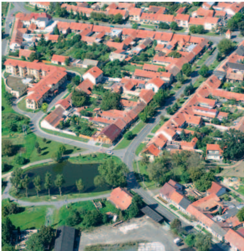
Část Rychmanova s rybníčkem, budovou DPS a ulicemi Českou a Rychmanovskou

Jistě si také mnozí z Vás všimli, že ve výloze prodejny Elektro Spáčil na Nádražní ulici jede videosmyčka s nahrávkami návštěvy pana prezidenta, premiéra Paroubka a z dobytí radnice 2. prosince 2005. Pokud máte zájem si video nahrávku (či DVD nahrávku) zakoupit, není problém si je objednat buď na podatelně nebo na sekretariátu městského úřadu. Filmová nahrávka z návštěvy pana prezidenta či pana ing. Paroubka stojí 120 korun, nahrávka z dobytí radnice stojí 100 korun. Cena platí jak pro DVD, tak pro VHS.