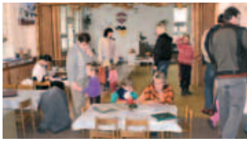
Rodiče mohli nahlédnout do tříd a podívat se, jak a s čím se děti ve školce baví