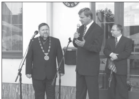
Starosta zapojuje do hovoru u mikrofonu zástupce státní a veřejné správy na fotografii se senátorem Ivem Bárkem