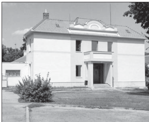
Sokolovna na Nádražní ulici