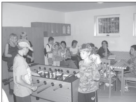
Klubovna je vybavená novým nábytkem, kuchyňskou linkou s příslušenstvím, výpočetní technikou