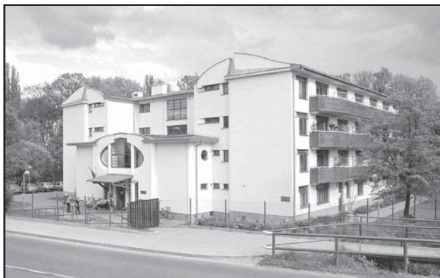
Penzion pro důchodce

Před deseti lety 1. října roku 1996 byl uveden do provozu zbrusu nový domov pro více než 40 starých lidí – penzion pro důchodce. Den otevřených dveří byl stanoven na jeden z deštivých víkendů počínajícího podzimu. V následujících dnech se do tohoto objektu začali stěhovat první obyvatelé a někteří z nich tam žijí dosud.