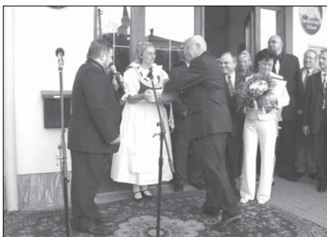
Chléb a sůl