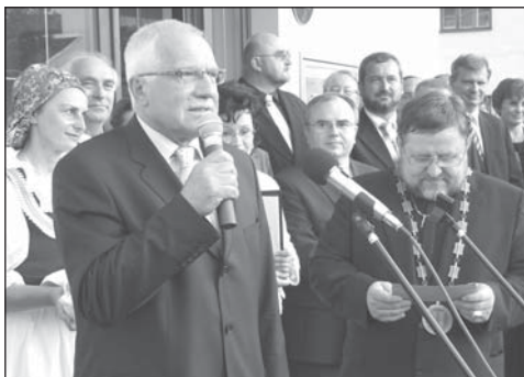
Prezident republiky zdraví přítomné občany