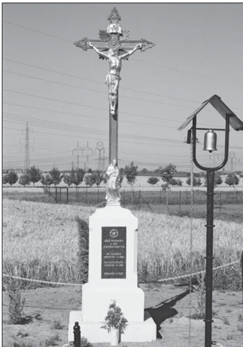
Kříž ve Šternově