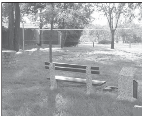
Volejbalové hřiště na ulici Wolkerově