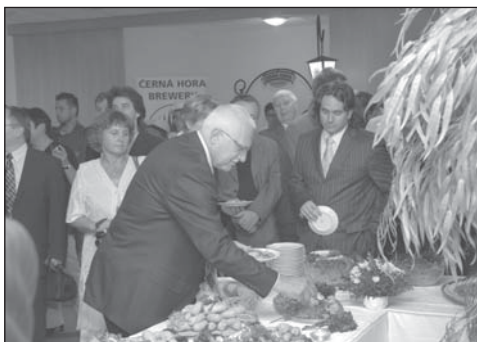
Pan prezident na rautu