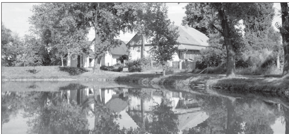
Rybník na Rychmanově