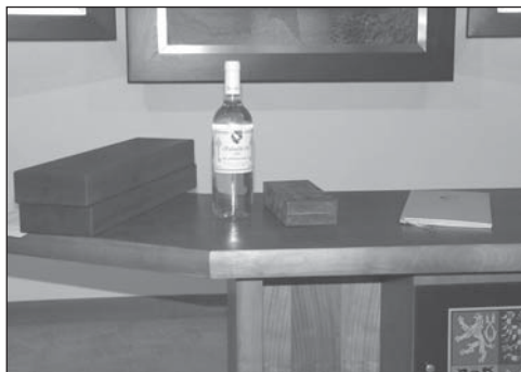
Dary připravené v obřadní síni pro pana prezidenta