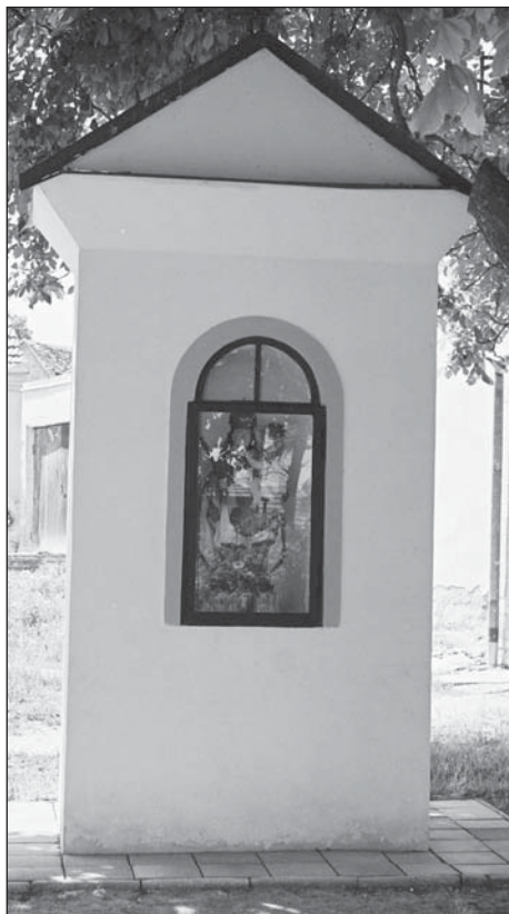
Kaplička na křižovatce ulic V Sádku - Hybešova