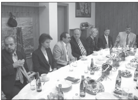
Kolem 17.00 hodiny se scházejí první hosté