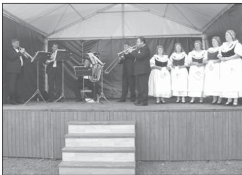
Kapela Brno Brass Quintet a ženský sbor, který při uvítání pana prezidenta zazpíval státní hymnu