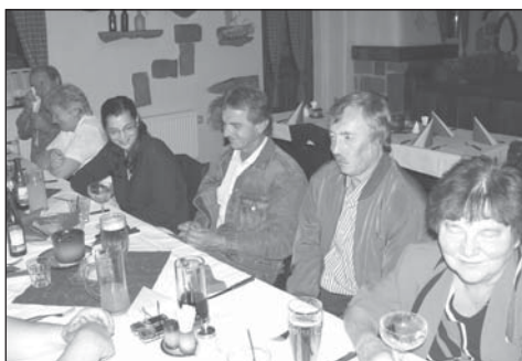
Se zastupitelstvem se rozloučili i pracovníci města