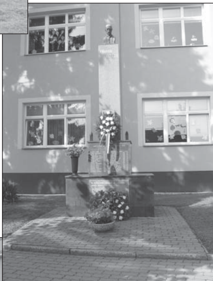
Pomník T. G. M. věnovaný padlým ve druhé světové válce umístěný u základní školy