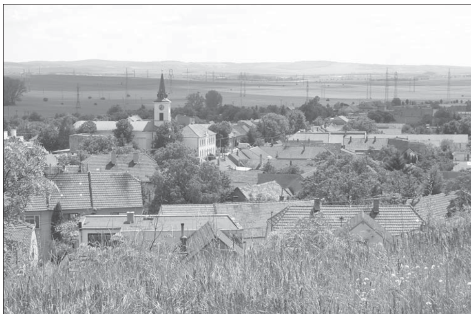
Pohled na Újezd z vršku Kříby