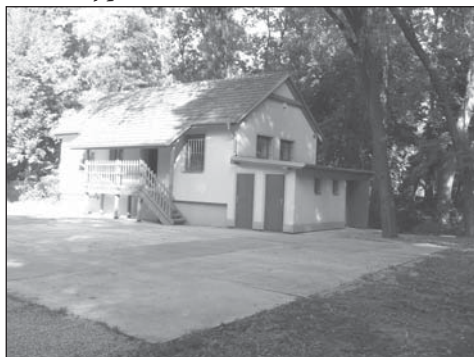
Nová klubovna pro mládež v parku