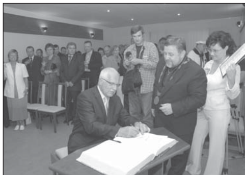
Pan prezident činí pamětní zápis do pamětní knihy