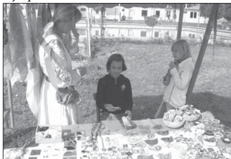
Na koupališti nabízeli prodejci své výrobky ze dřeva, keramiky, kovu, korálků, batiku a výšivky