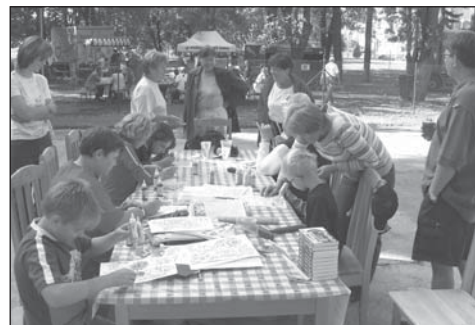
Pro děti byly připraveny hry a soutěže, divadelní představení a dílny