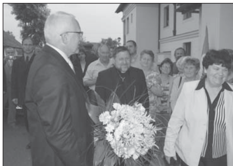
Pan prezident se setkává se seniory v Domě s pečovatelskou službou