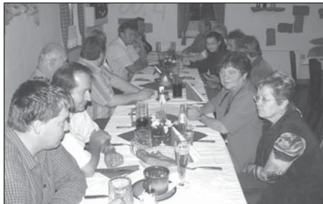
Poté, co zastupitelé přijali poslední rozhodnutí, se přesunuli k rozloučení do motorestu Bonapart