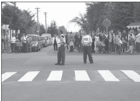
Městská policie v pohotovosti