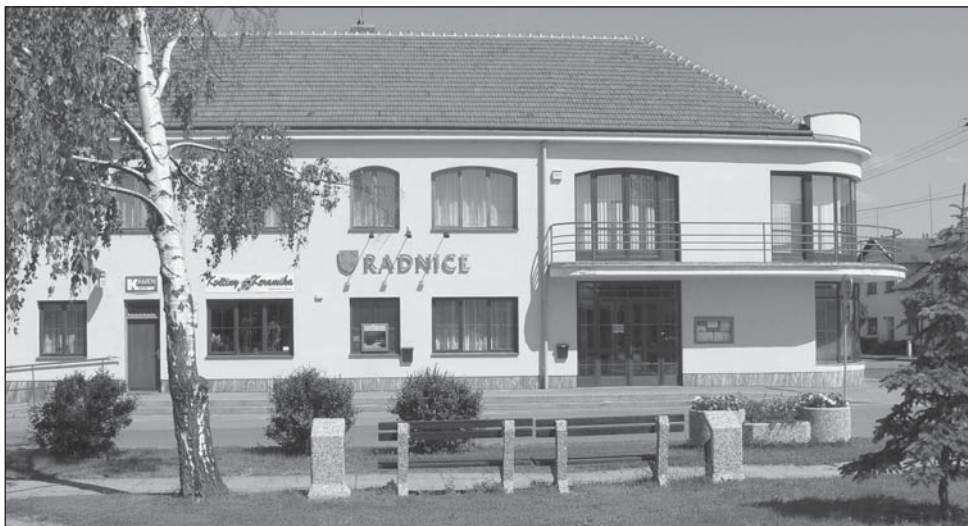
Budova újezdské radnice