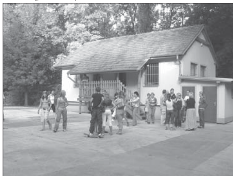
Oficiální otevření klubovny pro mládež dne 2.9.2006