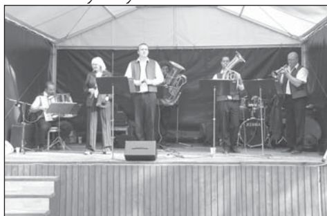
K poslechu i zpěvu hrála až do pozdních večerních hodin kapela Brněnka