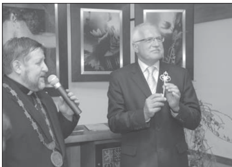
Pan prezident přebírá ocenění Symbolický klíč od města a dekret s udělením titulu Čestný občan města