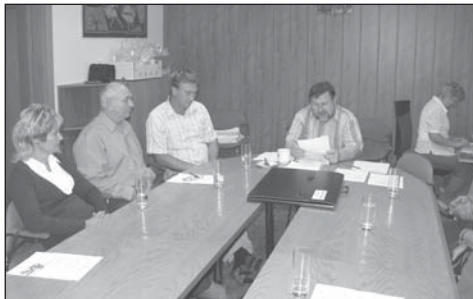
Poslední zasedání zastupitelstva v zasedací místnosti městského úřadu - večer 6. 10. 2006