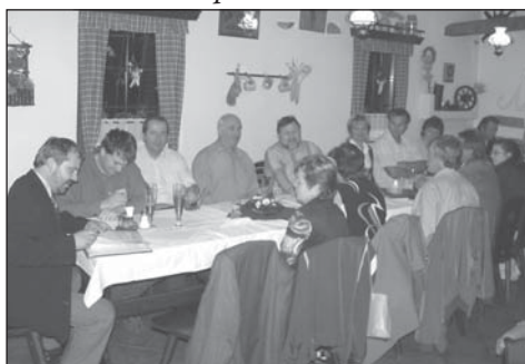
Stejně jako poslední zasedání proběhlo v dobré náladě, proběhla i poslední večere