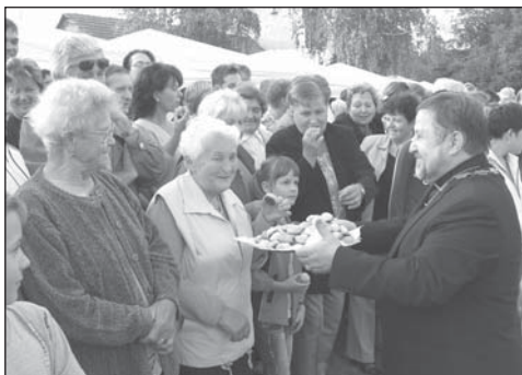
Nervozita stoupá, malé zpoždění pana prezidenta vyplňuje starosta města rozdáváním koláčků