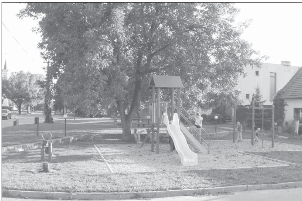
Dětské hřiště na ulici Wolkerově