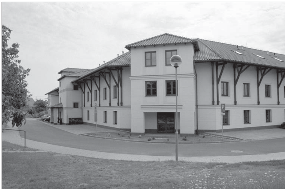
Dům s pečovatelskou službou na Rychmanově