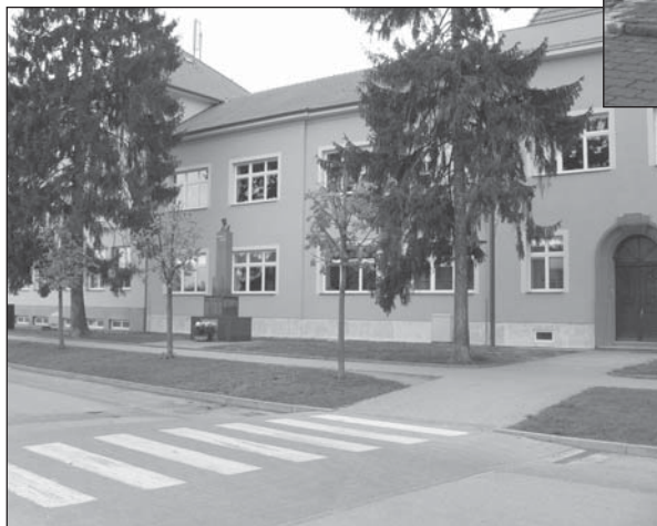
Po rekonstrukci můžeme i budovu základní školy počítat mezi hezká místa města