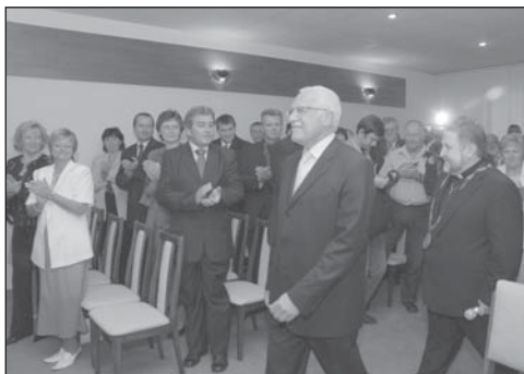
Prezident přichází do obřadní síně a je uvítán pozvanými hosty