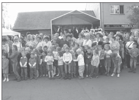
Na příjezd pana prezidenta trpělivě čekají i ti nejmenší