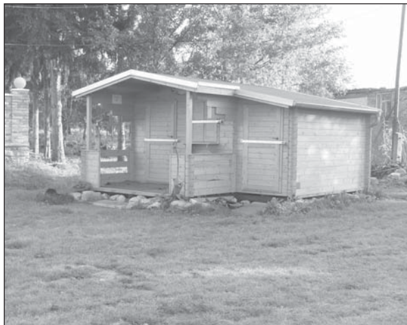
Nový rybářský srub u rychmanovského rybníku