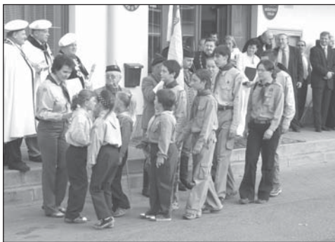
Před radnicí se začínají scházet zástupci újezdských organizací, na snímku Junáci