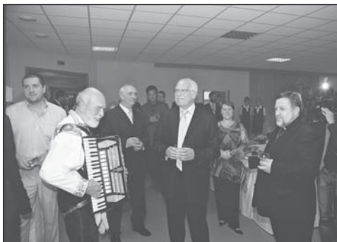
Pan prezident přichází na raut do jídelny DPS