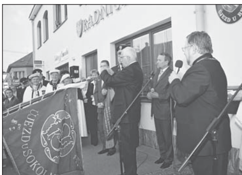
Pan preziden dekoruje praporek SOKOLU