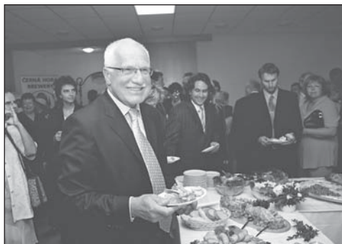
Milá a vstřícná nálada pana prezidenta neopouští i přes pokročilou hodinu a jeho náročný celodenní program