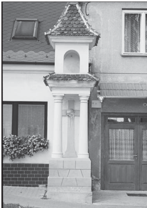
Kaplička na ulici Nádražní