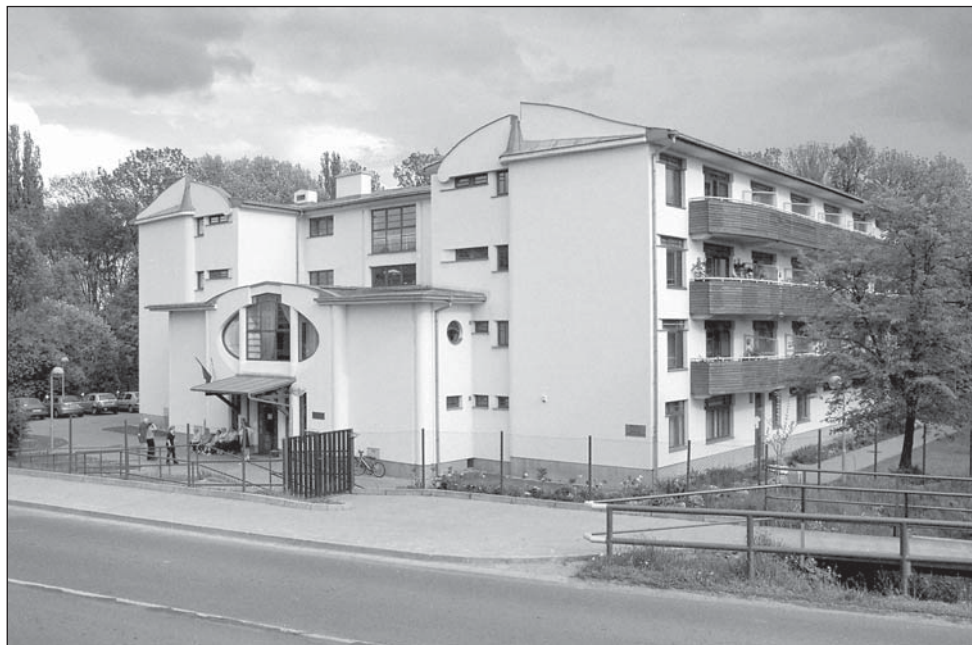
Penzion pro důchodce na Štefánikově ulici