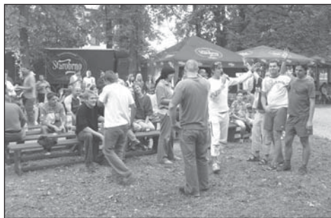
Návštěvníků během odpoledne přibývalo a nálada se s vypitými půllitry stále vylepšovala