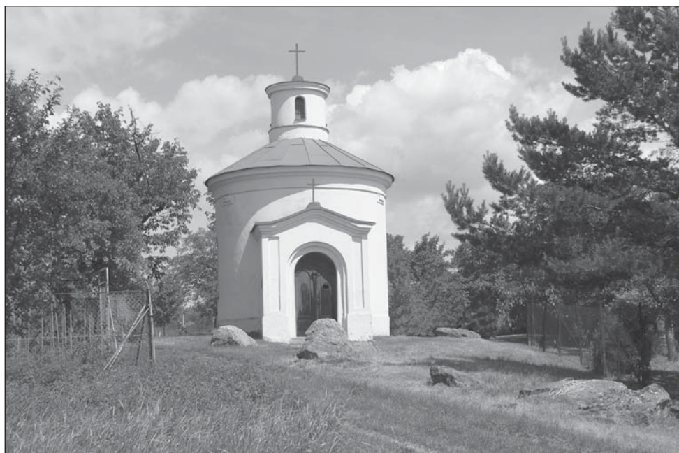
Kaplička sv. Antonína Paduánského