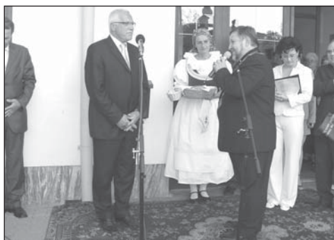
A konečně je tady!