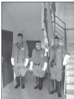
Zástupci újezdského Sokolu se sokolským praporem