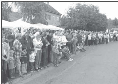
Prostor před radnicí se začal plnit lidmi již od půl páté