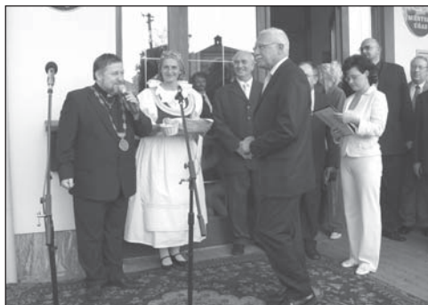
Pozdrav starosty města při příjezdu pana prezidenta