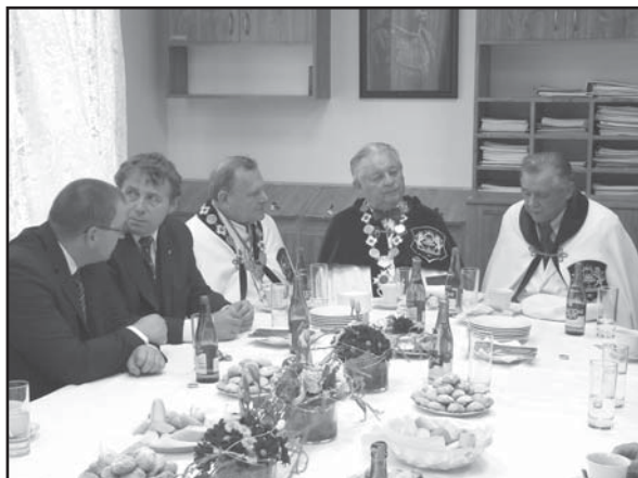
Návštěvy prezidenta ČR v Újezdě se zúčastnili 3 zástupci společenství v cechovních krojích

Na vršku dortu byl symbolicky vyveden klíč od města v marcipánovém provedení.