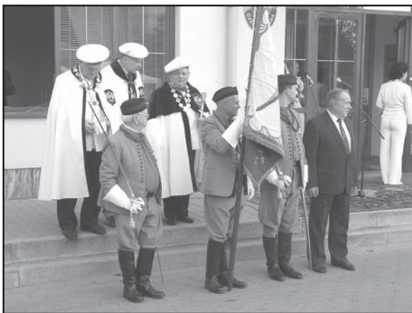
Zástupci Společenstva cukrářů ČR při slavnostním defilé při příjezdu prezidenta ČR do Újezdu

V současné době pracuje v ČR cca 160 cukrářských provozoven – živnostníci, mikro a malí podnikatelé, v cukrářských dovednostech se vzdělává mládež na 52 cukrářských učilištích v celé ČR. Každoročně se na zámku v Kačíně koná Cukrářská pouť a je zde zřízeno cukrářské muzeum. Rovněž každý rok je předán českými cukráři dort panu prezidentovi u příležitosti výročí 28. října.