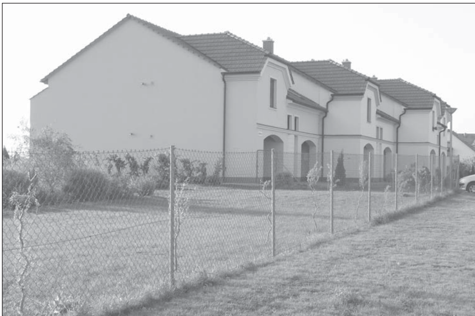
Bytový blok E na ulici Rozprýmově