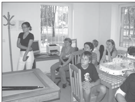
Nejen zástupci újezdské mládeže a děti, ale i jejich rodiče si přišli prohlédnout nové prostory