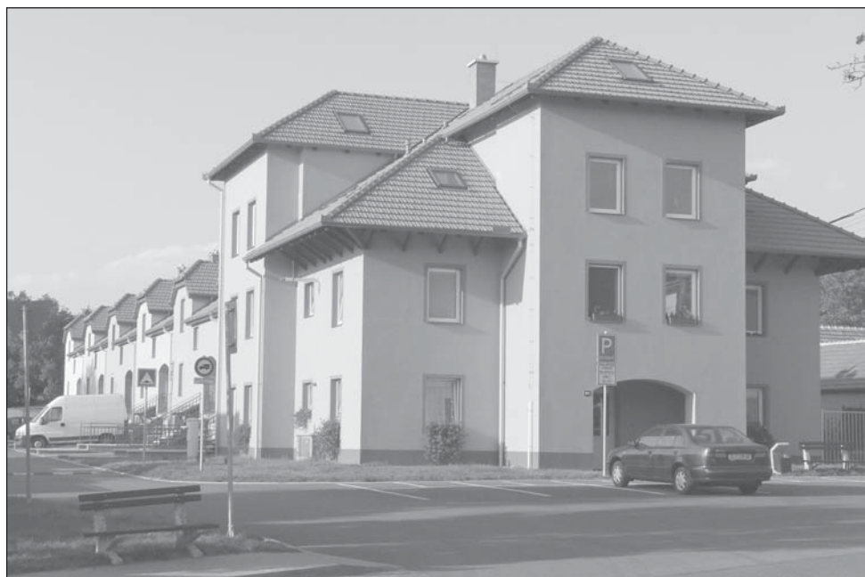
Nový bytový dům na ulici Na Zahrádkách