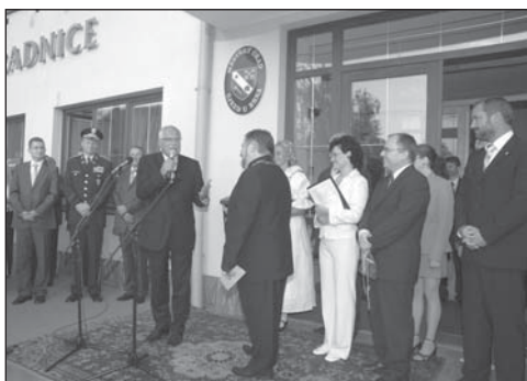
Pan prezident při diskusi s občany města