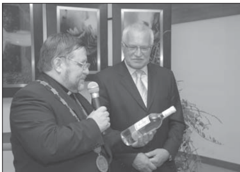
Pan preziden přijímá z rukou starosty města dary