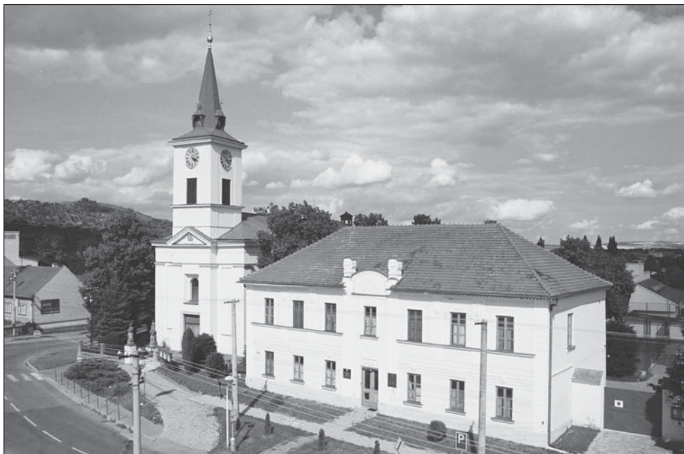
Katolický kostel sv. Petra a Pavla s farním úřadem