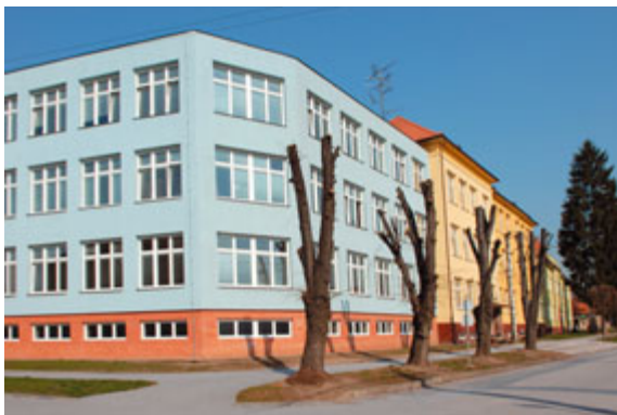
Základní škola – po ořezu stromů

Pokud máte zájem o podrobnější informace, navštivte nás osobně nebo využijte školní webové stránky http://zs.ujezdub.indos.cz . Na vaši návštěvu a vaše děti se těší