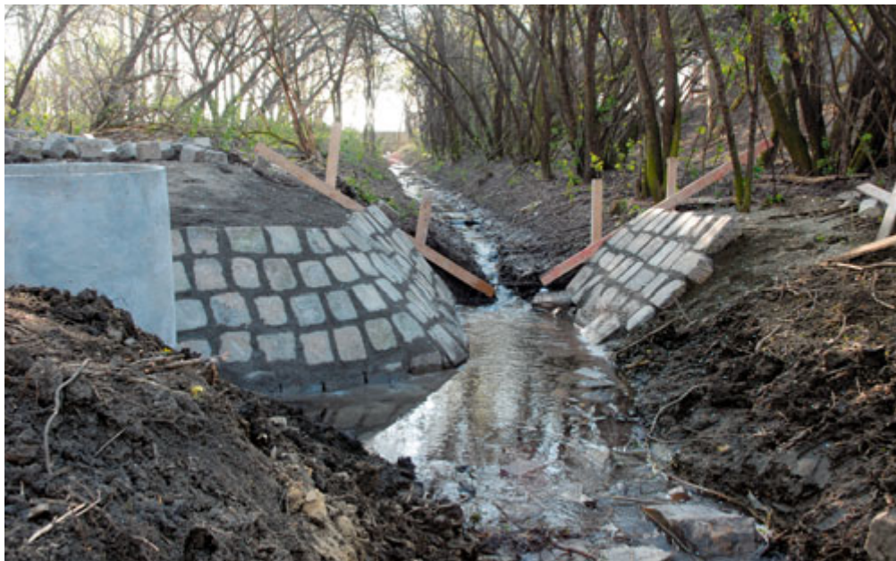
Právě probíhá rekonstrukce přítoku vody do rychmanovského rybníka (firma Colas)