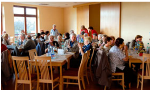
Papučový bál, 30. března 2007 v DPS