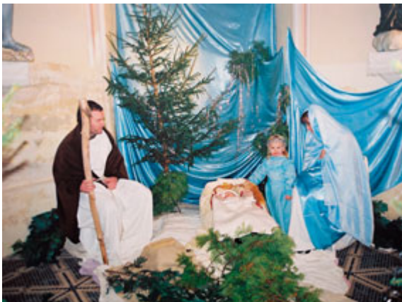
Svatá rodina v kapli sv. Antonína Paduánského, 29. 12. 2007