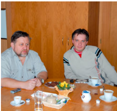
Zástupce firmy Netic vysvětluje starostovi funkci počítačové sítě