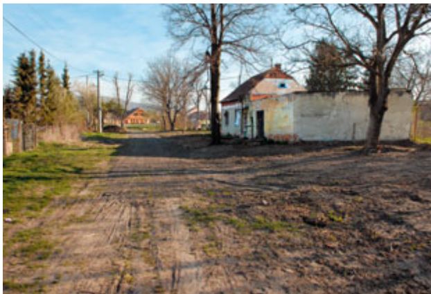
! Vlastík Svoboda si v sobotu uklidil okolí svého domu (odvezli jsme již 3 kontejnery)

Obecně závazná vyhláška města č. 2/2007, kterou se mění a doplňuje vyhláška č. 1/2006 o místním poplatku za provoz systému shromažďování, sběru, přepravy, třídění, využívání a odstraňování komunálního odpadu