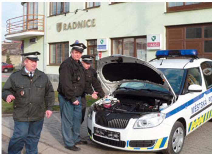
Městská policie – škola hrou

Důvod byl jednoduchý: vozidla vytahovala na vozovku hlínu a bláto. Toto se pak dostávalo do kanalizační sítě. A čištění tzv. dešťáků stojí město nemalé finanční prostředky. Proto i nadále se bude MP věnovat neukázněným řidičům, někteří to pocítí i finančně, protože se jedná o porušení obecně závazné vyhlášky.