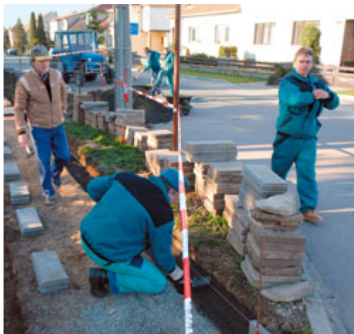
5. 4. 2007 chystáme přeložení chodníku na ul. 9. května