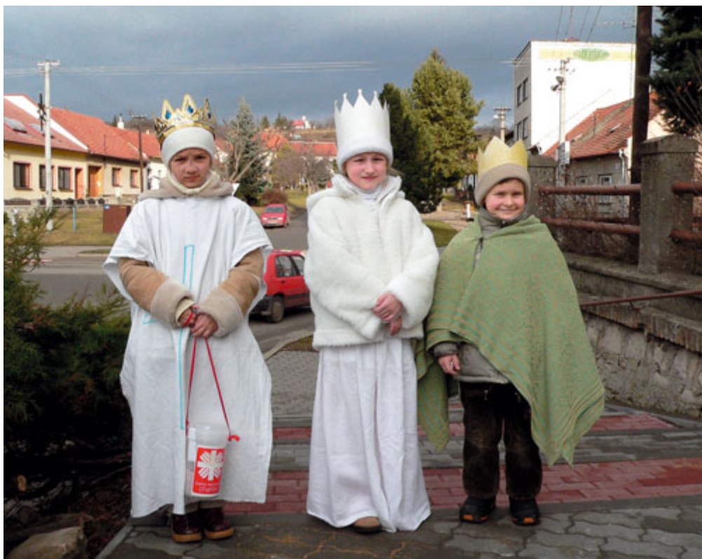
Naši „Tři králové“