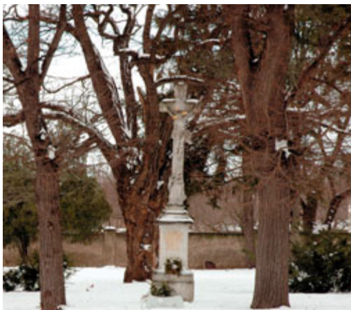
Starý hřbitov v zimě