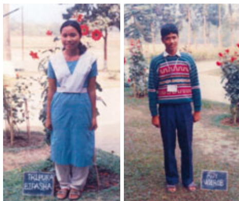
2 banglálské děti, kterým město adopcí umožnilo studium