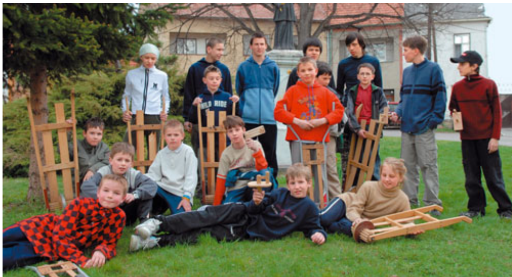
Nezapomínáme na staré krásné zvyky