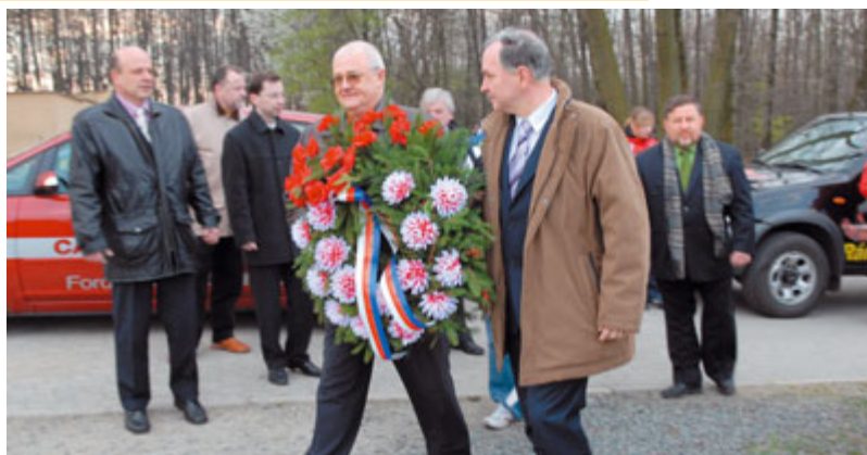
Kladení věnců – na Mohyle Míru, v popředí hejtman JmK a ředitel muzea