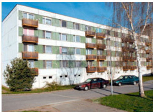
Převzali jsme do majetku města bezúplatným převodem 24 bytů