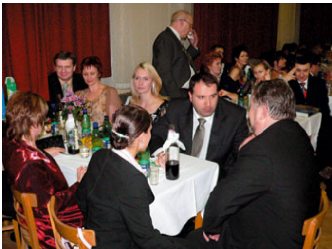
Naši hosté na plese