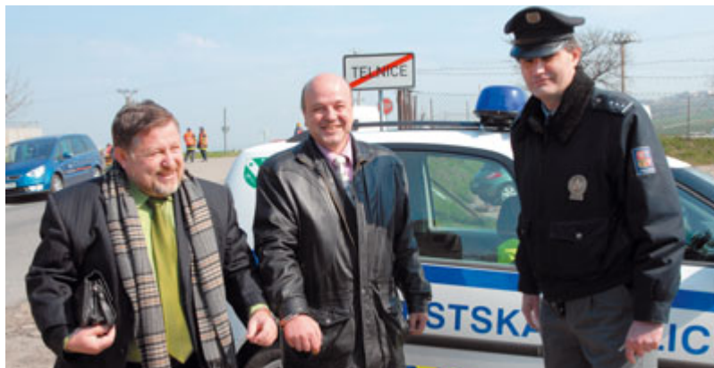
Starosta Sokolnic a Újezda – oba to mají spočítané