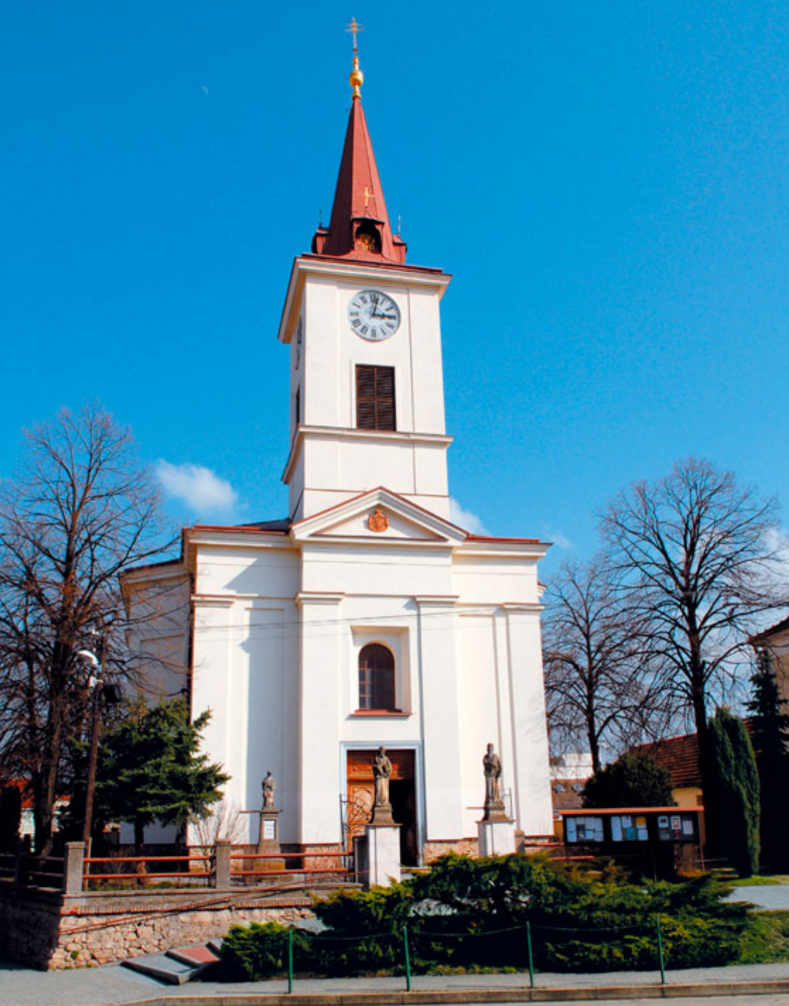
Dominanta města – římskokatolický kostel. Farní úřad ve spolupráci s městem chystá opravu kamenné podezdívky kostela.