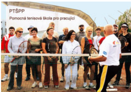
Pomocná tenisová škola