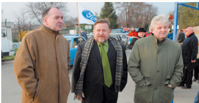
Závody do vrchu Mohyla Míru – spoluopřadatel město (hejtman, starosta), 31. 3. a 1. 4. 2007