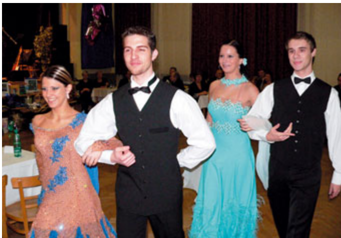
Profesionální tanečníci tancovali na III. městském plese