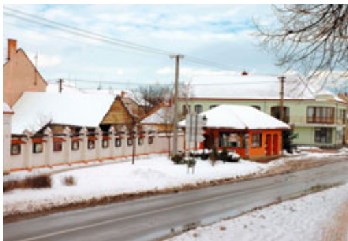
Letošní krátká zima