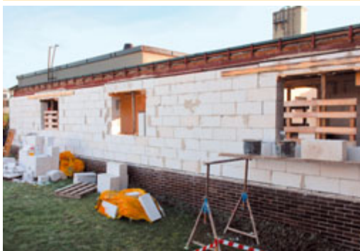
V naší mateřské škole probíhá přestavba