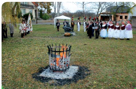
Slavnostní odhalení Piety, památníku padlým civilistům v bitvě u Slavkova, se odehrálo u příležitosti oslav 10. výročí založení Mohyla míru - Austerlitz, o. p. s.