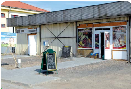
Obchod v budově bývalého Telecomu