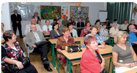
Přítomní mohli shlédnout i prezentaci k historii a plánům školy