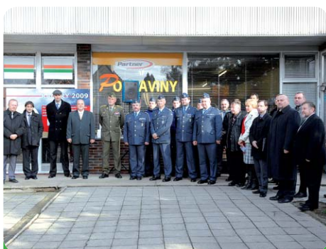
Dne 13.11.2009 se konalo setkání zástupců měst a obcí ležících v blízkosti radaru se zástupci armády