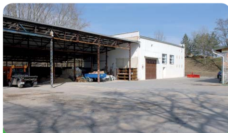
Dvůr pracovní čety města