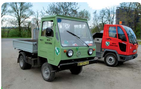
Stará Multikára M25