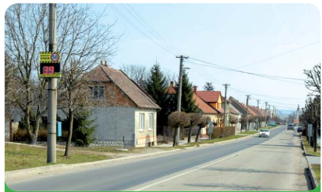
Jedno ze zařízení měřících rychlost při vjezdu do města