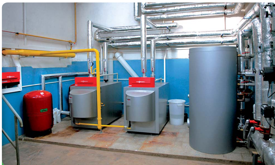
Kotelna školy byla vybavena novými kotly Viessmann