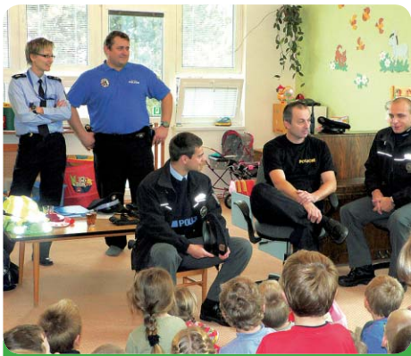
Při besedě děti vyslechy mnohdy až neuvěřitelné zážitky policistů