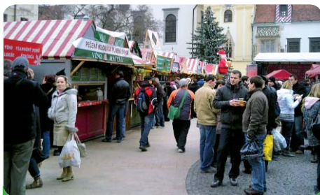
Vánoční trhy v centru Bratislavy