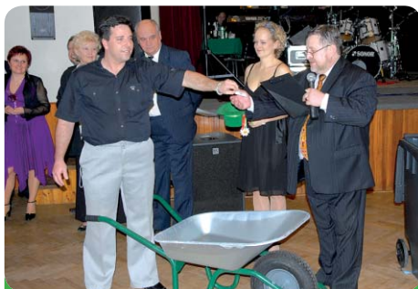
Tombola byla bohatá - někteří měli štěstí a vybavili své domácnosti nejen kolečkem, ale nakonec i popelnicí