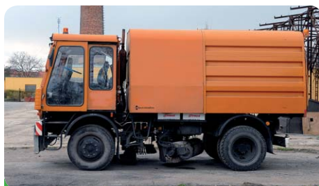
Čistící auto IFA

Dva muži nesou plnou zodpovědnost za pracovní skupinu, a to pan Miroslav Leukert a pan Jiří Veselý. Jsou to oni, kteří se starají, aby všechny stroje, auta, ale i montérky měly řádné označení města. Jsou to oni dva, kteří nesou zodpovědnost za náplň práce.