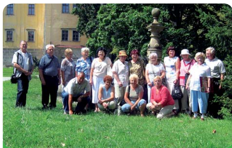
Klub diabetiků při návštěvě Moravského Krumlova