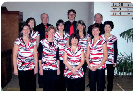
Eminent vocal má 11 členů