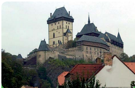
Skvostný hrad Karlštejn