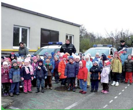
Závěr besedy s městskou policií a Policií ČR dne 04. 11. 2009