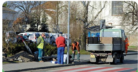
U všech přechodů vyrostla nová osvětlení, která mají zvýšit bezpečnost při přecházení