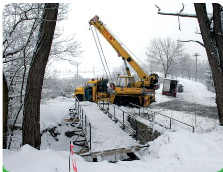
Stěhování mostku nebylo jednoduché