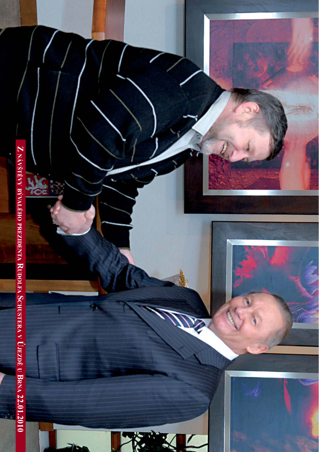
Z NÁVŠTĚVY BYVALÉHO PREZIDENTA RUDOLFA SCHUSTERA V ÚJEZDĚ U BRNA 22.01.2010