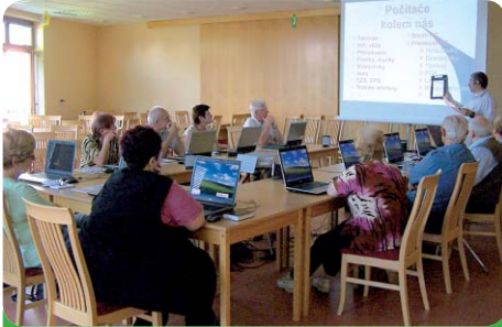
Seniory se naučili základy práce s počítačem i internetem