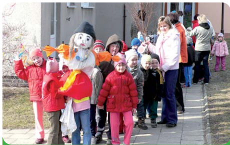
Děti se vydaly vyhnat zimu