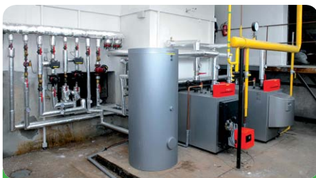
Nová kotelna školky