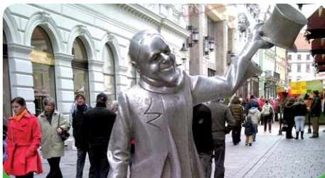
Kromě nákupů jsme věnovali pozornost i památkám a zajímavostem hlavního města Slovenska