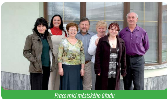
Pracovníci městského úřadu