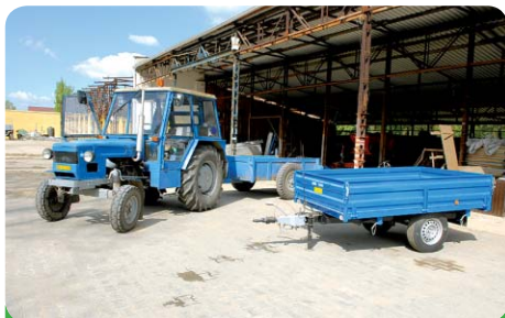
Traktor s vlečkou