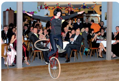
Krasojízda na kole v podání mistryně světa