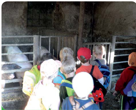
Návštěva statku v Bošovicích - září 2009