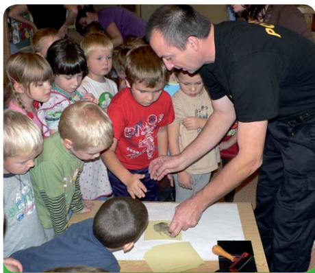
Jeden otisk a pachatel je dopaden