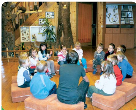
Výlet do environmentálního střediska v Lipce - listopad 2009