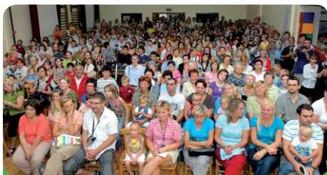
Sál Sokolovny byl při Akademii zaplněn do posledního místečka