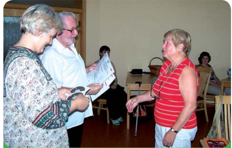
Každý z účastníků obdržel osvědčení