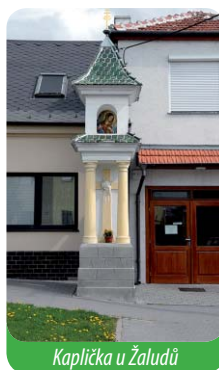
Kaplička u Žaludů

V Újezdě u Brna máme celkem čtyři nová umělecká díla. Je to kovaný kříž, žehnající Kristus Salvator před radnicí, vodník a pieta. Nesmíme taky zapomenout na nový obraz v kapličce u Žaludů.