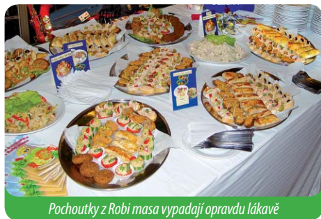
Pochoutky z Robi masa vypadají opravdu lákavě

2006 nejlepší masové jídlo na trhu v ČR – Robi čína Chuť jižní Moravy 2006 za stejný výrobek