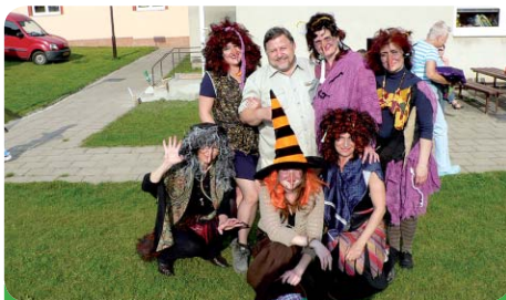
K odletu připraveni!