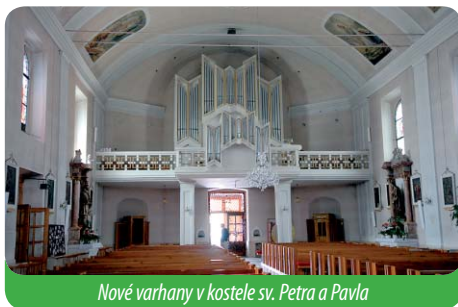
Nové varhany v kostele sv. Petra a Pavla