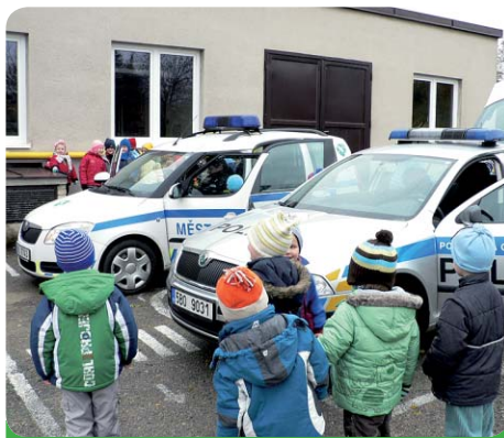
Obě policie mají moc hezká auta