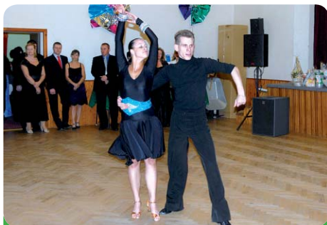
O předtančení se jako každý rok postarali profesionální tanečníci