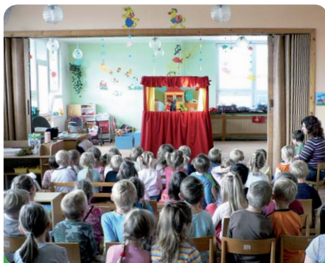
Divadlo v MŠ - Pohádka O pejskovi a kočičce - září 2009