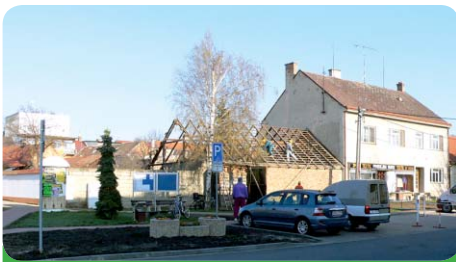
Bourací práce na stodole již začaly

Chci upozornit na jednu zajímavost. Město Újezd u Brna zbudovalo naproti radnici praktické parkoviště a za tímto parkovištěm se mu podařilo odkoupit parcely a stodolu, kterou po vydaném asanačním rozhodnutí od Stavebního úřadu v Sokolnicích zbourá. Vytvoří plochu volného času. J. H.