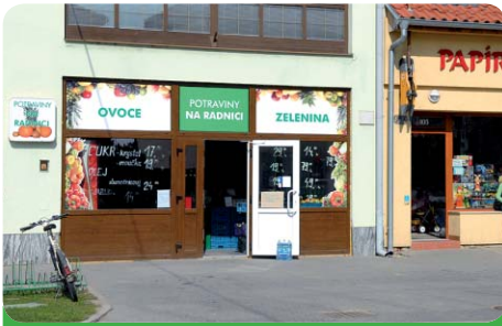
Potraviný Na Radnici