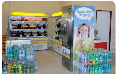
V prodejně se nachází i automat, kde je možné zakoupit čerstvé mléko