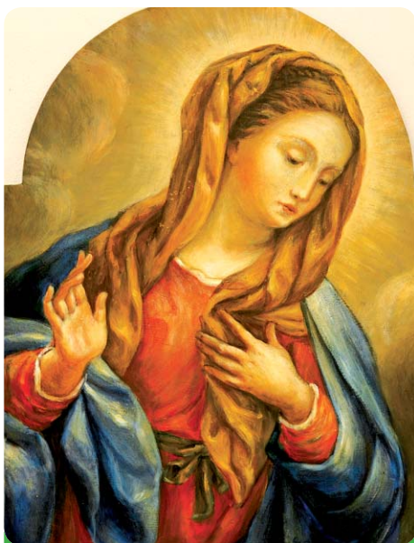
Nový obraz Panny Marie

V neděli 22.11.2009 ve 14:00 hodin se konala slavnost požehnání kapličky a novému obrazu Panny Marie.