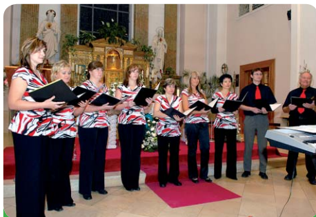
Sbor při jednom z koncertů