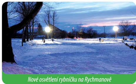
Nové osvětlení rybníčku na Rychmanově

Náš rybníček na Rychmanově dostal nové noční nasvícení – dva halogeny, které jsem nechal nainstalovat kvůli bezpečnosti dětí. Rybníček takto nasvícený v zimní příkrývce připomínal ladovské obrázky plné sentimentu. U rybníka sedí náš vodník Toník a je okrasou širokého okolí. Malým dětem svítí oči radostí.