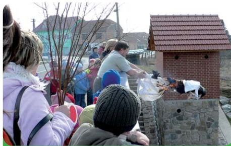
A jaro má již cestu otevřenou!