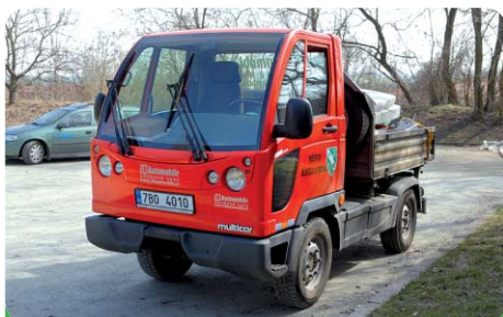
Nová Multikára M30