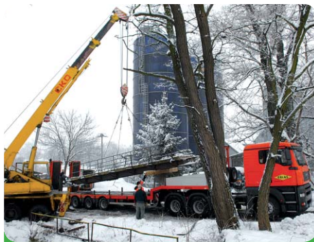
Zvedání mostku a převoz do Sokolnice