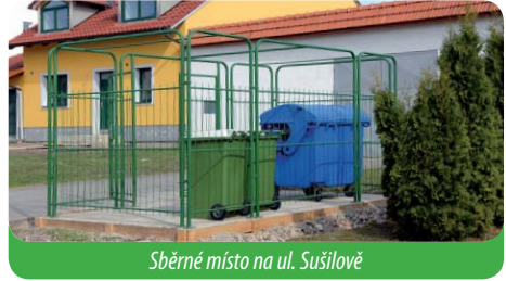
Sběrné místo na ul. Sušilově