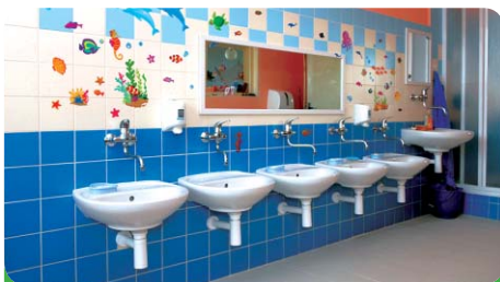
A takto vypadá výsledek rekonstrukce koupelen!