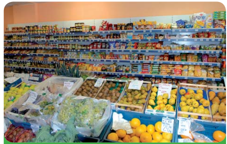
Potraviný nabízejí široký sortiment zboží