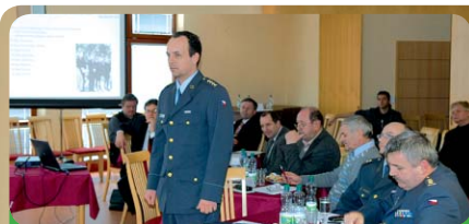
Jednání k problematice sokolnického radaru se konalo v prostorách DPS v Újezdě u Brna 21.01.2010