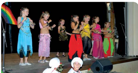
Žáci školy si připravili různá vystoupení na Akademii ke 100. výročí založení ZŠ