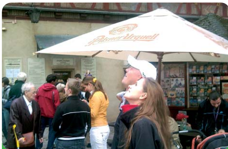
Ani na Karlštejně nás seriál Ulice neopustil