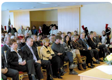
Při přednášce se zaplnila celá jídelna