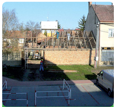
Na místě stodoly vyroste v budoucnu malé náměstí