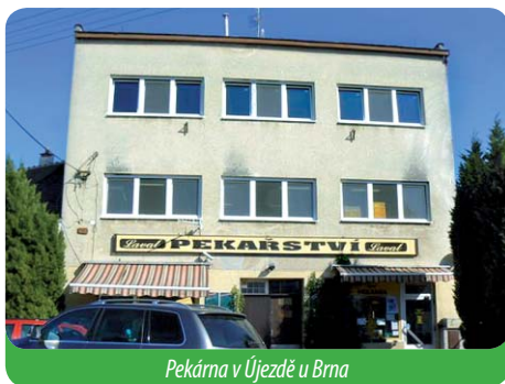
Pekárna v Újezdě u Brna