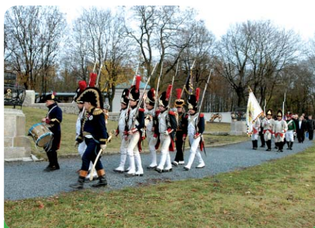
Slavnostní položení věnců na Mohyle míru za přítomnosti zástupců Mohyla míru - Austerlitz, o. p. s., JMK a dalších hostů