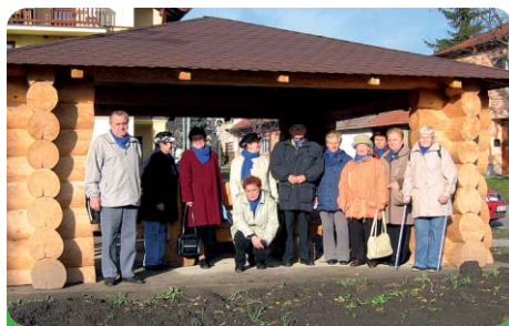
Pochod proti diabetu