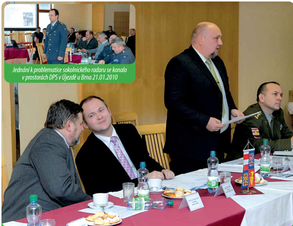
Starosta města s hejtmánem JMK