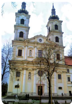
Překrásná Bazilika Panny Marie Sedmibolestné v Šaštíně se nakonec neplánovaně stala naší první zastávkou. Stálo to za to!

Dalším velice vydařeným zájezdem byl zájezd pro seniory, a to vánoční Bratislava s návštěvou přilehlého města Haiburg. Navštívili jsme dva státy – Slovensko a Rakousko a všude vládla vánoční nálada. Zbýl čas i na nákupy. Bylo to příjemné rozptýlení, ale i porovnání mezi vánoční atmosférou slovenskou a rakouskou.