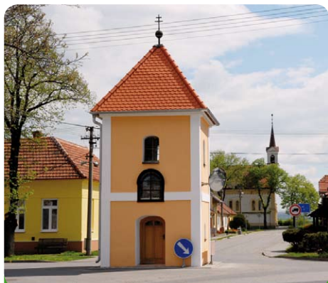
Takto dopadla oprava

oprava omítek, zavedení elektřiny a jak jinak nátěry. Z fotografie je patrný nejen postup, ale i výsledek.