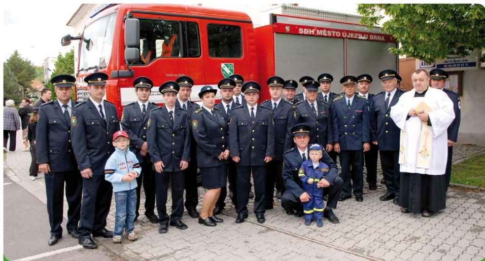
Pan farář požehnal nejenom novému autu, ale i všem ostatním