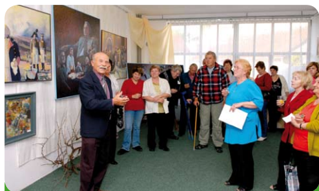
Výstava J. Červinky ve Vzdělávacím centru U Kapličky