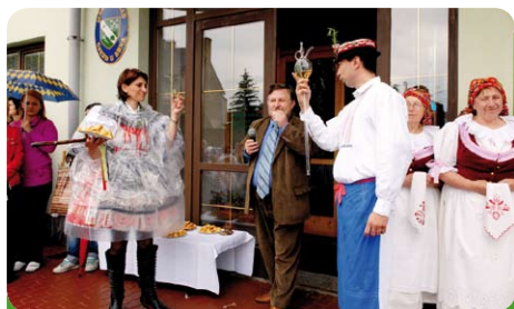
Babské hody začínají - předání Babského práva (22. 05. 2010)