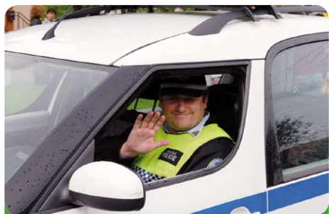
Velitel naší policie Petr Macák