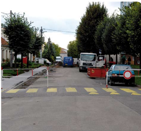
Rekonstrukce chodníků před školou - září 2010