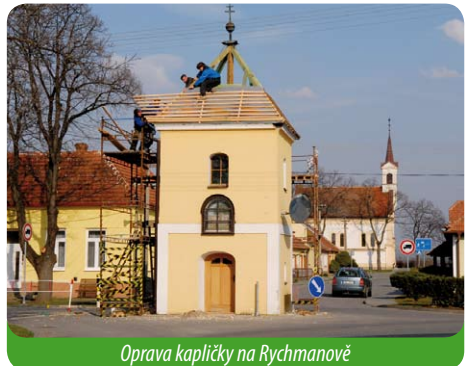
Oprava kapličky na Rychmanově

Kaplička na Rychmanově potřebovala střechu. Byla opravena v tomto desetiletí již podruhé. Osazení okny, dveřmi,