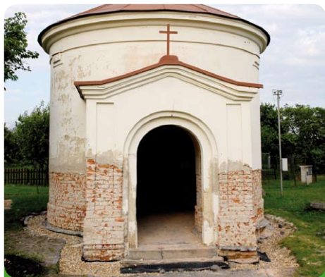
Zahájena oprava kapličky sv. Antonína Paduánského

Do výše 1,5 m byla podél venkovních základů položena novopá izolace. Vzhledem k vlhkosti kaple, jsme museli při-