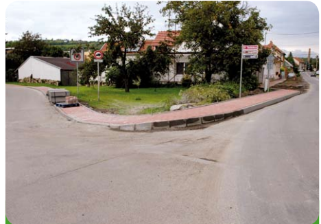
Rekonstrukce chodníků k penzionu