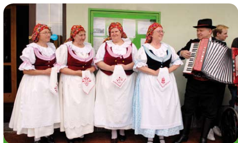
Zpěvačky na Babských hodech