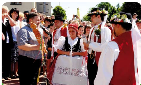
Předávání práva dne 27. 06. 2010 - hody