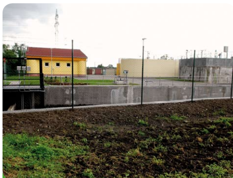
Takto vypadá čistička z boku

Několik fotografií ze dne otevření dveří 13. 09. 2010.