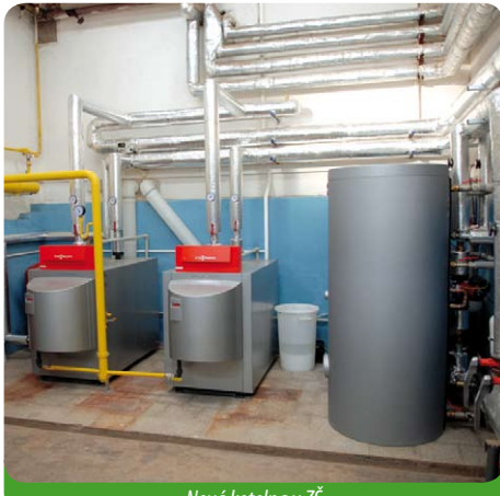
Nová kotelna v ZŠ

Dokonce jsme na rekonstrukci školní kotelny obdrželi z JMK dotaci.