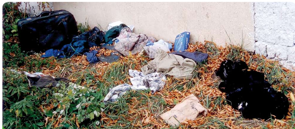
Je to vůbec možné, když máme sběrný dvůr a 6 menších sběrných míst. Co to musí být za člověka?