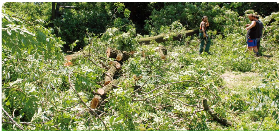
I u nás došlo ke kalamitě (27. 06. 2010)