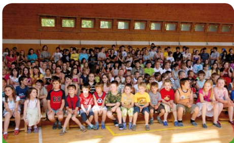
Konec školního roku v létě 2010