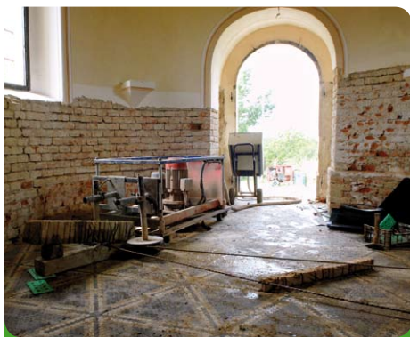
Takto byla podřezávána a izolována kaple sv. Antonína Paduánského.