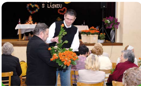
Svátek matek 08. 05. 2010