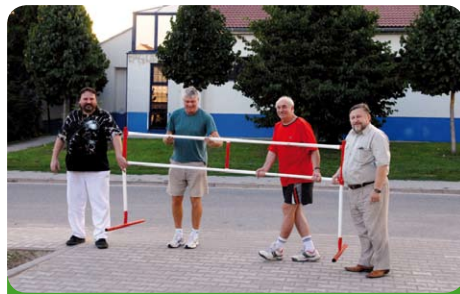
Otvíráme parkoviště za poštou