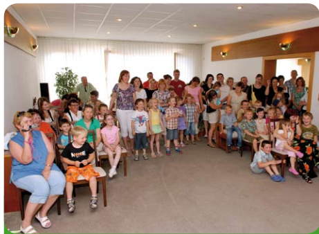
Děti z MŠ a jejich rodiče na MěŮ na konci školního roku