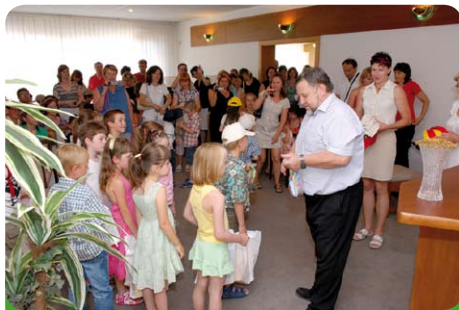
Slavnostní zakončení školního roku dětí, které jdou ze školky do školy