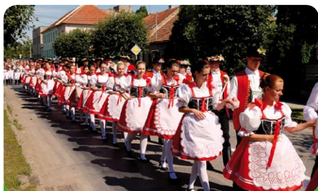
Hody 27. 06. 2010 - průvod městem