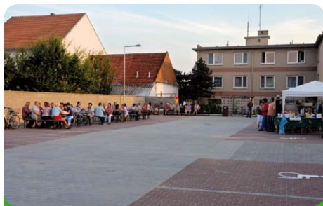
Slavnost při otevření parkoviště 13. 08. 2010