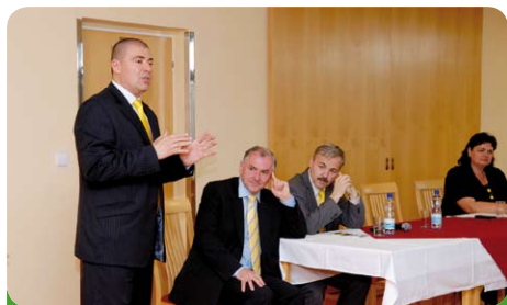
KDU 24. 05. 2010 v DPS