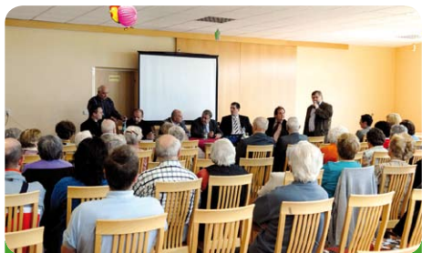
ČSSD projednává problematiku stáří (21. 05. 2010)