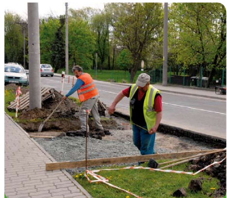
Vlastními silami doplňujeme chodníky - přechody tak, aby i starší lidé či malé děti měli možnost přejít