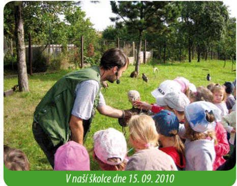
V naší školce dne 15. 09. 2010

Dokladem cílené spolupráce všech (tedy zřizovatele, rodičů, zaměstnanců školy, partnerů a přátel školy) je dobře fungující mateřská škola, která během tří let dokázala zvýšit a zkvalitnit vzdělávací nabídku natolik, že se i rapidně snížil počet odkladů školní docházky.