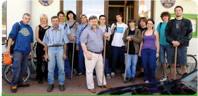
Po vyhlášení brigády městem se sešli zájemci o práci