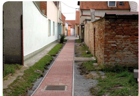
I tato ulička má svůj chodník