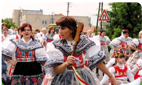
Už zase někoho diriguje