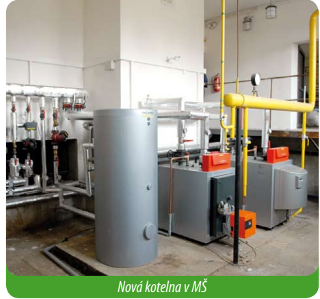
Nová kotelna v MŠ

Všechno stárne. To nejlépe vidíme sami na sobě. A tak se dvě budovy, škola a školka, dostaly do velkého problému. Ze zákona byla povinnost vykonat revize ústředního topení a plynofikace ve všech nemovitostech patřících městu. Revize dopadly pro město velice špatně. Bylo nutno vyměnit kotle ve zdravotním středisku, kotel na radnici, protože stávající maďarský kotel se již nedal opravit, neboť maďarská dodavatelská firma již přestala vyrábět náhradní díly. To bylo ještě jednoduché. K nepříjemnému zjištění ale došlo právě v případě kotelny ve škole a školce. Představili jsme si tragédii, ke které by došlo, kdyby se cokoliv stalo. Zadalí jsme proto projekt a rozhodnutím Zastupitelstva zrekonstruovali obě dvě kotelny tak, že vyhovují nejenom bezpečnostním normám, ale svojí kvalitou vyhovují normám kotelen 21. století. Podařilo se.