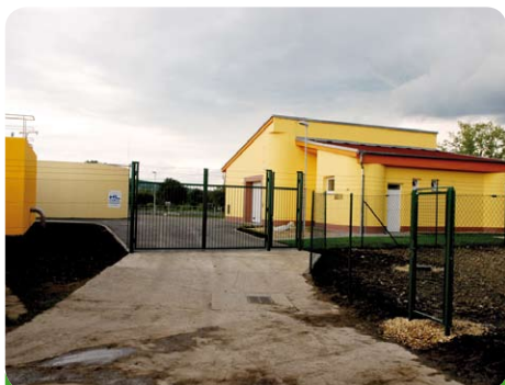
Den převzetí díla nové čističky od firmy Pozemstav Brno

Takto vypadá naše nová čistička odpadních vod. Posudte sami, zda se dílo povedlo.