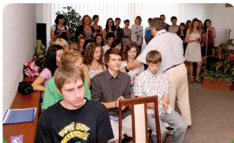
Loučení s absolventy 9. tříd naší školy