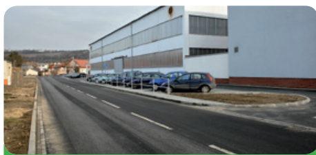
Parkoviště u firmy Elseremo Stage Technology, a.s.