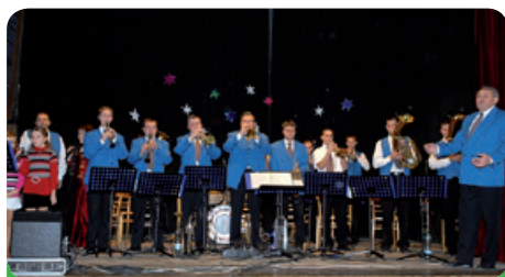
Vánoční koncert dechové hudby Dambořanka (11.12.2011)