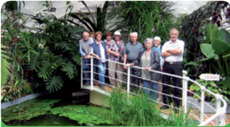
Výstava masožravých rostlin