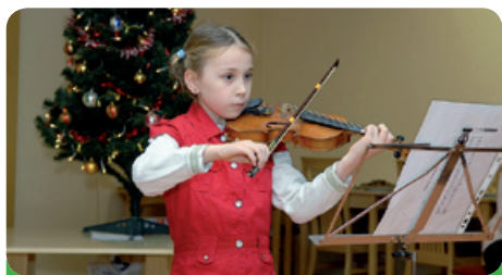
Housličky v DPS – koncert (11.12.2011)