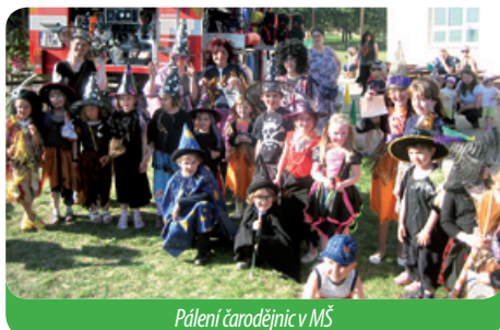
Pálení čarodějnic v MŠ