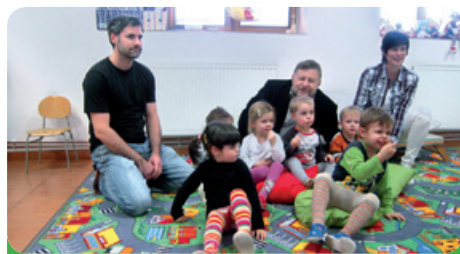
Návštěva starosty města v malé školce