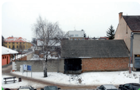
Kalvodova stodola (15.2.2010)