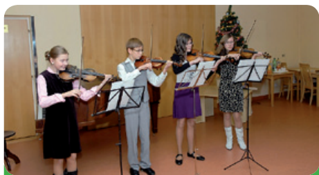
Housličky v DPS – koncert (11.12.2011)