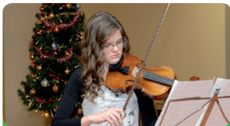
Housličky v DPS – koncert (11.12.2011)