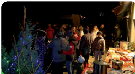
Rozsvícení stromečku (3.12.2011)