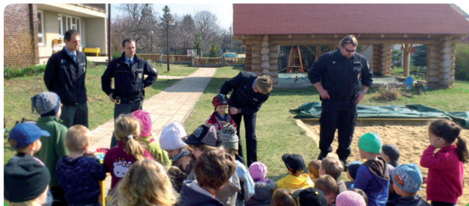
Beseda s městskou a státní policií v mateřské školce