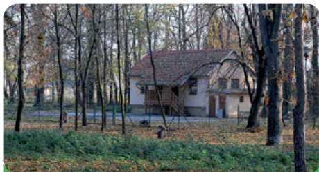
Klubovna pro mládež v parku u koupaliště