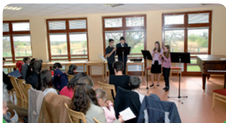
Vystoupení dětí k výročí osvobození Újezdu