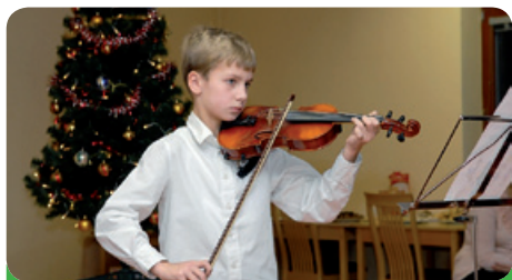
Housličky v DPS – koncert (11.12.2011)