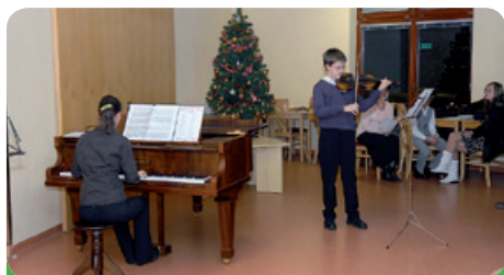
Housličky v DPS