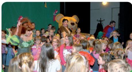
Dáda v akci s újezdskými dětmi