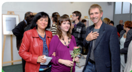
Výstava U kapličky (7.10.2011)