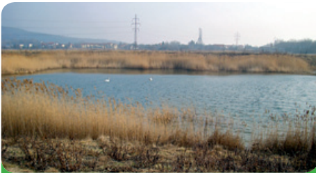
Šmolcus a jeho přirozená krása

Když se podíváte na obce podobné velikosti, tak mnohdy z nich musí prodávat svůj majetek, pozemky, aby ekonomicky udržely chod obce. My pro změnu stále a stále nakupujeme pozemky, či budujeme nové nemovitosti. Újezdská skládka je dnes opětovně zařazena mezi ošetřené recyklované pozemky, vždyť déle než cca 140 let tam každý, kdo mohl, navezl od stavební sutě až po chemické odpady cokoliv. Na tuto skládku jsme vysadili 1 500 stromů a keřů. Vznikne tam krásný háj. Ale bude to pochopitelně pár desítek let trvat. Radovat se z toho budou až naše děti. Můžeme se však podívat na druhou stranu katastru města. Například Šmolcus, dnes je tam opravdu krásný mokřad s rybníčkem, ale i zde je vysazeno přes 1 000 nových sazenic stromů a keřů. To vše se musí okopávat, na zimu ošetřovat, je za tím ukryto mnoho práce, která není vidět. I zde jednou bude překrásná část újezského katastru. Rovněž na to jsme dostali dotace z Evropských fondů. O těchto místech jsem hovořil zcela úmyslně, abychom si uvědomili, že to bylo místem, které volalo po rekonstrukci. Byly tam vyvezeny staré