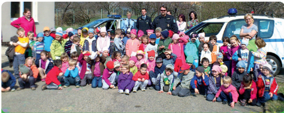
Beseda s městskou policií v mateřské škole