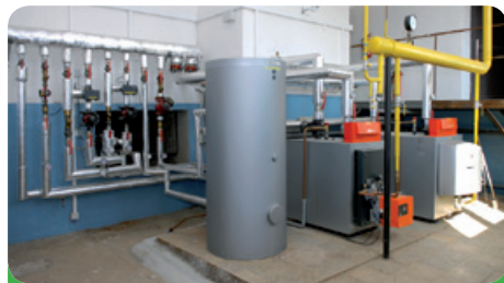
Kotelna v MŠ 20.4.2012