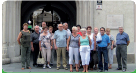
Výlet diabetiků do podzemí