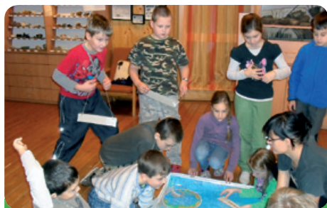
Jezírko výukový program