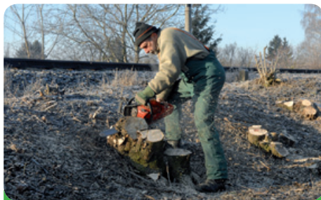
Rychlá rota za tratí dne 21.2.2012

má vlastní areál, kde je kancelář, dílna, skladovací prostory a je tam zaparkována komunální technika, ale je zde i místo, kde se mohou pracovníci scházet – převlékat, sprchovat, a jiné. Toto vybavení je: speciální vozidlo Mercedes Unimog s nástavbou sypače a radlice, čistící a zametací vůz IFA, nakladač JcB 1110, 2x Multikára, traktor Zetor a traktorová vlečka 4x. Dále komunální technika na údržbu zeleně: 5x sekačky s pojezdem značky Stiga, 3x křovinořez značky Jonsered, 1x traktůrek na sečení Jonsered, vertikutátor John Deere, 4x motorobot Dakr, který je i na zimní údržbu. Benzinová motorová pila Jonsered, benzinový fukar Stihl, benzinový plotostřih Husqvarna. Elektrocentrála Honda na benzinový motor a bourací kladiva Milwaukee a Makita a profi vibrační deska Ansmann.