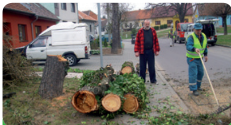
Modřiny v Sádku