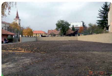
Odpočinková zóna - Park JUDr. Jana Haluzy (5.11.2011)