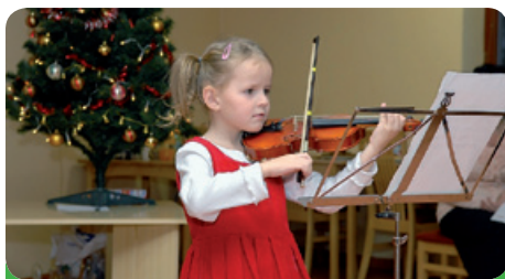
Housličky v DPS – koncert (11.12.2011)