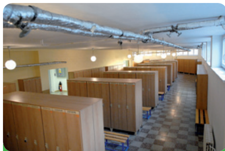
Nové šatny v ZŠ