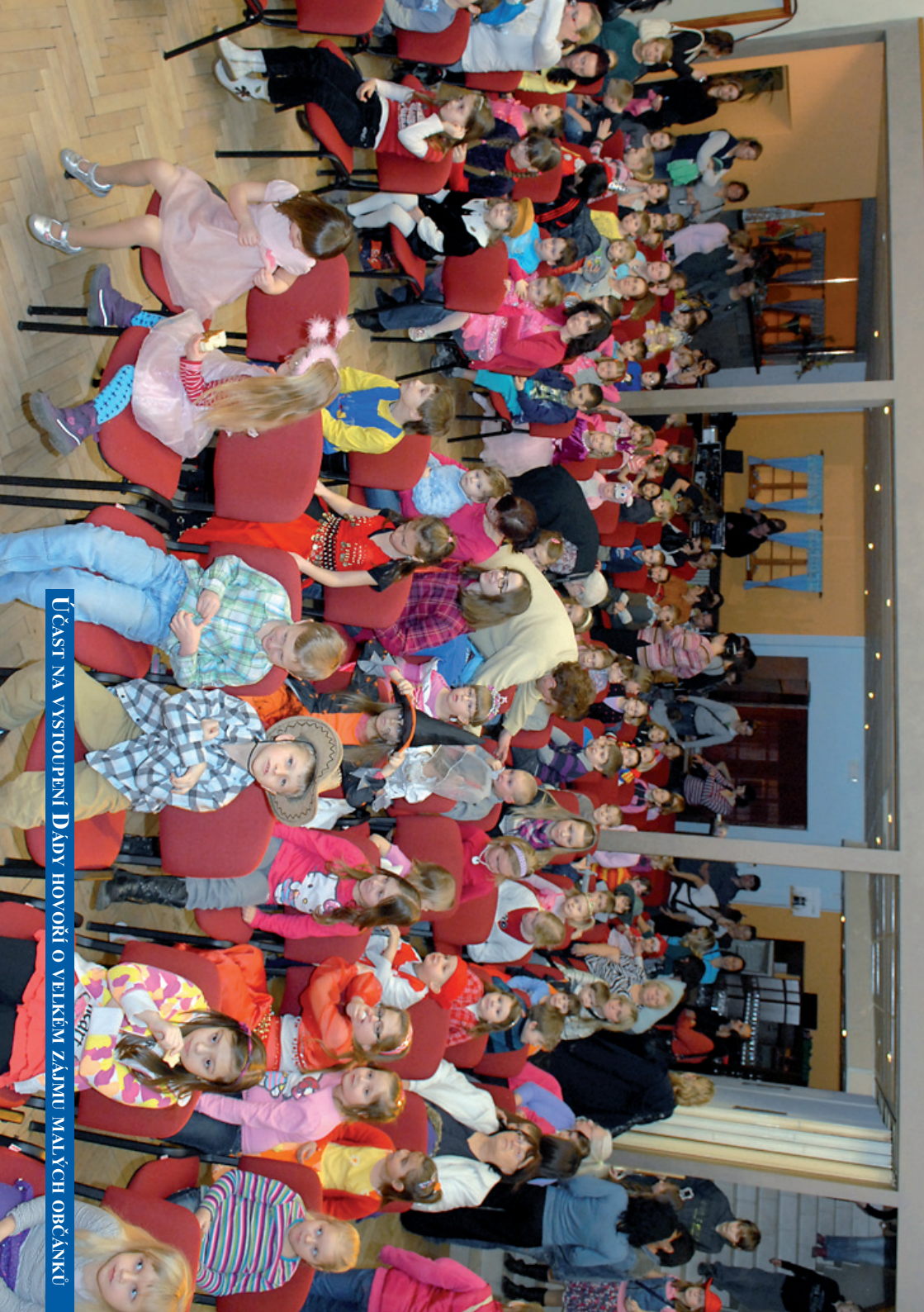
ÚČAST NA VYSTOUPENÍ DÁDY HOVOŘÍ O VELKÉM ZÁJMU MALÝCH OBČÁNKŮ