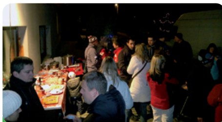
Rozsvícení vánočního stromku na ulici Příční