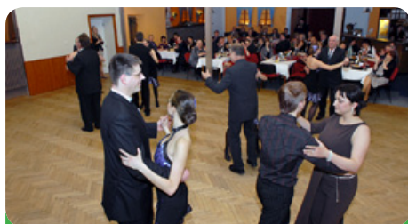
VIII. Reprezentační ples města (17.2.2012)