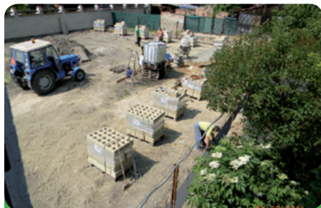
Odpočinková zóna - Park JUDr. Jana Haluzy (31.5.2011)