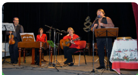
Adventní koncert brněnského souboru Gajdoši (9.12.2011)