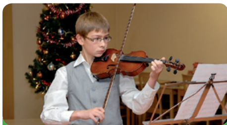
Housličky v DPS – koncert (11.12.2011)