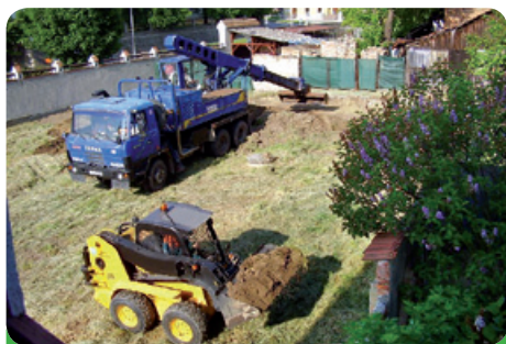
Odpočinková zóna - Park JUDr. Jana Haluzy (květen 2011)