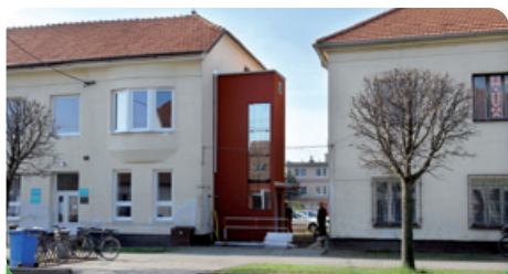
Výťah pro zdravotní středisko