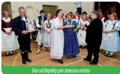
Dar od Bejatky pro starostu města