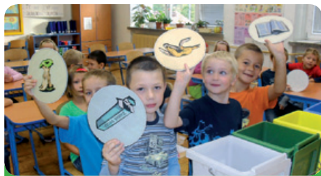
Tonda obal na cestě - výukový program ve škole