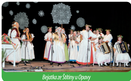
Bejatka ze Štítiny u Opavy