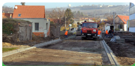
Silnice u firmy Elseremo Stage Technology, a.s.