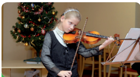
Housličky v DPS – koncert (11.12.2011)