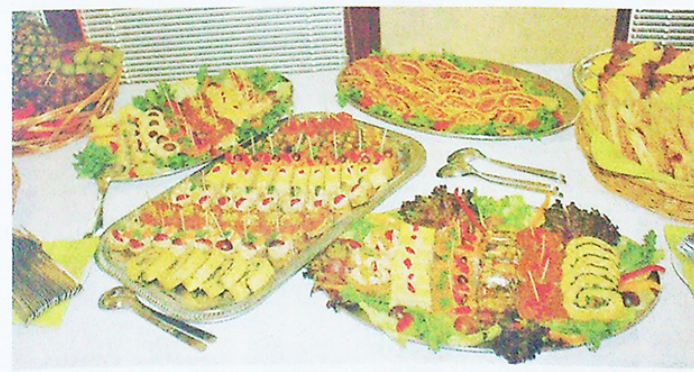
POTĚCHA PRO OPRAVDOVÉ GURMÁNY. Nejen pokrčená kuchařská příručka, ale i slavnostní tabule ke křtu byly velmi inspirativní záležitostí.

žertovalo se o její vizi a budoucnosti kam kráčí – vstříc Evropě. Dalším bodem bylo seznámení se s novými webovými stránkami Eurobi, poté již následoval raut z dobrot teplé a studené kuchyně prezentovaného výrobce Robi. (P)