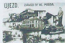
PLAKÁT Z ARCHIVU.

Jsem dost „staří“, abychom mohli stavět na profesionál-