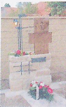
PARK JUDR. HALUZY.