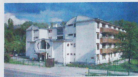
PENZION PRO SENIORY V ÚJEZDU U BRNA.