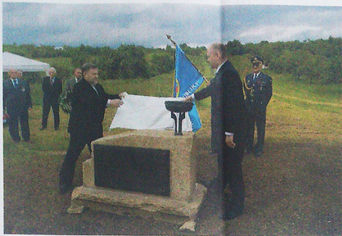
LOŇSKÉ ODHALENÍ POMNÍKU K LETECKÉ TRAGÉDII Z ROKU 1962.

Cesta do našeho „vojenského“ zařízení je zčásti naše