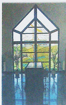
OBŘADNÍ SÍŇ V ÚJEZDU U BRNA.

bovně je množství her, ale i dva počítače, záleží však především na tom, proč tam dítě přichází.