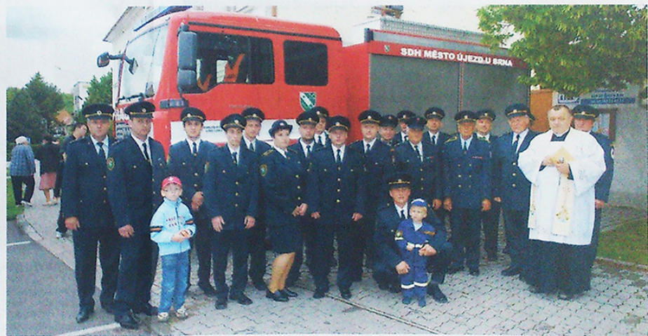
SBOR DOBROVOLNÝCH HASIČŮ V ÚJEZDU U BRNA.