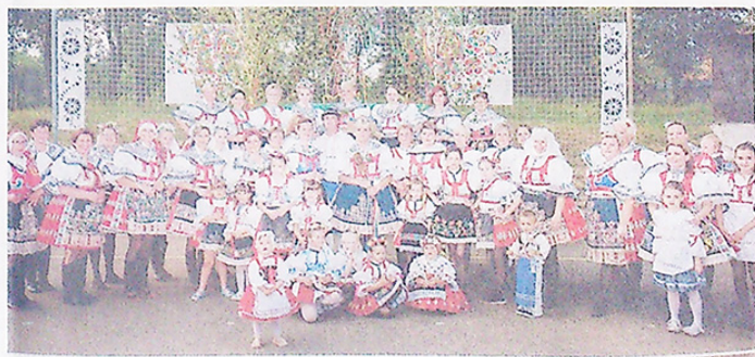
BABSKE HODY V ÚJEZDU U BRNA HŘÍŘÍ NÁDHERNÝMI KROJÍ.

– Malebný rybník, takéž v části Rychmanov, má na svém břehu vodníka Tonička v životní velikosti, který je centrem pravidel-