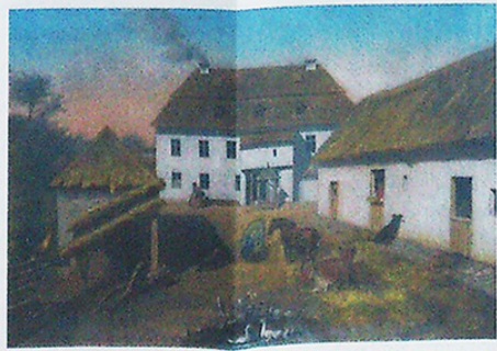
OBRAZ FARY V ÚJEZDU U BRNA.