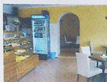
INTERIÉR CUKRÁRNY VANILKA V ÚJEZDU U BRNA. Nabízí i pohodu.