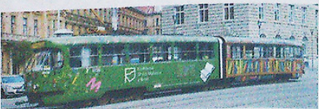
VELKOPLOŠNÝ POLEP TRAMVAJE.