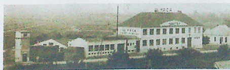
HISTORIE. Snímek někdejší továrny nábytku.

Reklamní agenturu a tiskárnu Kangaroo jsme založili v roce 2004. A proč sídlíme v Újezdu u Brna? Právě tady začínalo v roce 1928 podnikání naší rodiny. Dnes nás najdete ve stejné budově, kterou postavil náš pradědeček Vladislav Máca: od roku 1927 až do roku 1948 zde vyráběl nábytek, a my jsme na tuto tradici náležitě pyšní. Po únoru 1948 byl podnik s padesáti zaměstnanci v rámci likvidace soukromého výrobního sektoru znárodněn a přешel pod UP Rousínov. Vladislav Máca poté strávil tři roky v pracovním tábore. V roce 1952 převzalo provozovnu kovodělné výrobní družstvo Drukov a stolařská výroba byla zrušena. Zabavené budovy byly naší rodině částečně navráceny zpět až po roce 1989.