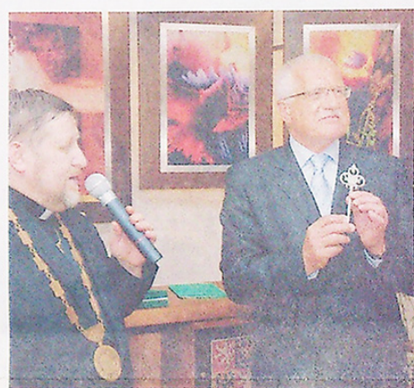
ČESTNÝ OBYČAN ÚJEZDU U BRNA. Stal se jím někdejší prezident Václav Klaus při převzetí symbolického klíče od města a dekretu s udělením titulu Čestný občan města. Klíč mu předal starosta města Jan Hradil (na snímku vlevo).