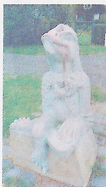
VODNÍK TONIČEK U RYBNÍKA.