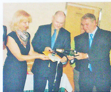
SLAVNOSTNÍ KŘEST KUČAŘKY.

Několik milých a vtipných postřehů na adresu společnosti přinesl pan starosta i pan hejtmán. Každý také zavzpomínal na první setkání s firmou a za-