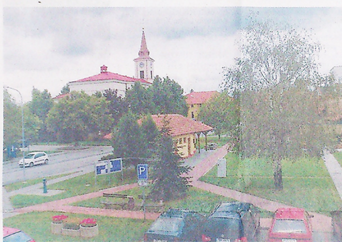
UPRAVENÝ PARK ZDOBÍ CENTRUM MĚSTEČKA ÚJEZDU U BRNA.

Bitva tří císařů, konaná dne 2. 12. 1805, probíhala také na katastru obce Újezd u Brna. Podle některých historiků první výstřely zazněly od Kaple sv. Antonína Paduánského, na úpatí Staré hory, která se svažuje do našeho města. Bitva zanechala hruznou stopu. Množství padlých