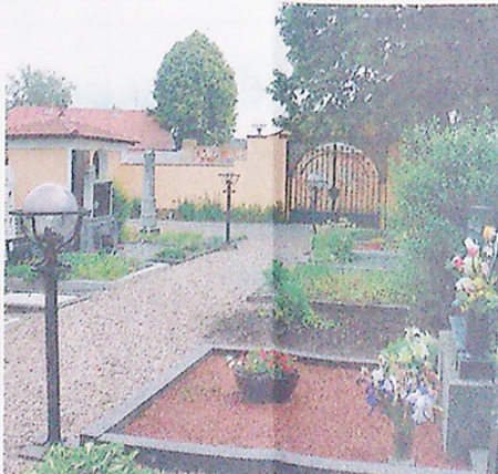
EVANGELICKÝ HRBITOV V ÚJEZDU U BRNA.