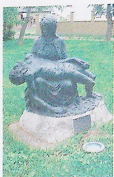
PIETA. Jde o pomník padlým civilistům.