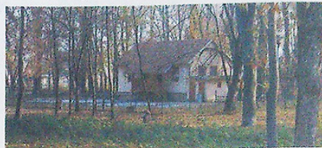
KLUBOVNA PRO MLÁDEŽ V PARKU U KOUPALIŠTĚ.

Klubovna pro mládež v parku u koupaliště je zařízení, které v týdnu, ale i v sobotu od 13.00 do 18.00 hodin dává prostor dětem, které jsou samy doma. Děti mohou navštívit klubovnu jak volnočasově zaměřenou, tak je zde také učitel, který je placen městem, dětem pomůže s domácími úkoly a jiným. V klubu