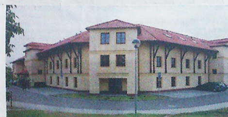
DŮM S PEČOVATELSKOU SLUŽBOU V ÚJEZDU U BRNA.