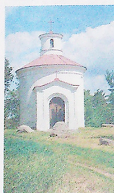
KAPLE SV. ANTONÍNA PADUÁNSKÉHO.

JUDr. Haluza byl teprve po devadesáti letech městem rehabilitován a stal se čestným občanem města.