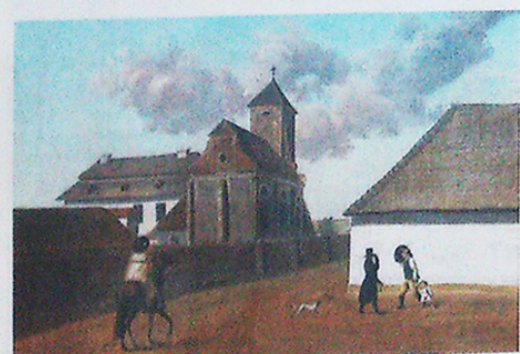
OBRAZ KOSTELA V ÚJEZDU U BRNA.