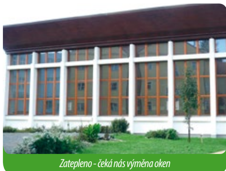
Zatepleno – čeká nás výměna oken