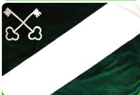
Vlajka města Újezd u Brna