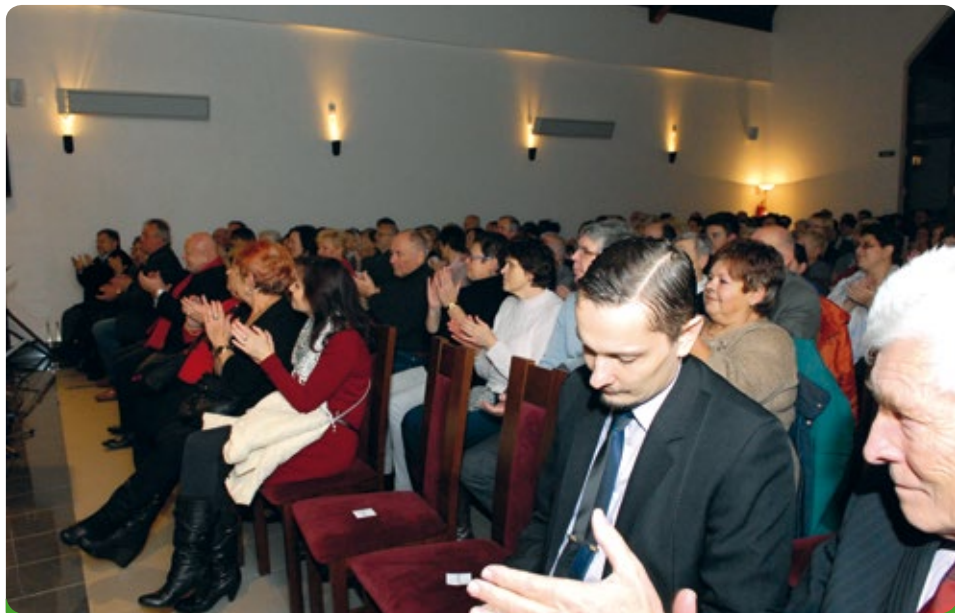
Koncert konaný dne 29. 11. 2014 v Obřadní síni města