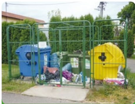
Sběrná místa nejsou skládkou nepotřebného odpadu

Sběrná místa tříděného odpadu nejsou skládkou nepotřebného. V našem městečku se můžeme stále setkat s velkým nepořádkem na sběrných místech pro tříděné odpady, kdy je až s podivem, co jsou někteří občané schopni jako nepotřebné na těchto místech odložit. Stavební suť, pytle se směsným odpadem, pneumatiky, staré oblečení, plasty z autovraků, apod., to vše je zde možno nalézt. Zde umístěné kontejnery slouží ke sběru papíru, plastů a skla. U dvou sběrných míst se nachází i kontejnery pro sběr elektrozařízení. Ostatní odpad je možno odevzdat ve sběrném dvoře na ulici Štefánikova.