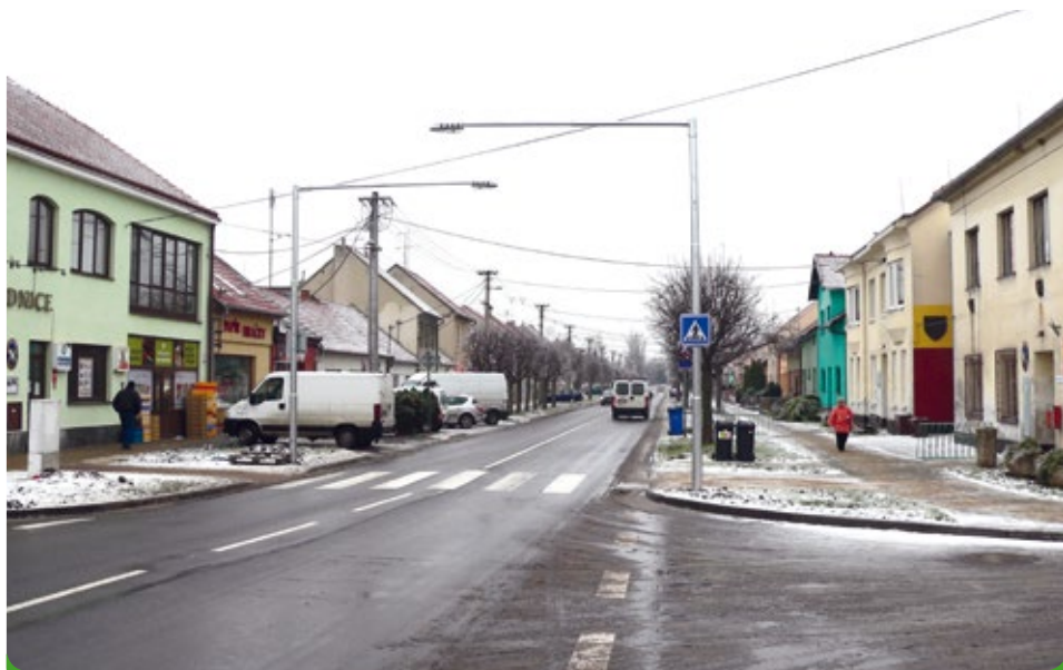
Nový přechod včetně osvětlení