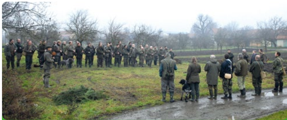
Hon, konaný dne 6. 12. 2014