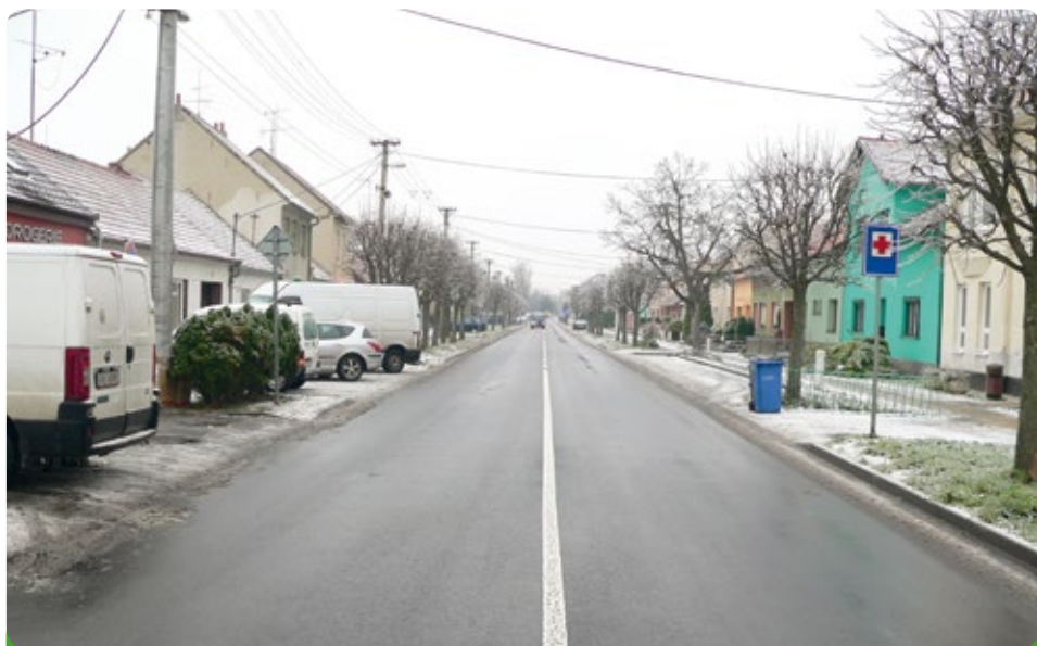
Nový průtah ulice Komenského