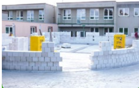
První „šáry“ hrubé stavby