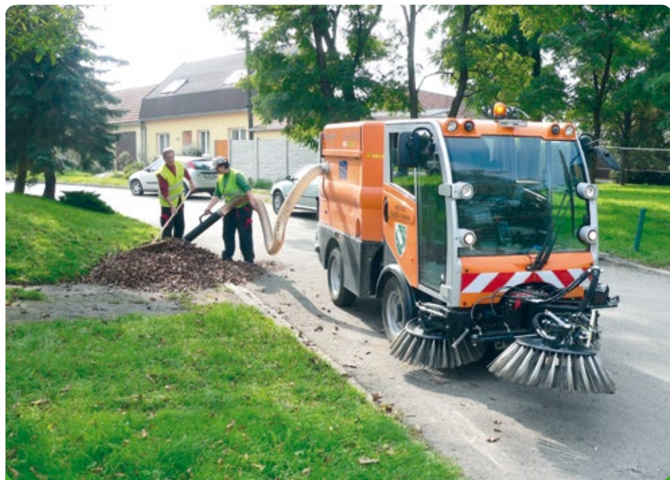
Nový zametací vůz - zvaný Kocour