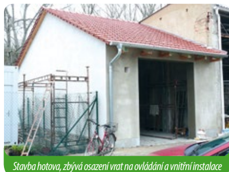
Stavba hotova, zbývá osazení vrat na ovládnání a vnitřní instalace