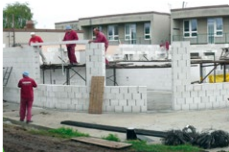
Blížíme se pod „věnec“