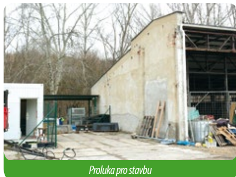
Proluka pro stavbu