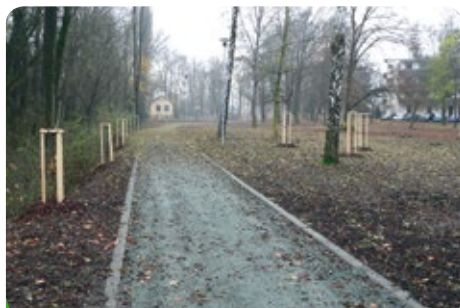
Výsadba nových stromů v parku