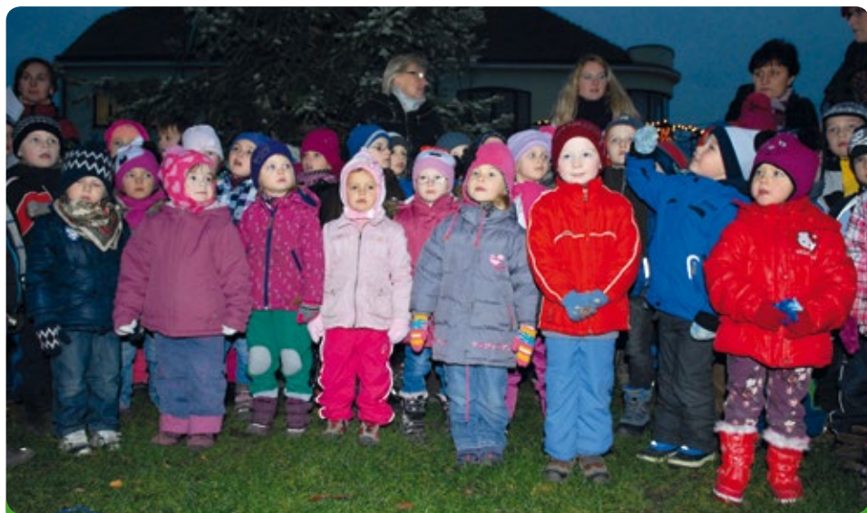
Rozsvícení stromečku před radnicí dne 30. 11. 2014