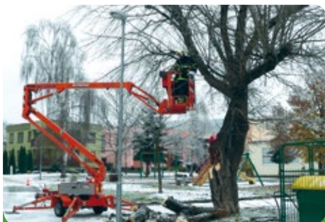
Kalamitu dne 2. 12. 2014 zvládli nejen hasiči,