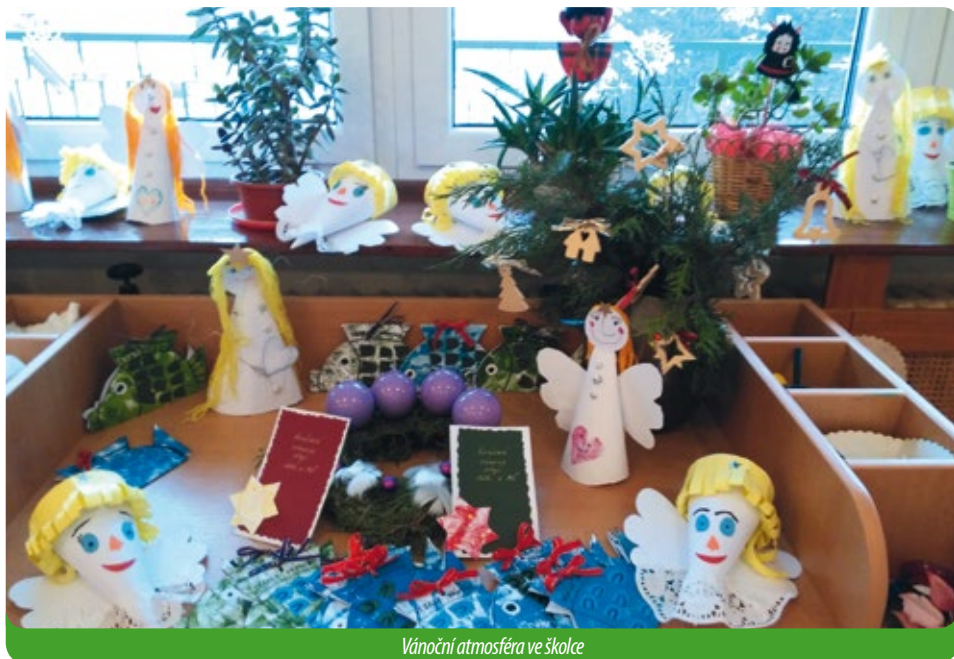
Vánoční atmosféra ve školce