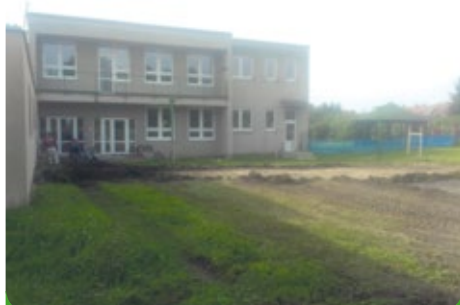
Zahájení akce skryvkou ornice