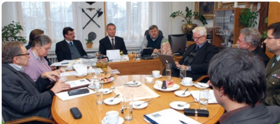
Biskupové Ekumenické rady církve Slovenska

slav Donutil, Dáda Patrasová, Václav Hudeček, Felix Slováček, Jiří Krampol, Martin Stropnický, avšak fotka, která je pod tímto textem svědčí o faktu, že dne 3. 12. 2014 nás navštívili biskupové Ekumenické rady církve Slovenska.