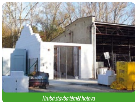
Hrubá stavba téměř hotova