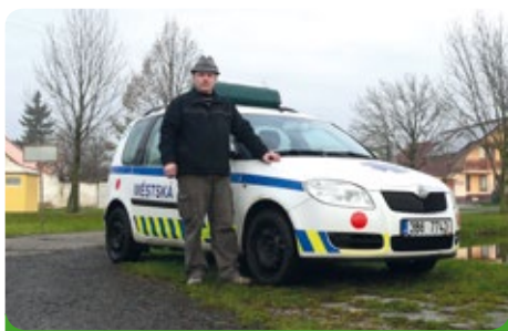
Sociální služba pro občany města