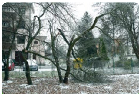
Větve se lámaly nejen u penzionu