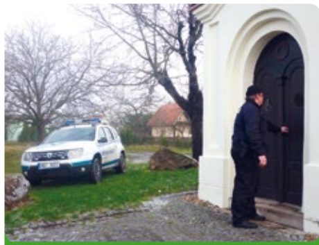
Městská policie na kontrolní obchůzce

Sběrná místa tříděného odpadu nejsou skládkou nepotřebného. V našem městečku se můžeme stále setkat s velkým nepořádkem na sběrných místech pro tříděné odpady, kdy je až s podivem, co jsou někteří občané schopni jako nepotřebné na těchto místech odložit. Stavební suť, pytle se směsným odpadem, pneumatiky, staré oblečení, plasty z autovraků, apod., to vše je zde možno nalézt. Zde umístěné kontejnery slouží ke sběru papíru, plastů a skla. U dvou sběrných míst se nachází i kontejnery pro sběr elektrozařízení. Ostatní odpad je možno odevzdat ve sběrném dvoře na ulici Štefánikova.