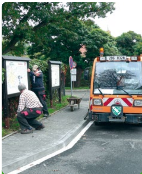
Pomoc sousednímu Domovu důchodců v Sokolnicích