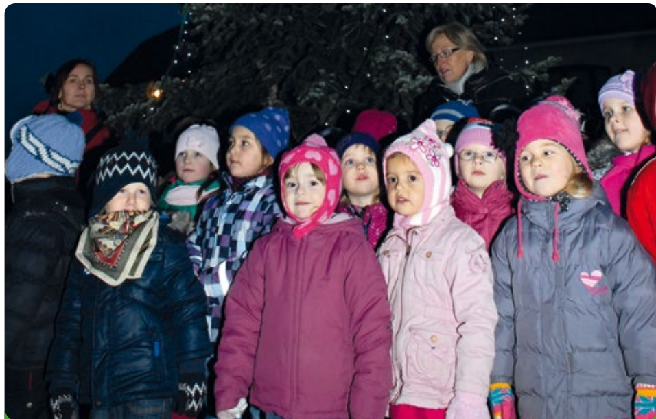
Vánoční pásmo básní a písní předvedly děti z MŠ