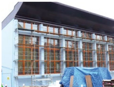
Zahájení akce stavbou lešnění