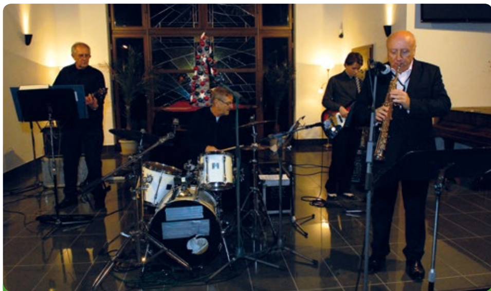
I. adventní koncert Felixe Slováčka