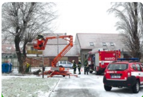
ale i pracovní skupina města