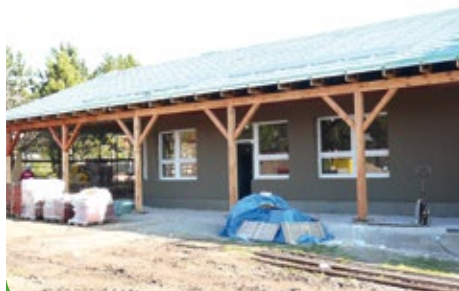
Hrubá stavba včetně instalací hotova