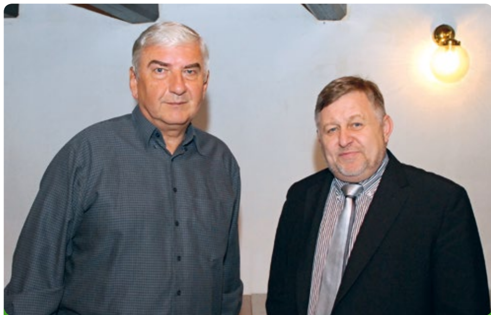
Miroslav Donutil v pořadu Ptejte se mě, na co chcete, já na co chci, odpovím