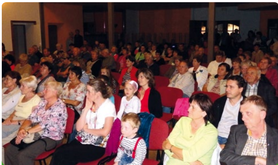
Koncert, konaný dne 24.8.2014 v sále restaurace Na Rychtě