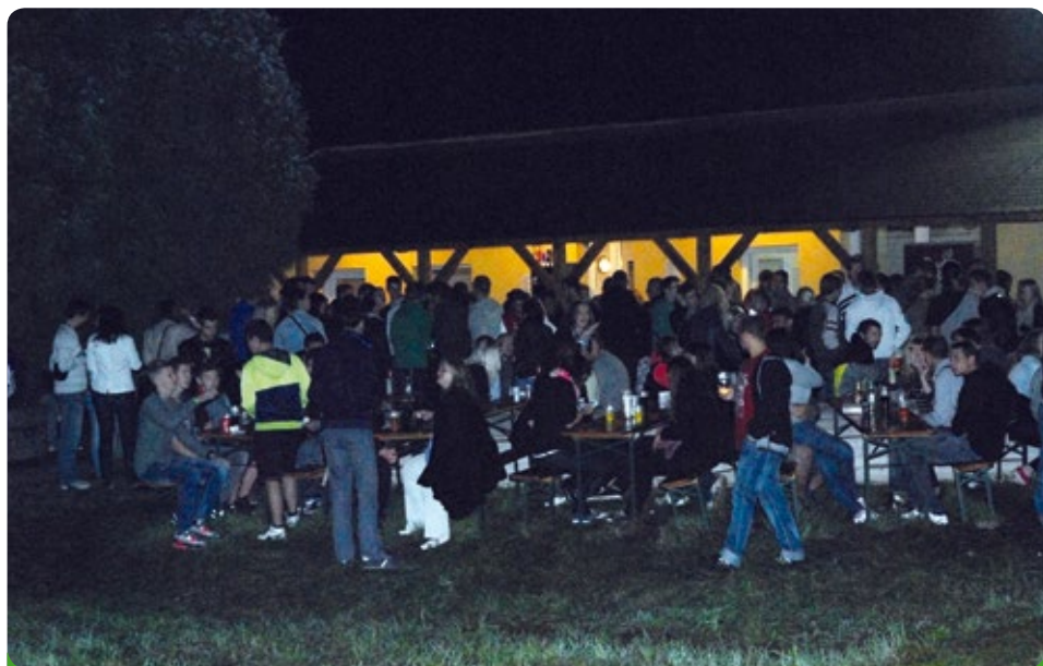
Akce, konaná dne 16.8.2014 na městském koupališti