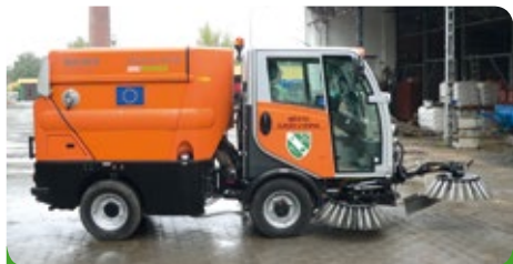
Nový čistící vůz již s označením města