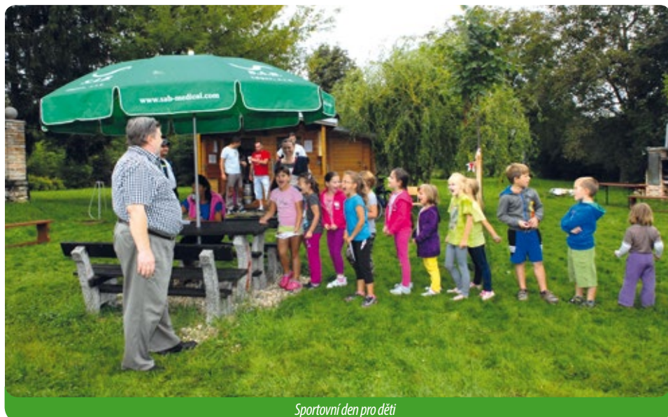
Sportovní den pro děti