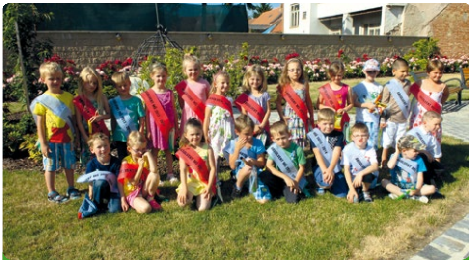
Loučení s předškoláky dne 23.6.2014

Jak krásně se naše mláďd vyjímá v parku JUDr. Jana Haluzy.