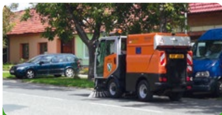
Vůz již nestojí v garáži, ale celý den pracuje

Dva dny uklízíme hromady starých betonů. Kde jsou ty časy, kdy kolem Újezdu ležela betonová pohřebiště. Je to skutečně až 100 tun, které nám tento stroj zpracuje a my drť použijeme jako podklad do námi budovaných chodníků.