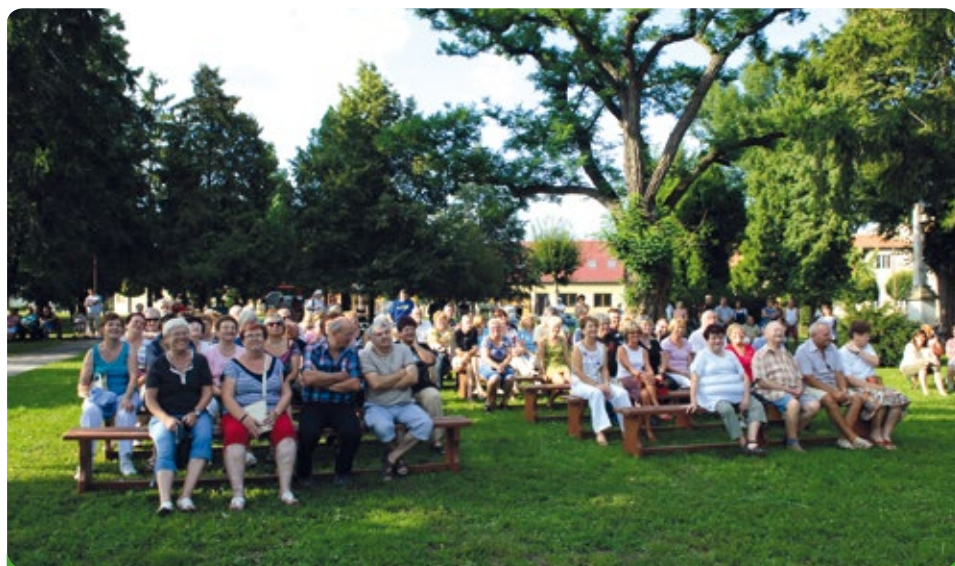
Koncert, konaný dne 10.8.2014