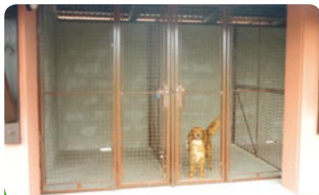
První návštěvník útulku

I zde bylo mnoho problémů. Diskuze s některými zastupiteli města o potřebě i nepotřebě tohoto zařízení. Pejsci byli zavřeni i mnoho měsíců na dvoře Radnice a bezprizorně pobíhali. To přece není lidsky možné.