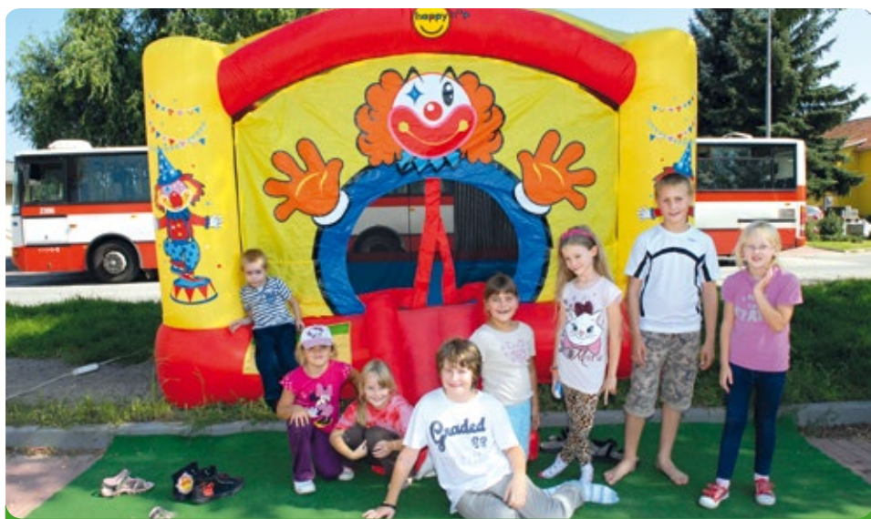
Akce pro děti, konaná dne 8.9.2014