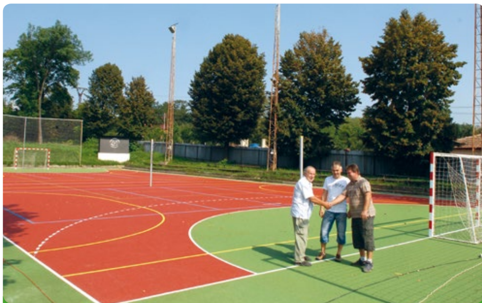
Předání házenkářského hřiště TJ Sokolu dne 5.9.2014