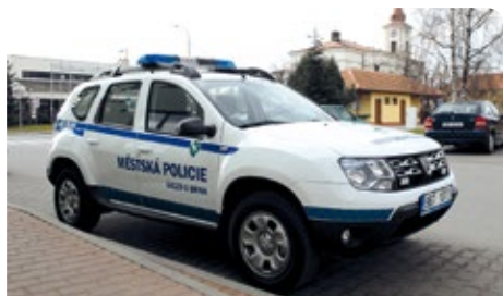
Auto Městské policie Dacia Duster 4 x 4