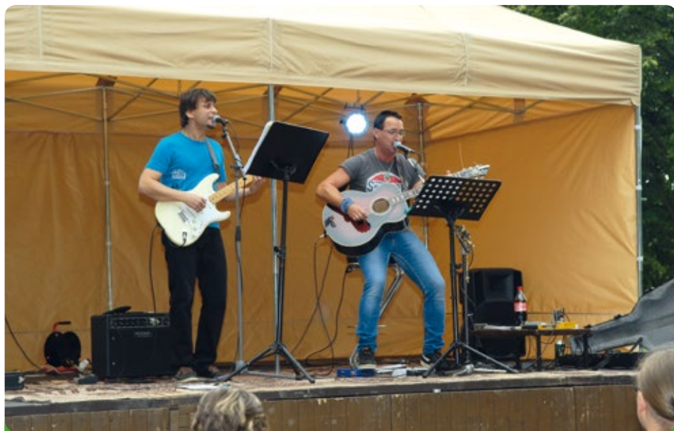
Koncert Jiřího Bartase - pro mládež