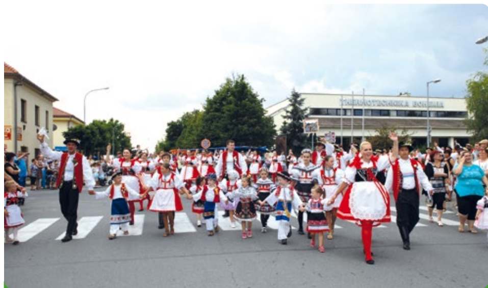
Konané dne 29.6.2014