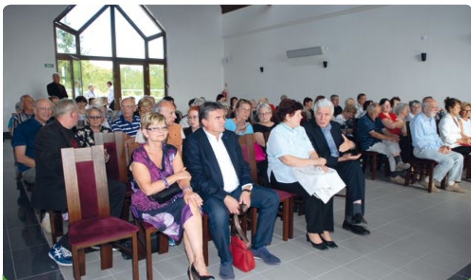
Koncert pro housle a klavír, konaný dne 27.6.2014