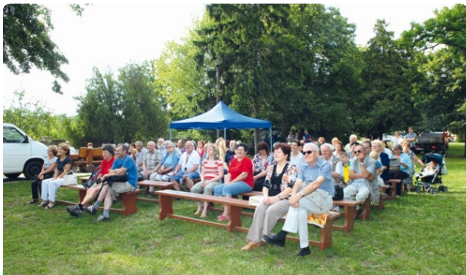
Koncert v parku, konaný dne 13.7.2014