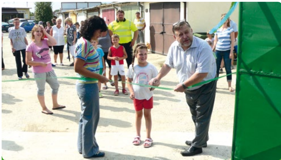
Přestřižení pásky při otevření útulku pro zatonaná zvířata

Zájem dětí a dospělých byl opravdu nad očekávání. I zde se projevuje lidskost.