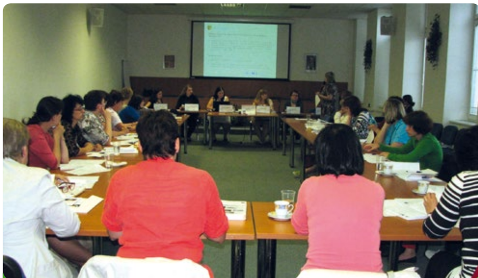
Akce kulatý stůl

V říjnu 2014 je naplánované druhé setkání u kulatého stolu, kde se bude OSPOD věnovat tématu záškoláctví, týraných dětí a úvodu do drogové problematiky dětí.