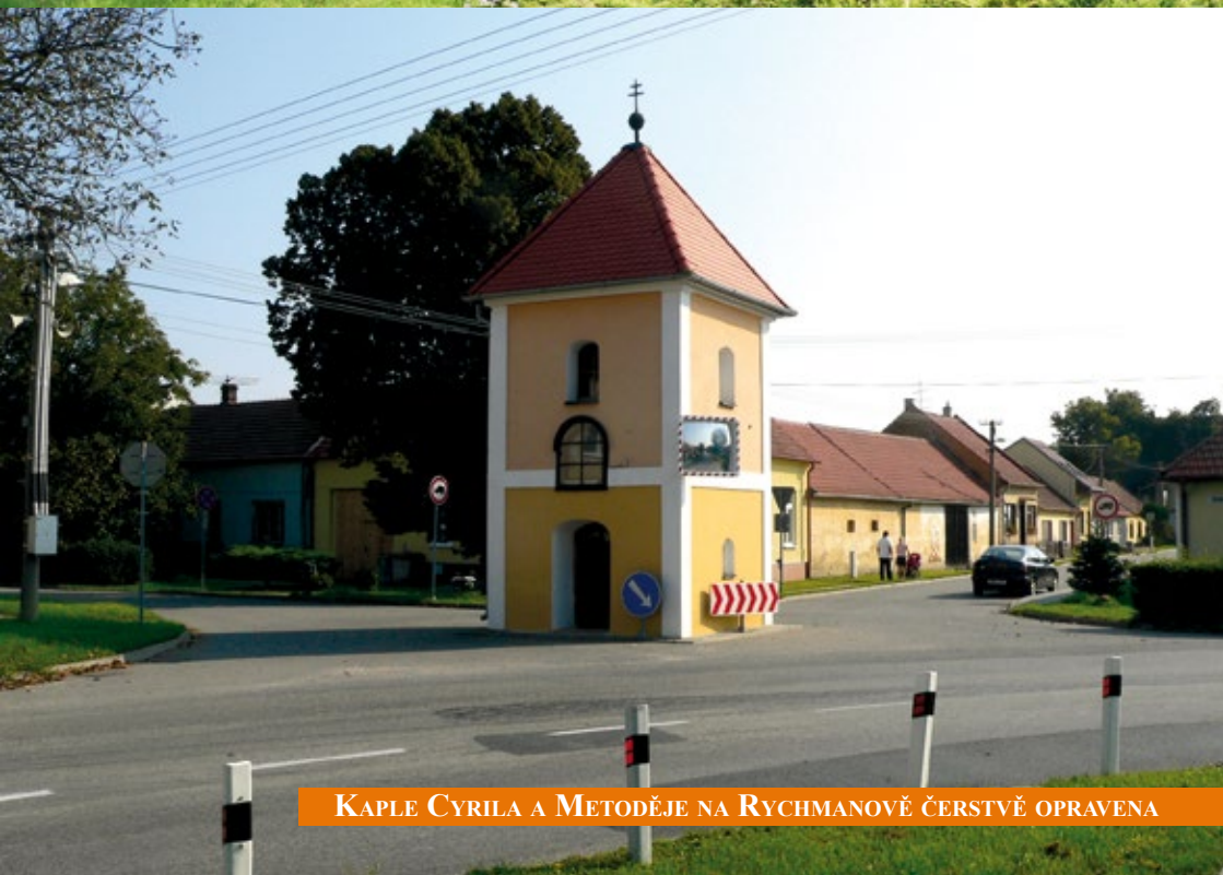
KAPLE CYRILA A METODĚJE NA RYCHMANOVĚ ČERSTVĚ OPRAVENA