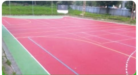
Nové házenkářské hřiště TJ Sokol z dotací města 700.000,- Kč