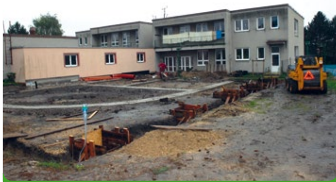
Přístavba nové třídy v mateřské školce

Opravdu to trvalo. Stavební povolení, projekt a jiné a jiné. Sehnali jsme dotaci a koncem roku bude zbudován nový pavilon mateřské školy.