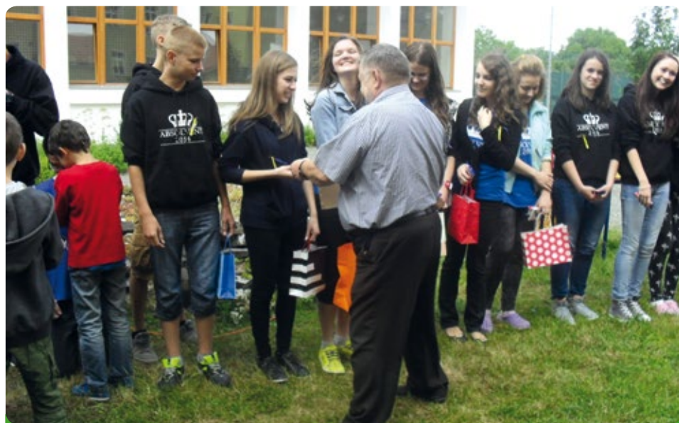
Každá škola má nejlepší žáky, ale i žáky zlobivé, ti se však nefotí...