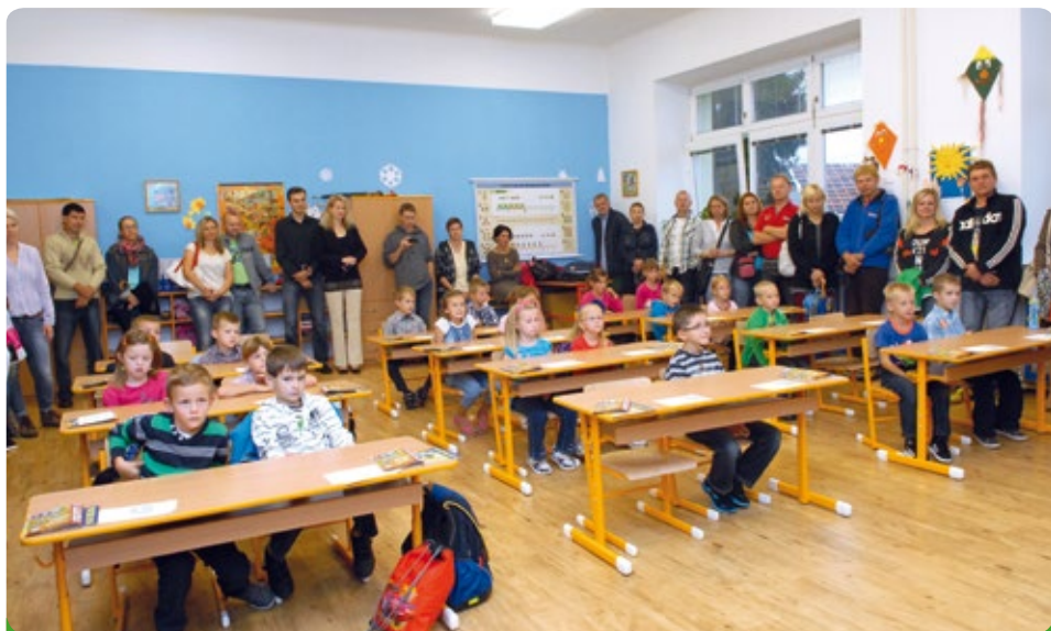
Prvníáci 2014 - I. A