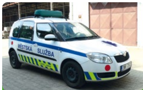
Auto na odvoz starších občanů k lékařům