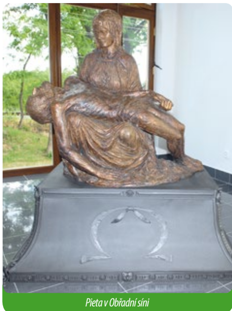
Pieta v Obřadní síni