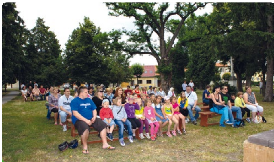
Konání dne 22.6.2014