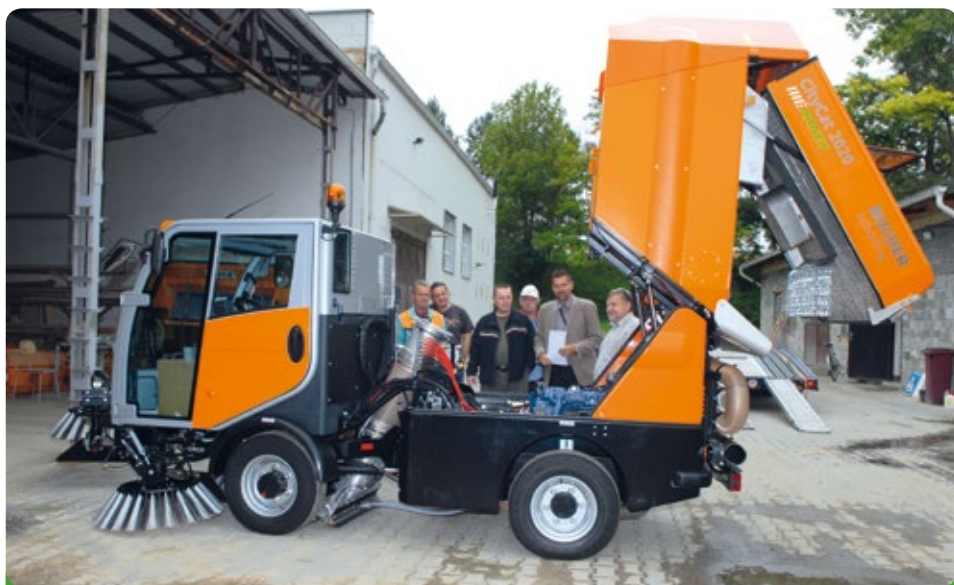
Předání zametacího vozu dne 14.8.2014