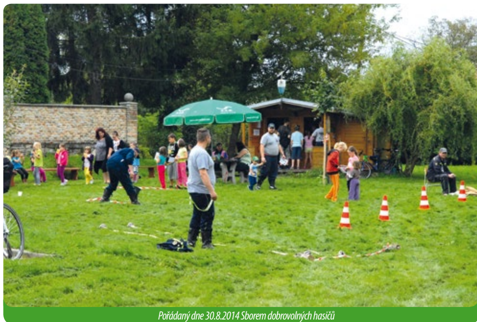
Pořádaný dne 30.8.2014 Sborem dobrovolných hasičů