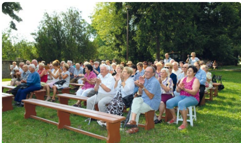
Koncert, konaný dne 27.7.2014