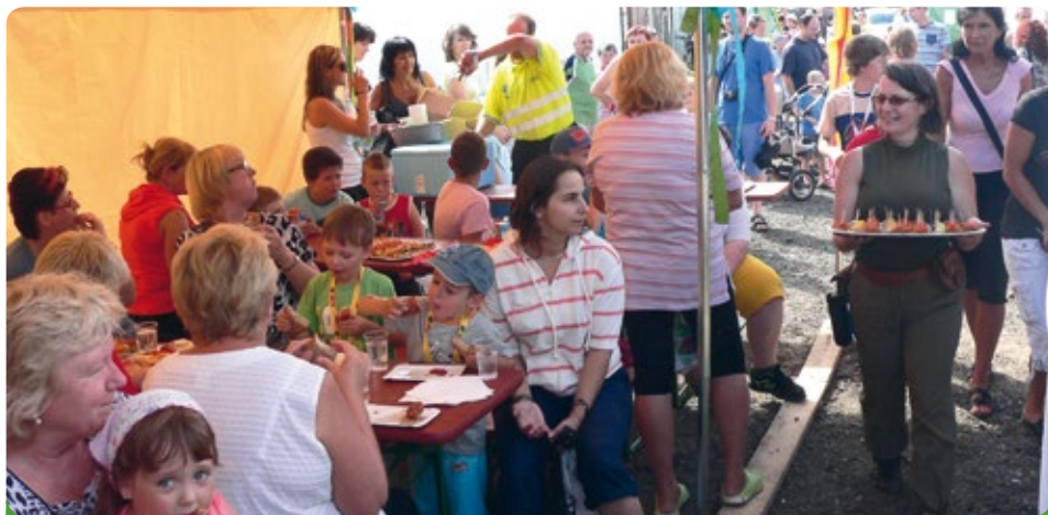
Akce, konaná dne 29.7.2014

Zájem dětí a dospělých byl opravdu nad očekávání. I zde se projevuje lidskost.