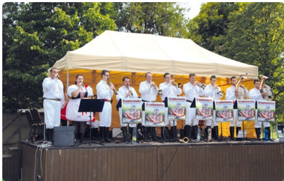
Dambořanka s lidovým vypravěčem