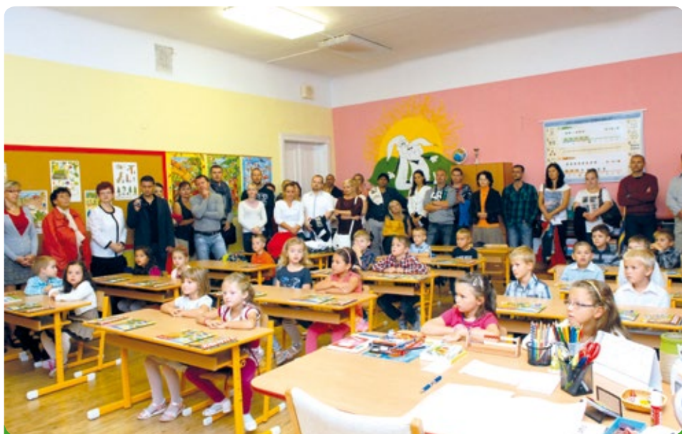
Prvníáci 2014 - I. B