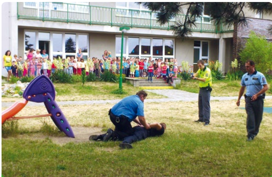
Beseda s policií v MŠ, konaná dne 25.6.2014