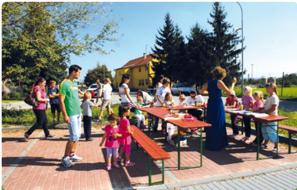
Rozloučení s prázdninami