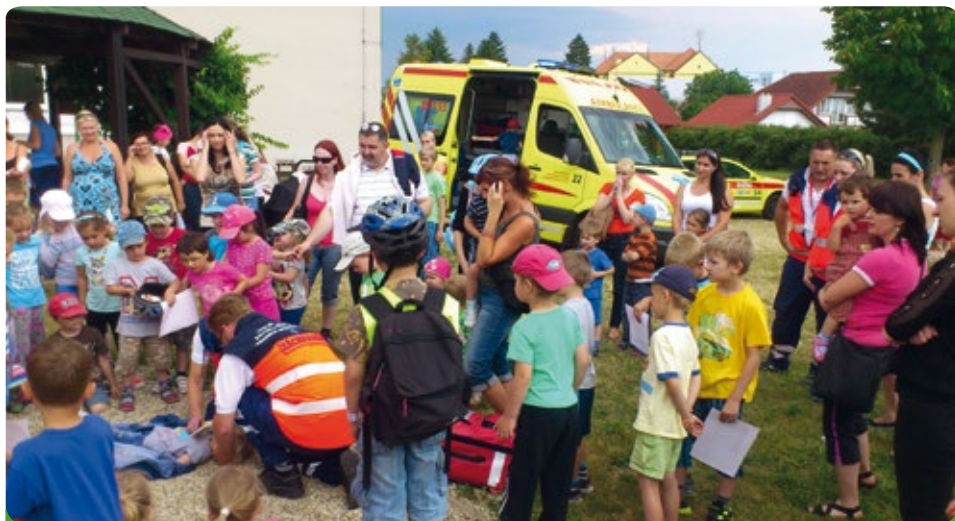
Akce v MŠ se záchrannou službou

Náš nový defibrilátor, který jsme zakoupili Městské policii, aby mohla poskytnout první pomoc.