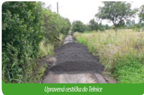
Upravená cestička do Telnice