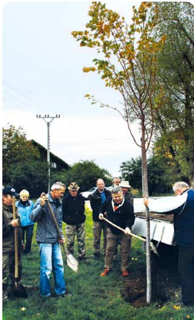
Pietní vysazení lípy