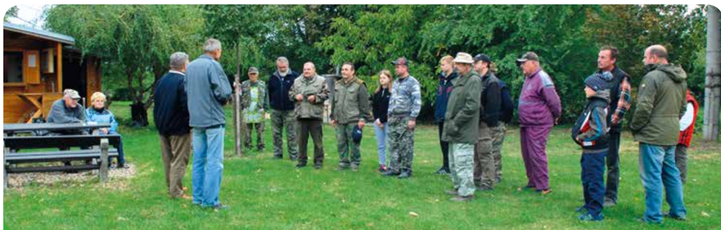
Zahájení rybářských závodů Újezd proti Telnici