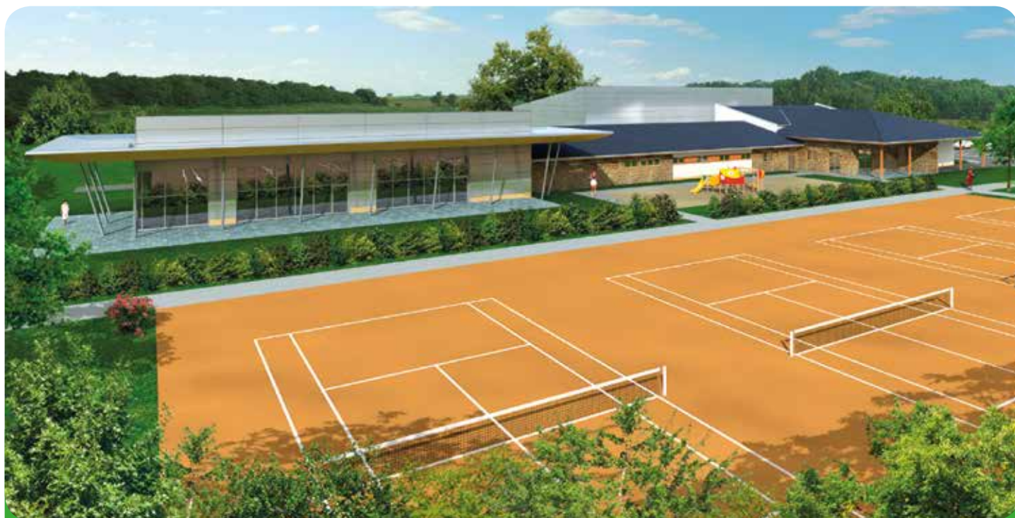
Vizualizace multifunkčního sportoviště