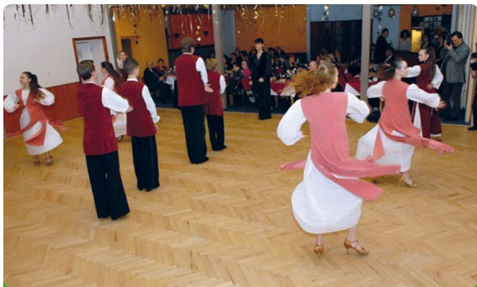
Předtančení - taneční klub Taneční školy Starlet