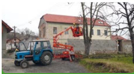
Ořez nebezpečných stromů v ulici Sušilova

Profesionalizace naší pracovní skupiny nám dnes umožňuje, abychom ušetřili asi 120.000,- Kč ročně. I tak to nebylo zcela jednoduché. Museli jsme zakoupit plošinu na práci ve výškách, nechat zaškolit pracovníky města a problém byl vyřešen.