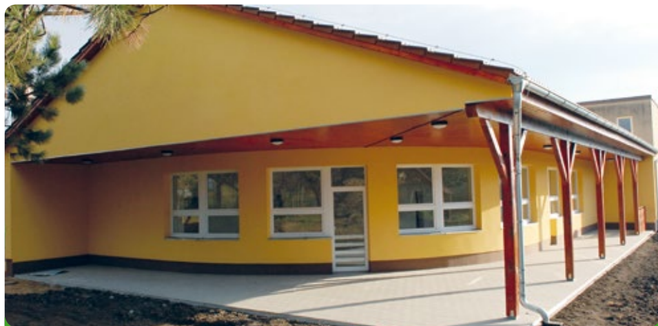
Přístavba mateřské školy jedné třídy

Odstranili jsme nedostatek místa v mateřské škole. Pál bych Vám vidět a slyšet, co vytykala opozice při projednávání, když rozhodovali o tom, zda přistavět či nepřistavět mateřskou školu tak, aby byla dostačující kapacitou. Největší nepravdivý argument byl, že nebude třeba rozšiřovat kapacitu mateřské školy, protože ubývá porodů. Pravda byla jinde a bylo dobře, že jsme se nenechali