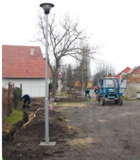
Nové veřejné osvětlení

Veřejné osvětlení MB Real a lokalita za „Rychtou“ stálo 25.863,63 Kč.