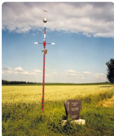
Lokalita U Stříbrné koule

Když obytná i hospodářská stavení se již příliš přiblížila ke kříži a jej zastíňovala, rozhodla se šternovská obecní rada s obecním zastupitelstvem , že kříž tento přeloží na vhodnější místo, na obecní místo u mostu u řeky Cézavy, na parcelu šternovskou č. 54/16, uznává závazek, že částka tohoto pozemku ve výměře dvaceti