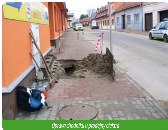
Oprava chodníku u prodejny elektra

Pod novými chodníky se několikrát do roka objeví „kaverna“, a pak se chodník propadne. Je to krajně nebezpečné. Naše pracovní skupina však s tím má již zkušenost. Jedno je ale jisté – pod starou částí Újezdu jsou staré nezasypané sklepy, které zasahují do chodníků. Již jsme řešili tři případy.