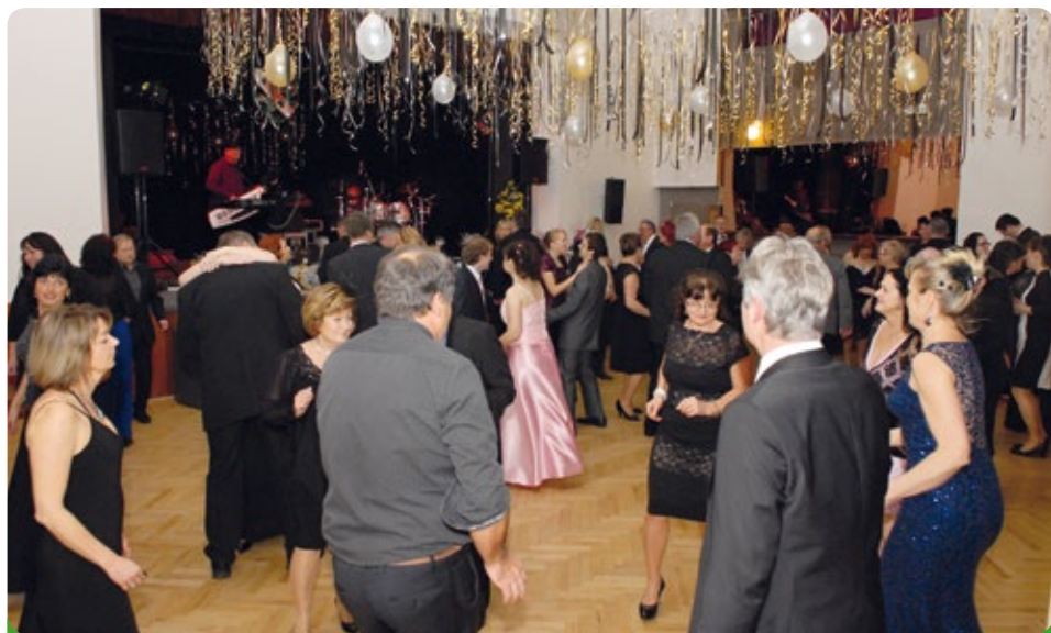
XI. Reprezentační ples města, konaný dne 23. 1. 2015 ... také se bavili