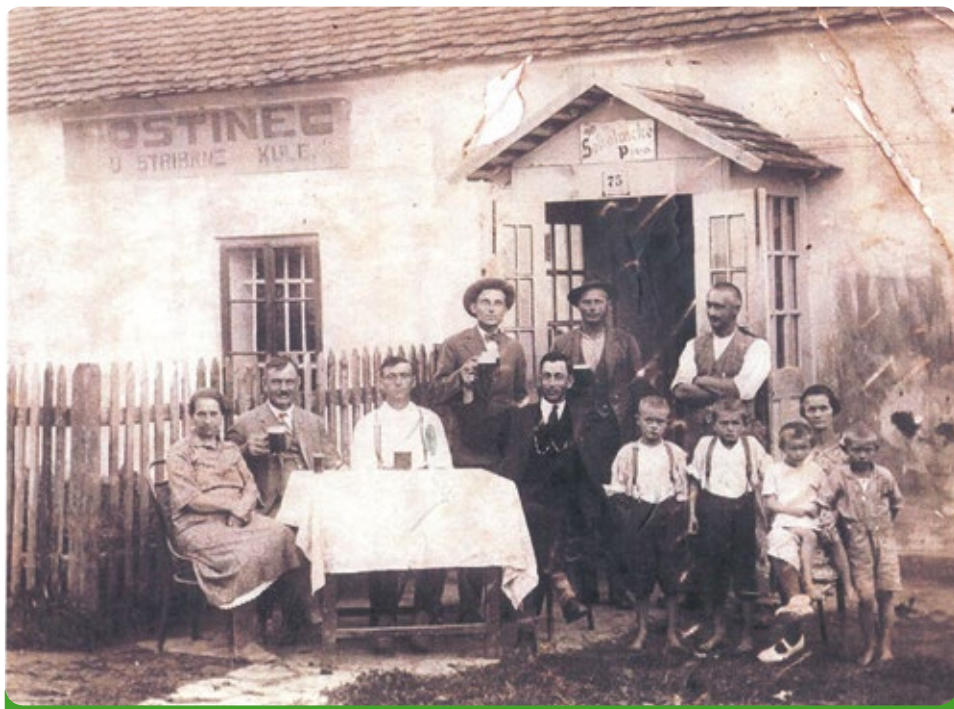
Zbouraná restaurace na místě Stříbrné koule

(Další text byl při vyzvednutí schránky v roce 2002 vlhkem v porušené schránce zničen, takže ho nebylo možno přečíst.)