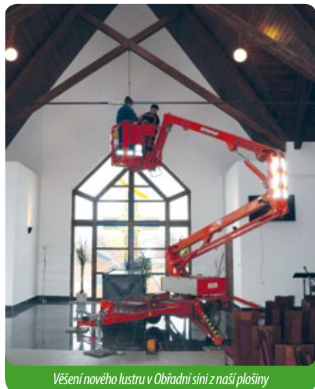
Věšení nového lustru v Obřadní síni z naší plošiny