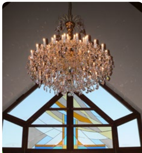
Osvětlení v Obřadní síni města je dokončeno. Po rozhodnutí Zastupitelstva města byl lustr objednan a dodala jej firma Honor