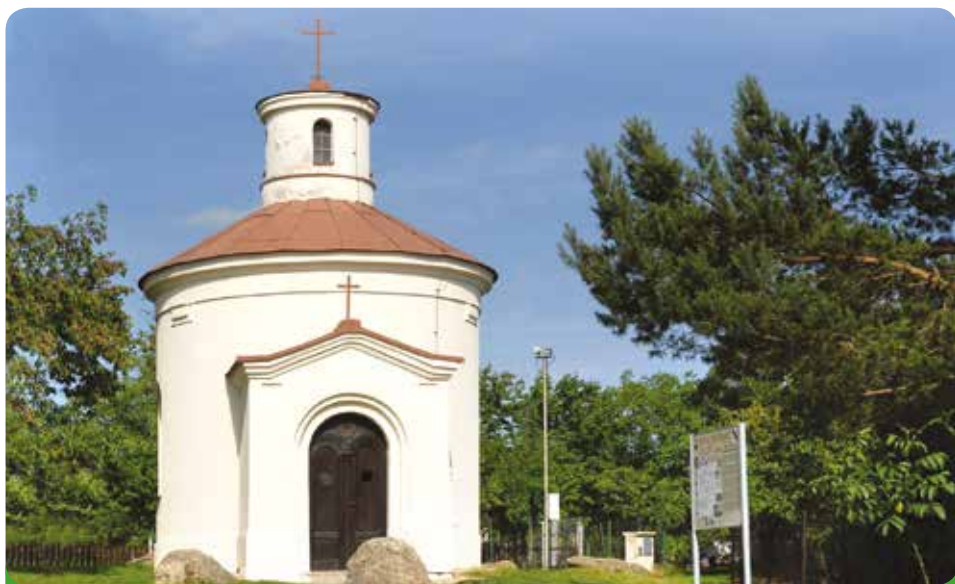
Kaple sv. Antonína Paduánského, majetek Římskokatolické církve, město ji na své náklady generálně opravilo