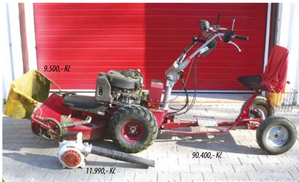
Motorové a elektrické nářadí – Johnsered – Narex