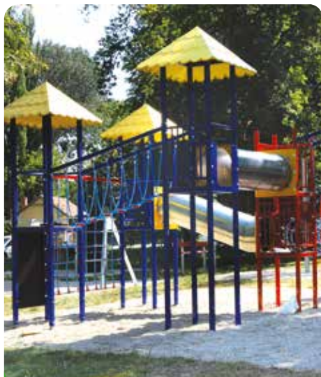
Nové dětské hřiště v parku pro maminky s dětmi, 861.135,71 Kč, hrazeno městem