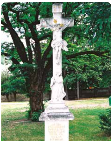
Kříž na starém hřbitově