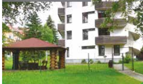
Penzion v nově zrekonstruovaném parku, 1.868.590,84 Kč, dotace ze SFŽP 633.913,- Kč, zbytek hrazen městem