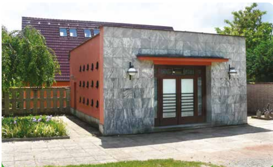
Márnice na hřbitově před kompletní technologickou rekonstrukcí, 385.746,- Kč, hrazeno městem