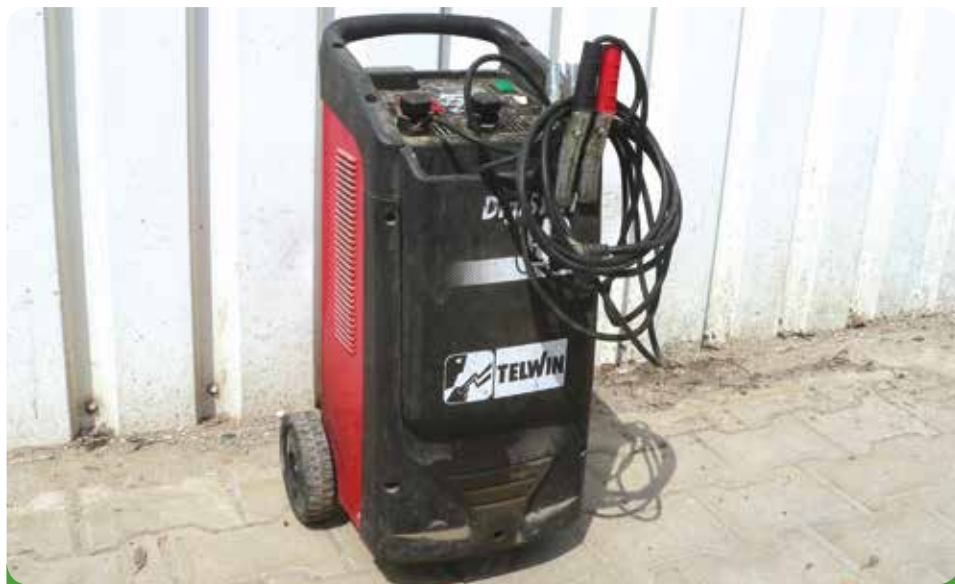
Elektrická nabíječka + startovací vozík Telwin, 7.130,- Kč