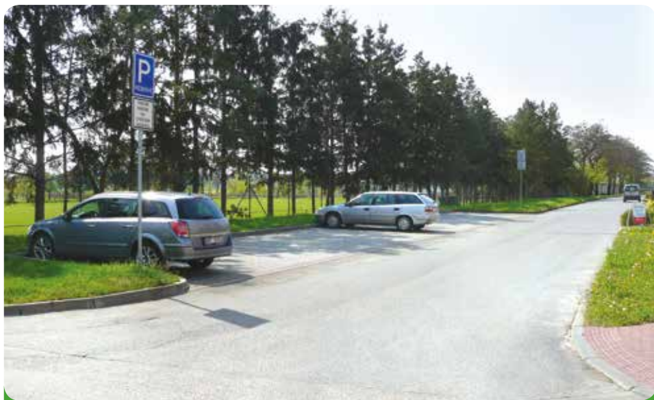
Parkoviště u hřiště, zbudované na pozemku města