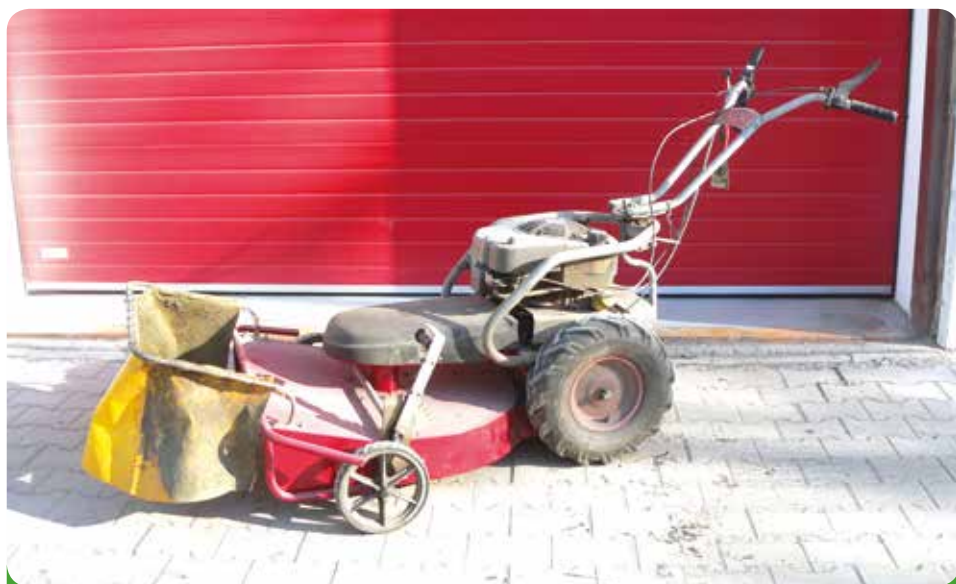
Dakr Panter – mulčer, 39.960,- Kč