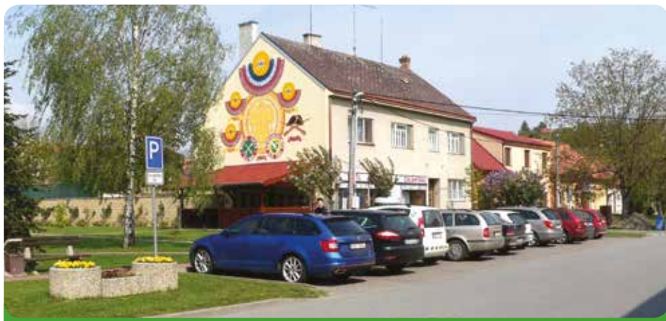
Parkoviště před Radnicí, 599.815,90 Kč i s vozovkou, hrazeno městem

Za parkování ve středu města se nebude alespoň v tomto volebním období parkovné vybírat.