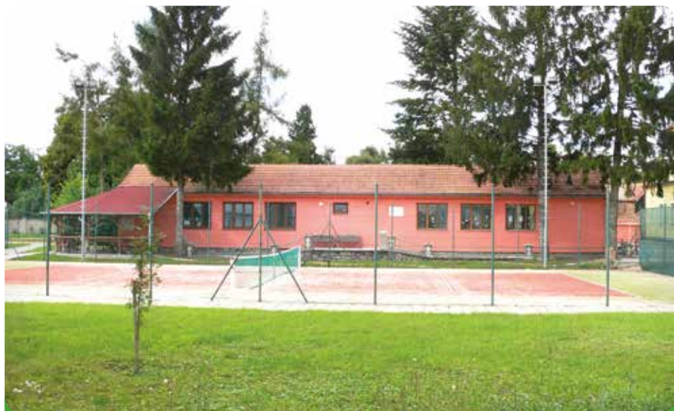
Naše tenisové kurty v areálu ZŠ včetně Klubu odložených mužů