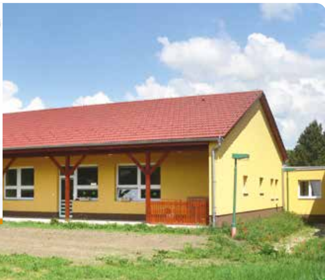
Náš školka má nový celý pavilon, prokazatelně je naplněna, i když někteří tvrdili, že je to zbytečné, 4.812.536,85 Kč, dotace z ROP JHV 3. 561.844,46 Kč, zbytek hrazen městem