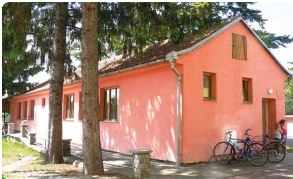
Klub odložených mužů a jedna nově zbudovaná třída