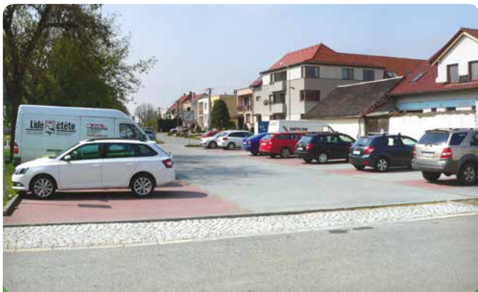
Parkoviště za Thermotechnikou, 1.305.669,32 Kč, hrazeno městem