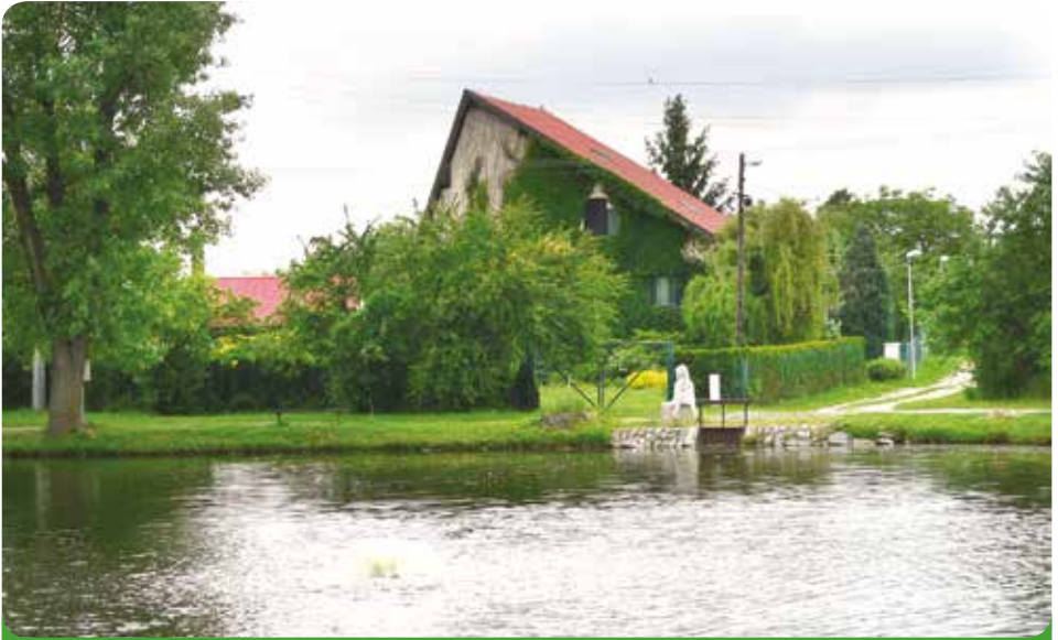
Náš rybník na Rychmanově včetně vodníka Tonika