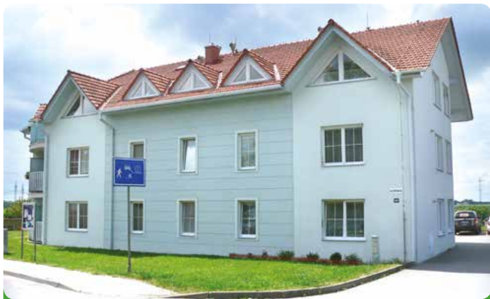
Naše bytové domy