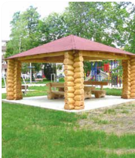
Nová pergola v parku, vedle nového dětského hřiště pro maminky s dětmi