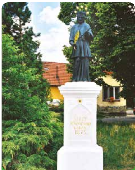
Sv. Jan po restaurování