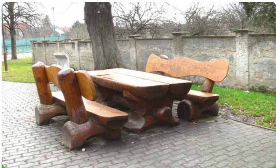
Sezení na starém hřbitově, které vydrželo již léta volné tvořivosti mládeže