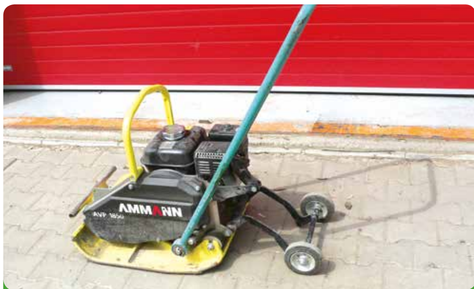
Vibrační deska Ammann, 52.800,- Kč