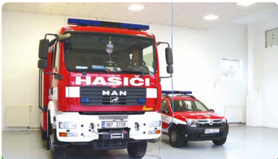
Hasičská auta - Man, 5.716.243,- Kč, dotace z Ministerstva vnitra 3.000.000,- Kč - Dacia Duster 4 x 4 420.000,- Kč, dotace JMK 150.000,- Kč, zbytek hrazen městem