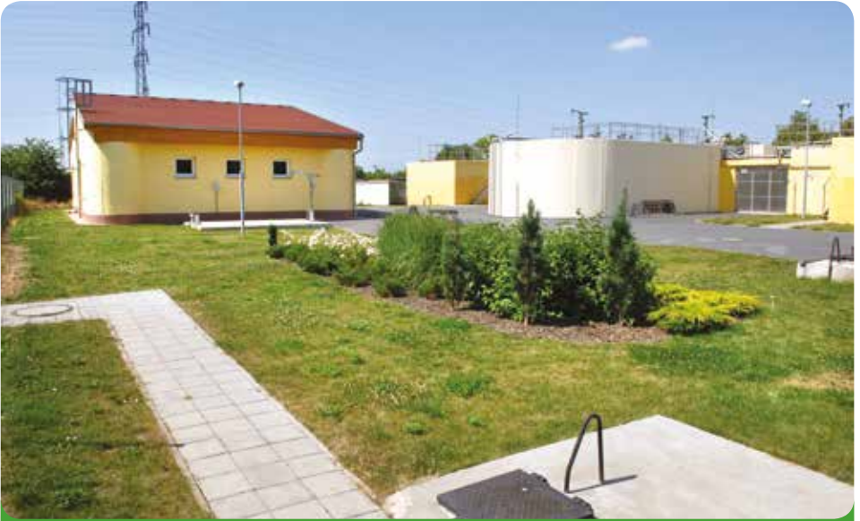
Náše zrekonstruovaná čistička odpadních vod na Šternově