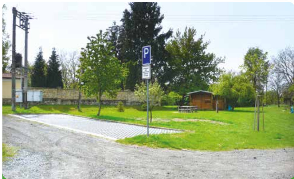
Parkoviště u evangelického hřbitova, hrazeno městem