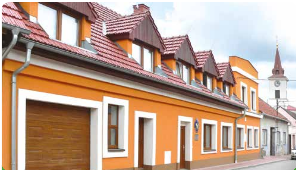
Knihovna – zakoupená, zbudováno na veřejnou knihovnu a 4 byty, 9.357.417,72 Kč, dotace na knihovnu od JMK 45.000,- Kč, zbytek hrazen městem