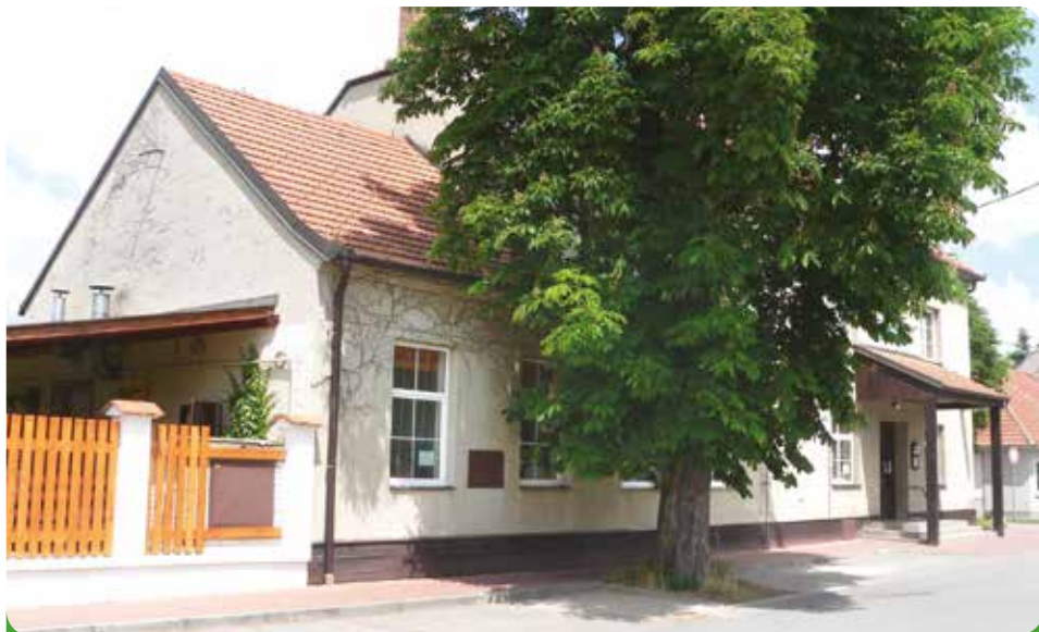
Rychta – restaurace, divadelní sál – průběžné opravy, 5.372.371,30 Kč, hrazeno městem