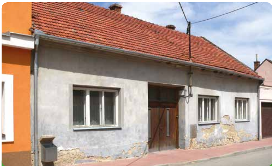
Zakoupeno městem pro budoucí jesle, popř. stavební úřad.