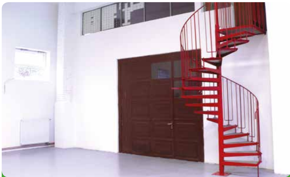
Hasičská zbrojnice, 1.747.266,16 Kč, hrazeno městem