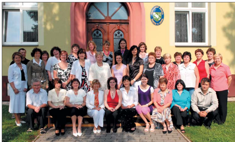
Učitelé a zaměstnanci školy v roce 2009