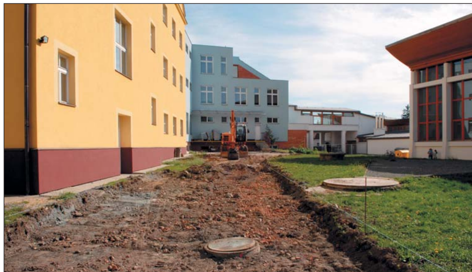
Výstavba kanálového sběrače ve škole