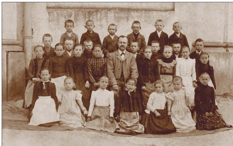
Jedna z nejstarších dochovaných fotografií žáků školy, cca 100 let stará