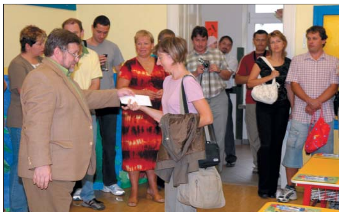
Předávání pastelkovného