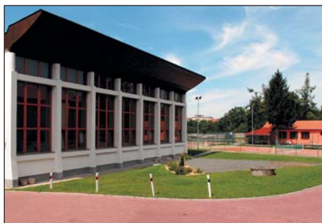
Tělocvična, kurty a tenisový klub – Klub odložených mužů