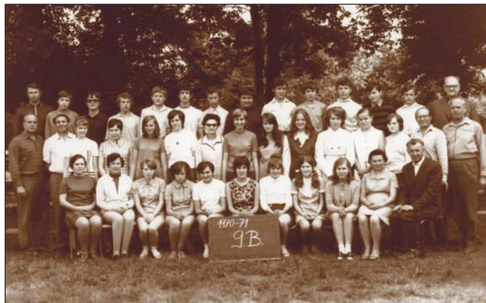
Třída 9. B, školní rok 1970-1971