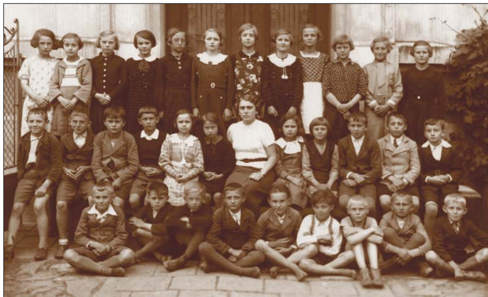
Rok 1946