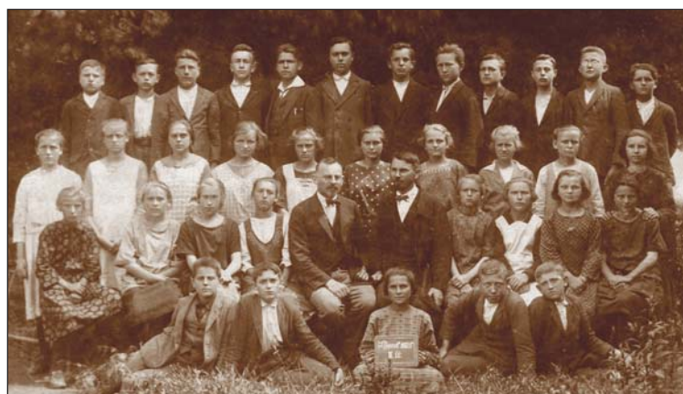
III. třída - měšťanská škola, foceno v roce 1925