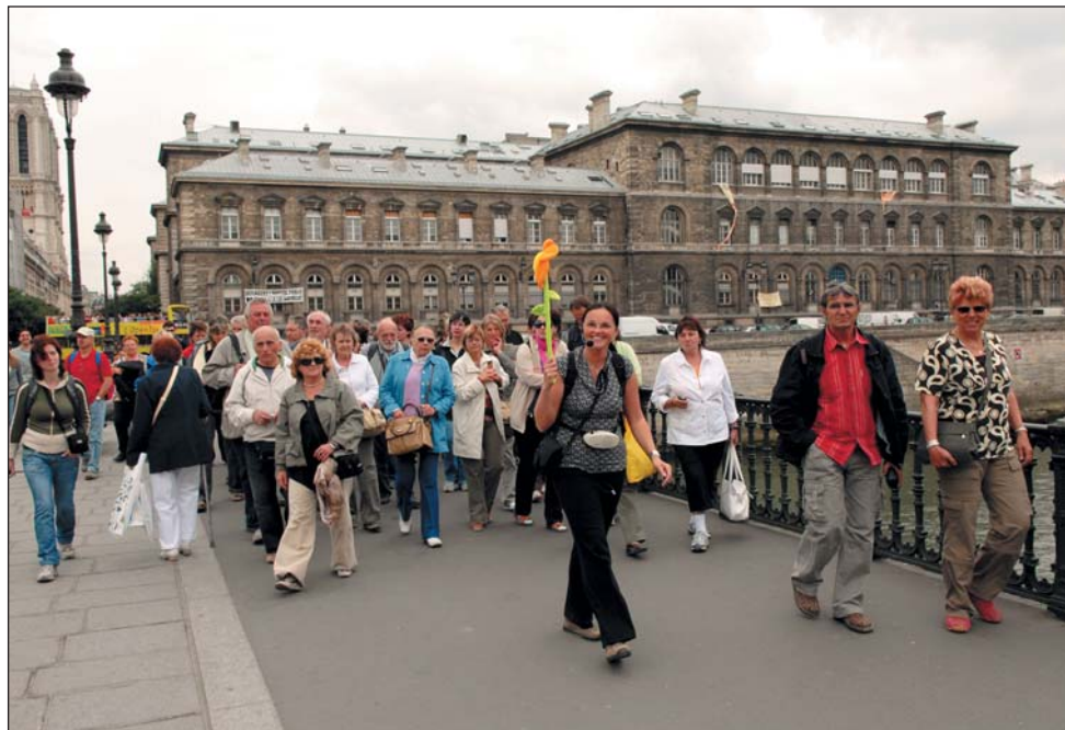
Všichni za kytičkou