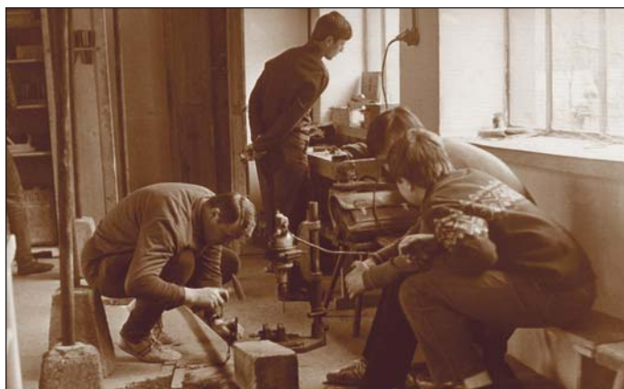
Práce ve školních dílnách