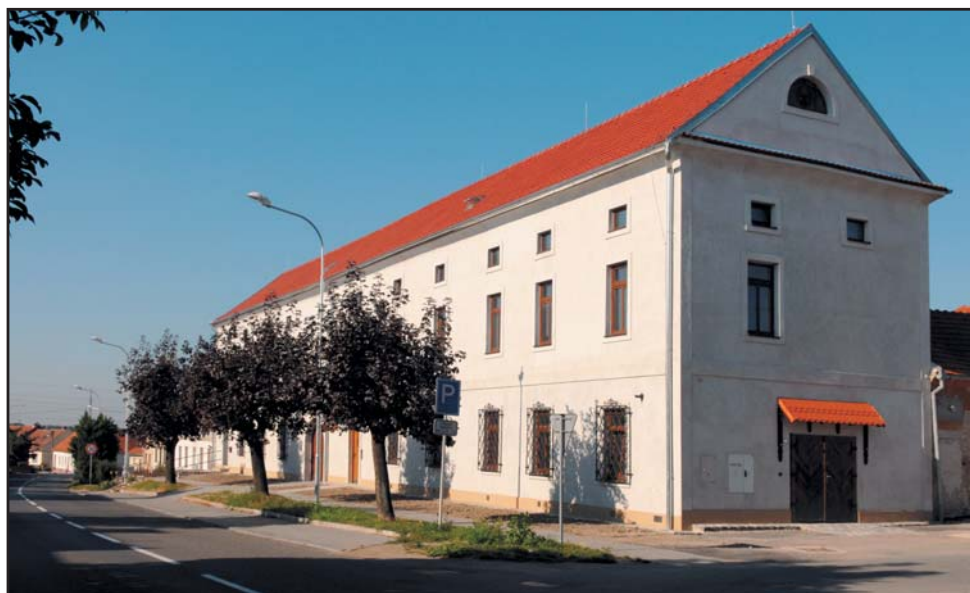
Po požáru nejstarší školy v Újezdě u Brna se učilo v této budově na Šternově