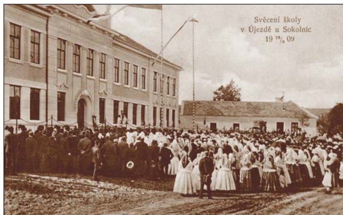
Svěcení školy v roce 1909