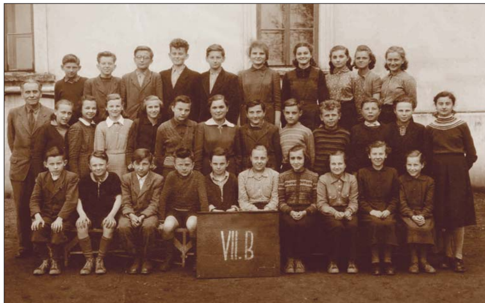
Rok 1954 (z archivu Jany Bílkové)