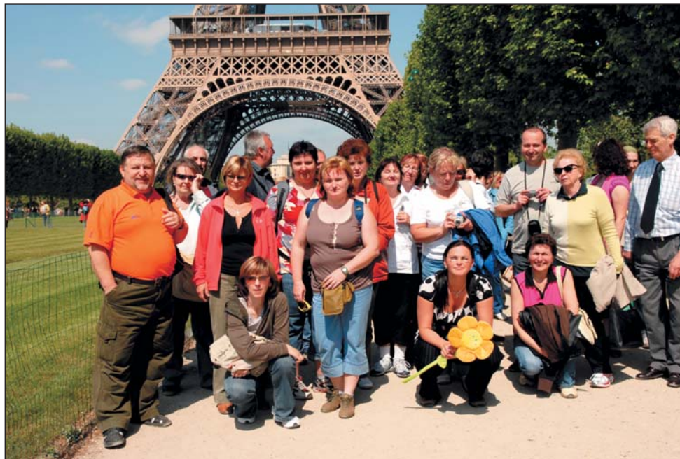
V Paříži v roce 2009

Náladu nám však pokazil výsledek našich hokejistů se Švédy 1:3. Nepomohlo ani naše usilovné připíjení na vítězství našich barev – prodělali jsme Waterloo.