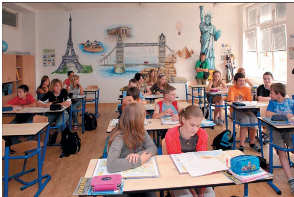
Nová třída - takto si ji vymalovali