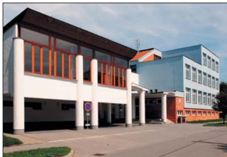
Přístavba a tělocvična