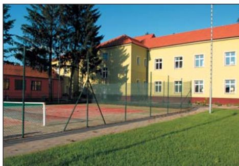
Zadní trakt po přestavbě