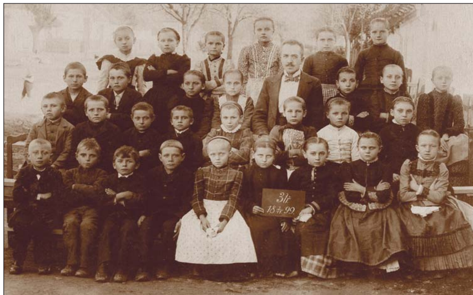
Školní rok 1899-1900