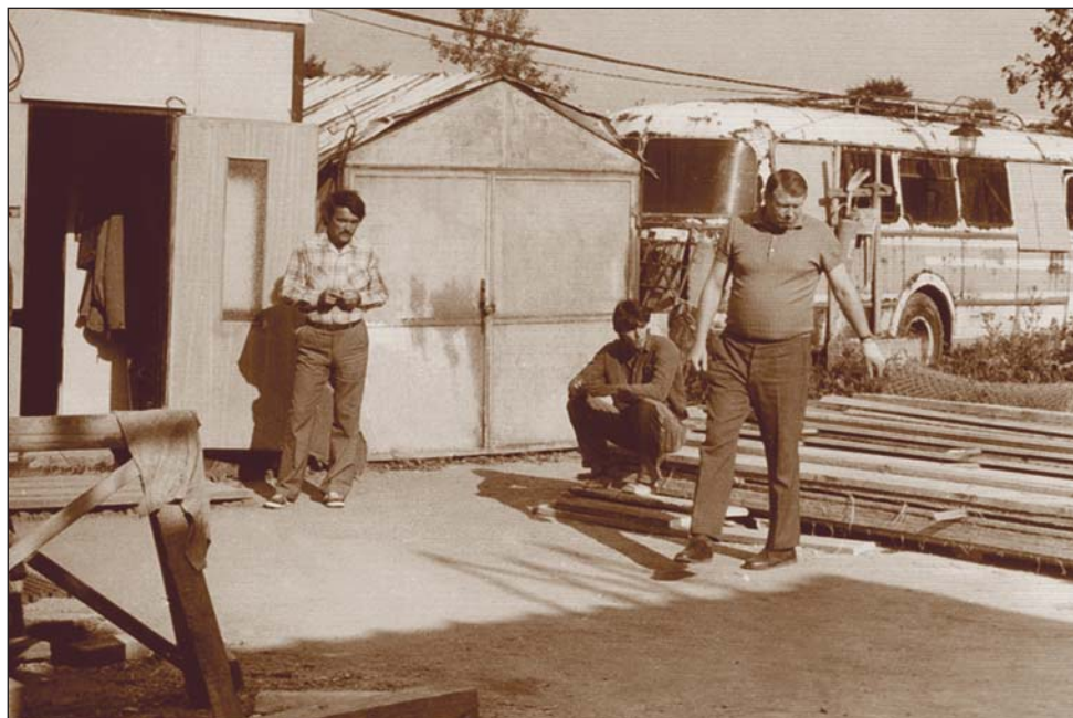
Zahájení 3. etapy výstavby školy