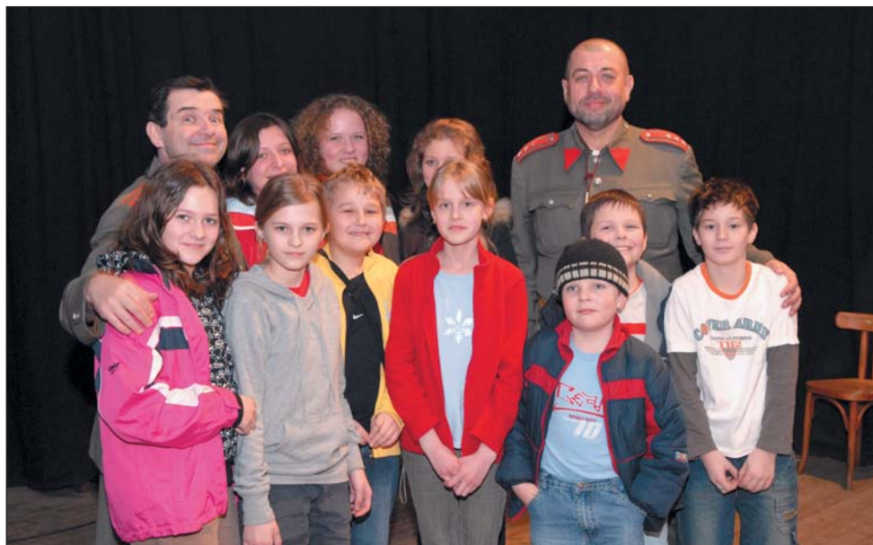
Školní děti s četníky z „Četnických humoresek“