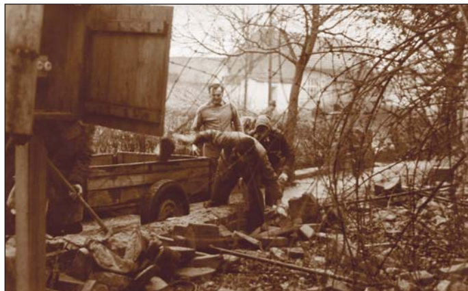
Asanace starého zdiva školy