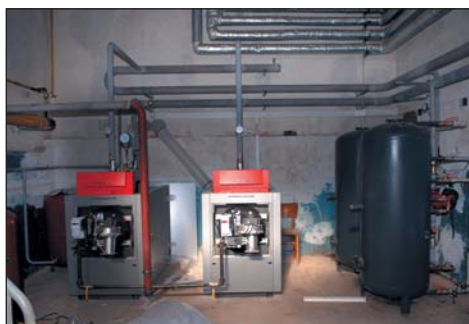
Probíhající oprava kotelny