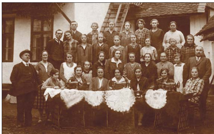
Ruční práce, rok 1925 (z archivu Marie Šponerové)