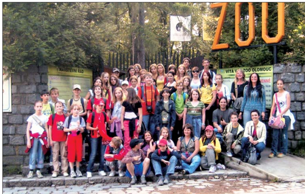
Nejlepší žáci pozvaní městem do ZOO – 10. 06. 2009