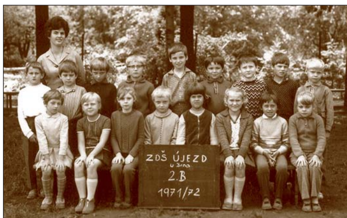
Třída II. B, školní rok 1971-1972