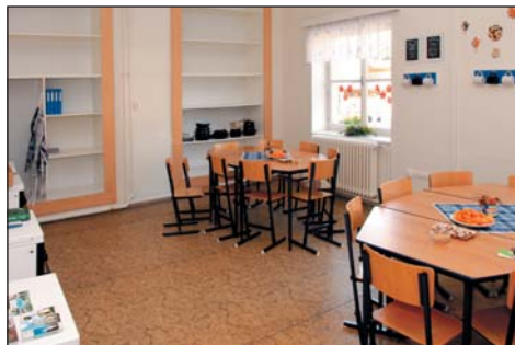
Nová žákovská kuchyňka