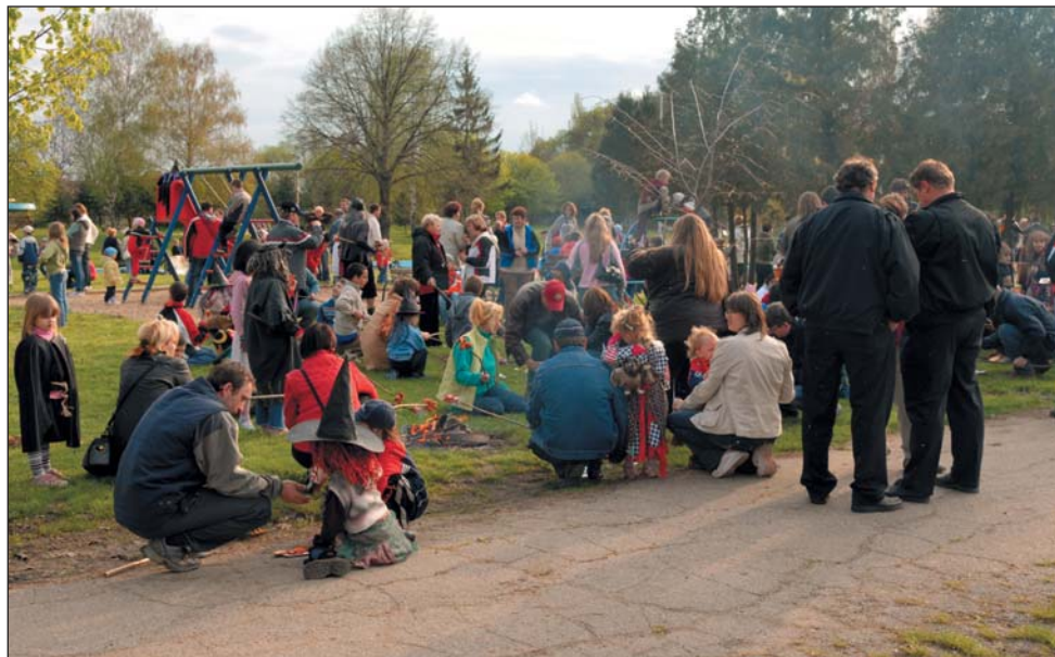
Škola pořádá slet čarodějnic – 2008