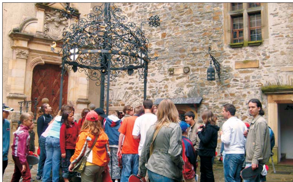
Nejlepší žáci pozvaní městem na hrad Bouzov – 10. 06. 2009