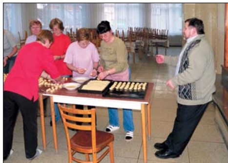
Pečeme ve škole koláčky

A zde bych mohla tento článek ukončit. Snad jen závěrem. Pan starosta přislíbil předložit zastupitelstvu města návrh, že opravu kotlů zaplatí město Újezd u Brna nad rámec rozpočtu pro ZŠ, a tento návrh zastupitelstvo města i schválilo. Dále jsme panu starostovi ukázali nevyhovující vybavení v prostorách odebírání použitého nádobí a na podnět pana starosty si máme na městský úřad podat žádost doloženou finanční kalkulací na nerezové vybavení těchto prostor. Jelikož nám zastupitelstvo města bylo vždy nakloněno, je možné, že až si přijdete v době konání oslavy výročí