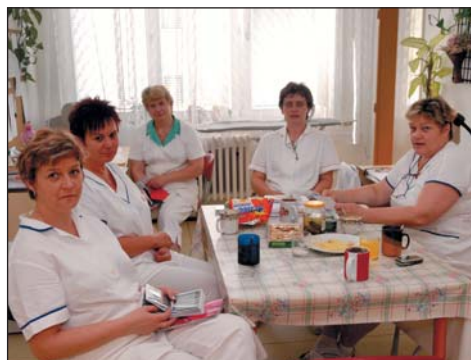
Porada ve školní jídelně