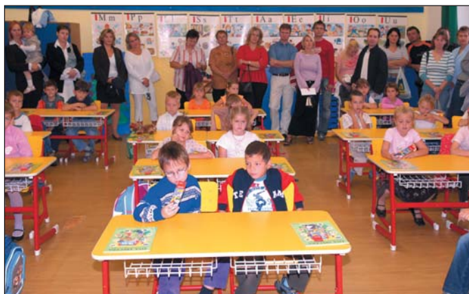
Prvníáčci s rodiči první den školy