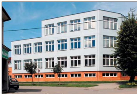
3. etapa – přístavba