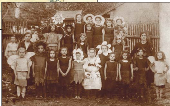
Školní divadlo