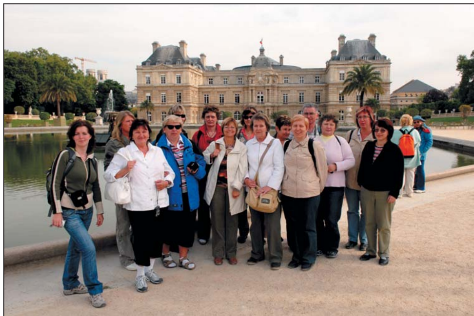
Učitelé před Lucemburským palácem