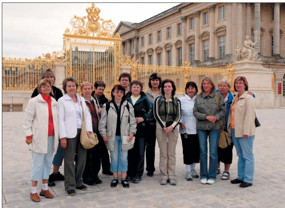
Učitelé před zámkem Versailles

Třetí den začal smutnou představou večerního odjezdu. Naložili jsme svá zavazadla do autobusu a ranní procházku mokrou Paříží jsme započali v Latinské čtvrti v zahradách Lucemburského paláce, vzpomněli na Marii Medicejskou, manželku Ludvíka XIII., která začala jeho stavbu. Při cestě kolem Pantheonu, který je obklopen licey a dalšími vzdělávacími instituty, nás překvapila fronta, kterou francouzští studenti stojí v touze po vzdělání do knihovny. Přímo za Pantheonem se krčí překrásný a světle prosvícený kostel St. Etienne du Mont s ostatky sv. Jenovéfy, ochránkyňe a patronky Paříže. Po jeho prohlídce jsme se vydali