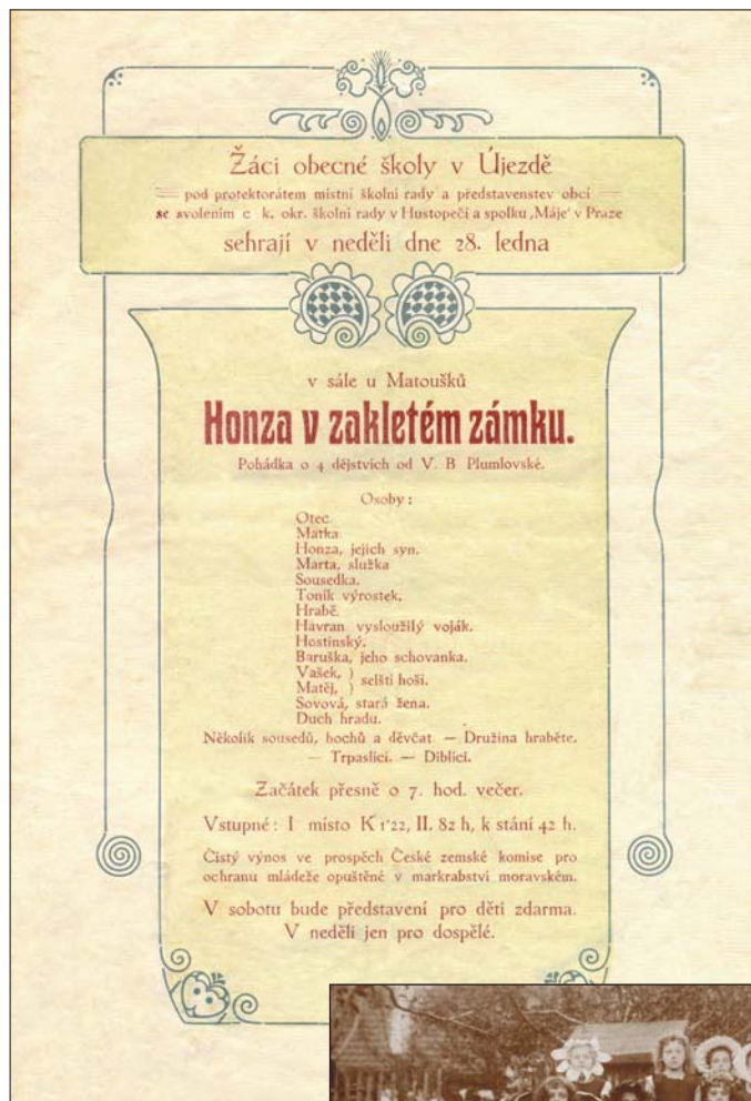
Pozvánka na divadlo