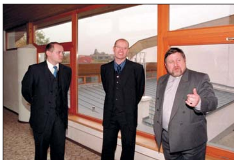
Návštěva ministra financí a budoucího hejtmana ve škole za doprovodu starosty města

Bohuslav Sobotka ministr financí v letech 2002–2006