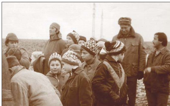
Děti na vycházce