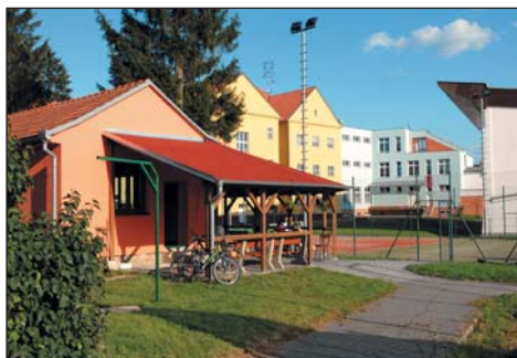
Pohled z druhé strany