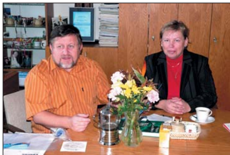
Pracovní porada starosty a paní ředitelky