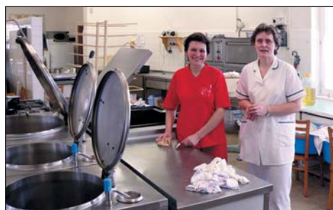
Ve školní kuchyni