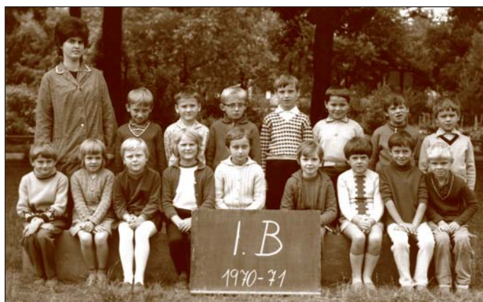
Třída I. B, školní rok 1970-1971