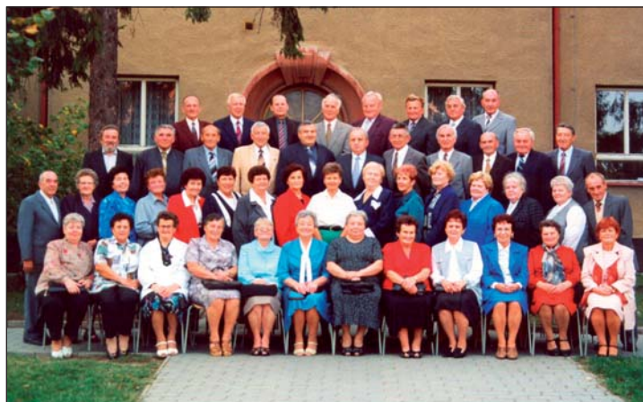
Setkání po 50ti letech, ročník 1935