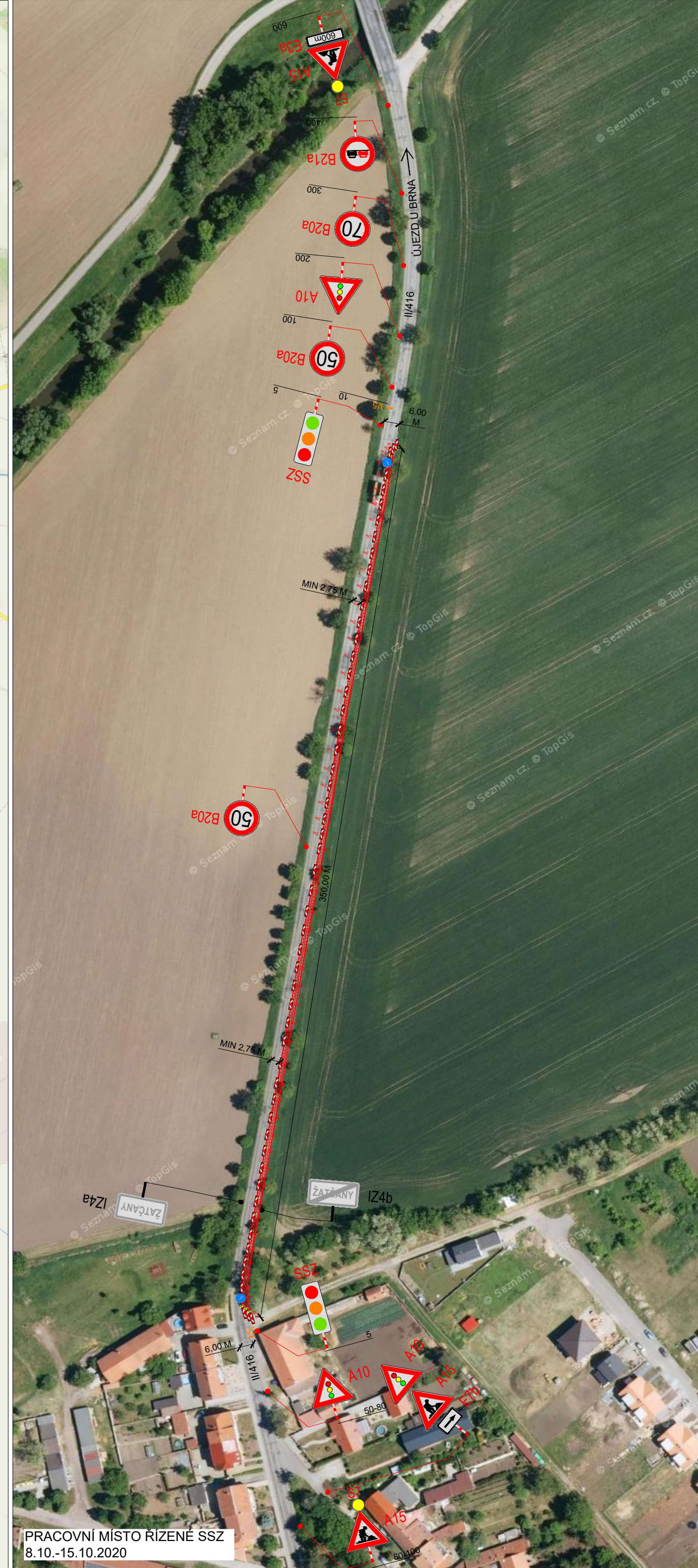
PRACOVNÍ MÍSTO ŘÍZENÉ SSZ 8.10.-15.10.2020