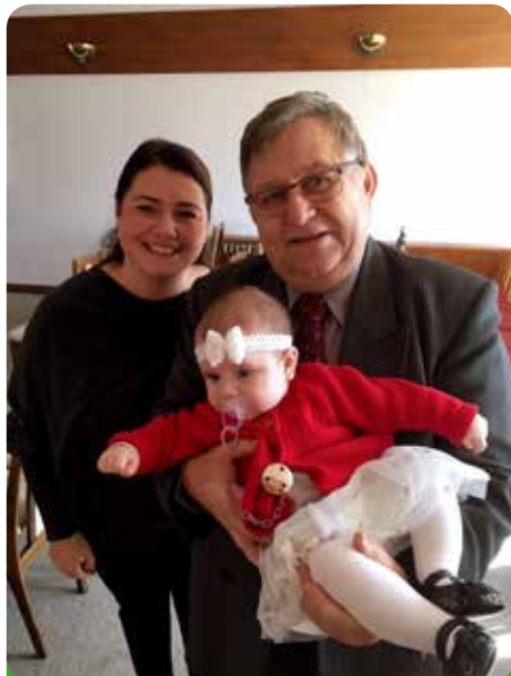
Takovou parádnici si rád pochová i pan starosta