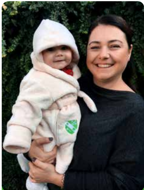
Děti dostávají od města župánky s městským znakem