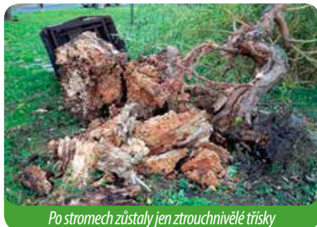
Po stromech zůstaly jen ztrouchnivělé třísky

Park jsme zrekonstruovali, vysadili nové stromy. A ti starostliví zastupitelé, kteří věc tenkrát oznámili a poslali na úřad kontrolu ze životního prostředí, se do dnešního dne neomluvili . . . no, o co jde . . .