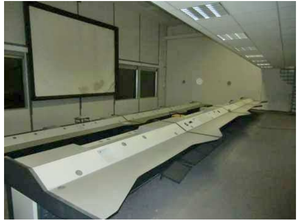
interiér obj. 03