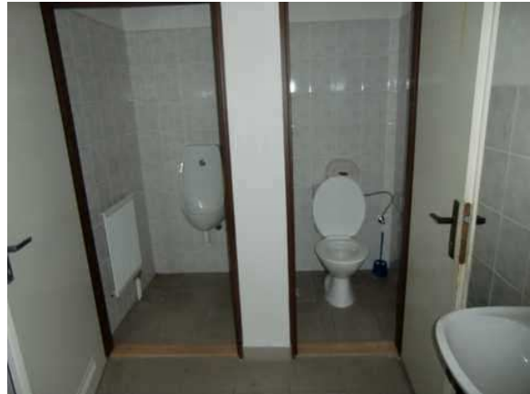
interiér obj. 04