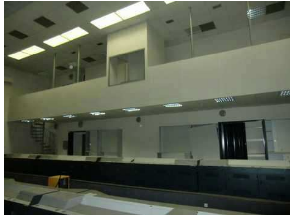
interiér obj. 03