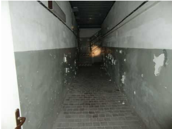
interiér obj. 03