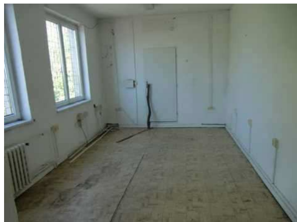
interiér obj. 04