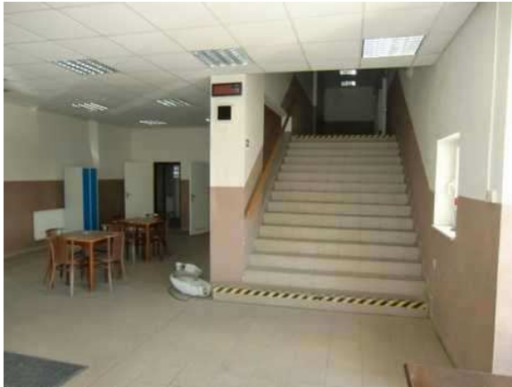
interiér obj. 04