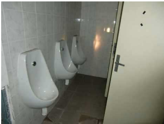
interiér obj. 03