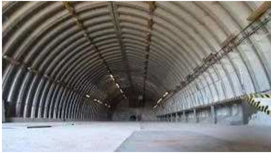
interiér obj. 03