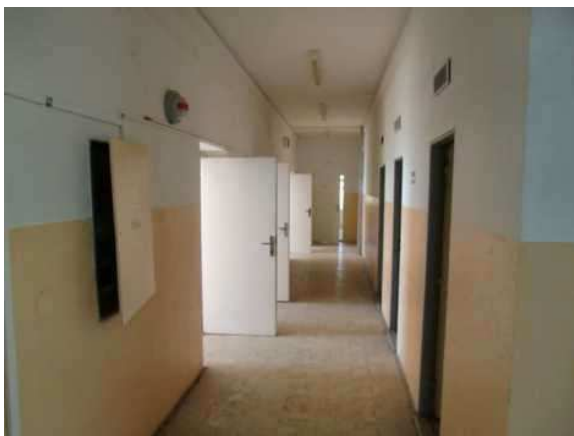
interiér obj. 04