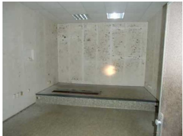
interiér obj. 03