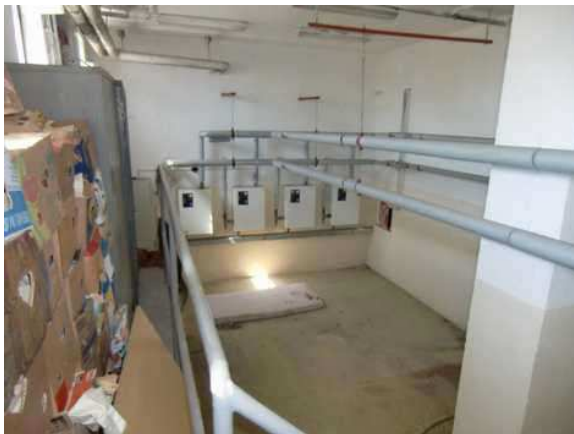
interiér obj. 04