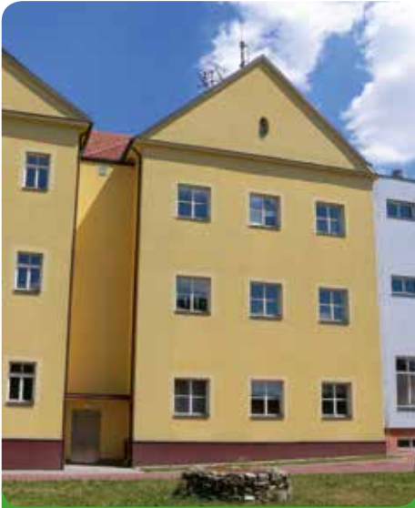
Výtah nepoškodil pohled na budovu školy

Dne 17. 5. 2017 jsme zkolaudovali výtah v naší škole. Důvodů ke stavbě bylo více: