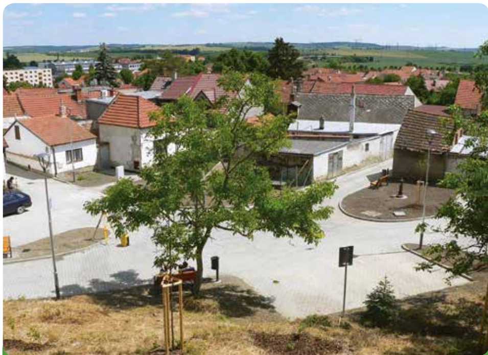
Naše nejnovější spravená lokalita – zrekonstruovaná ulice Nad Sklepy