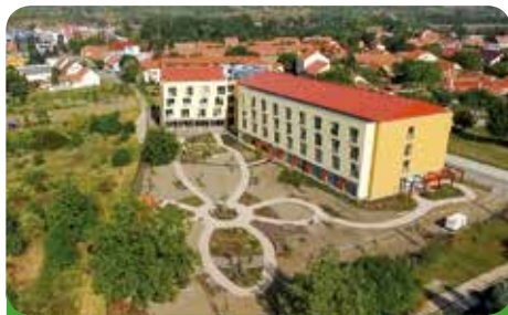
Domov u Františka