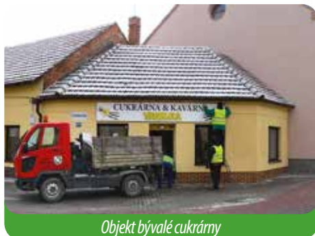
Objekt bývalé cukrárny