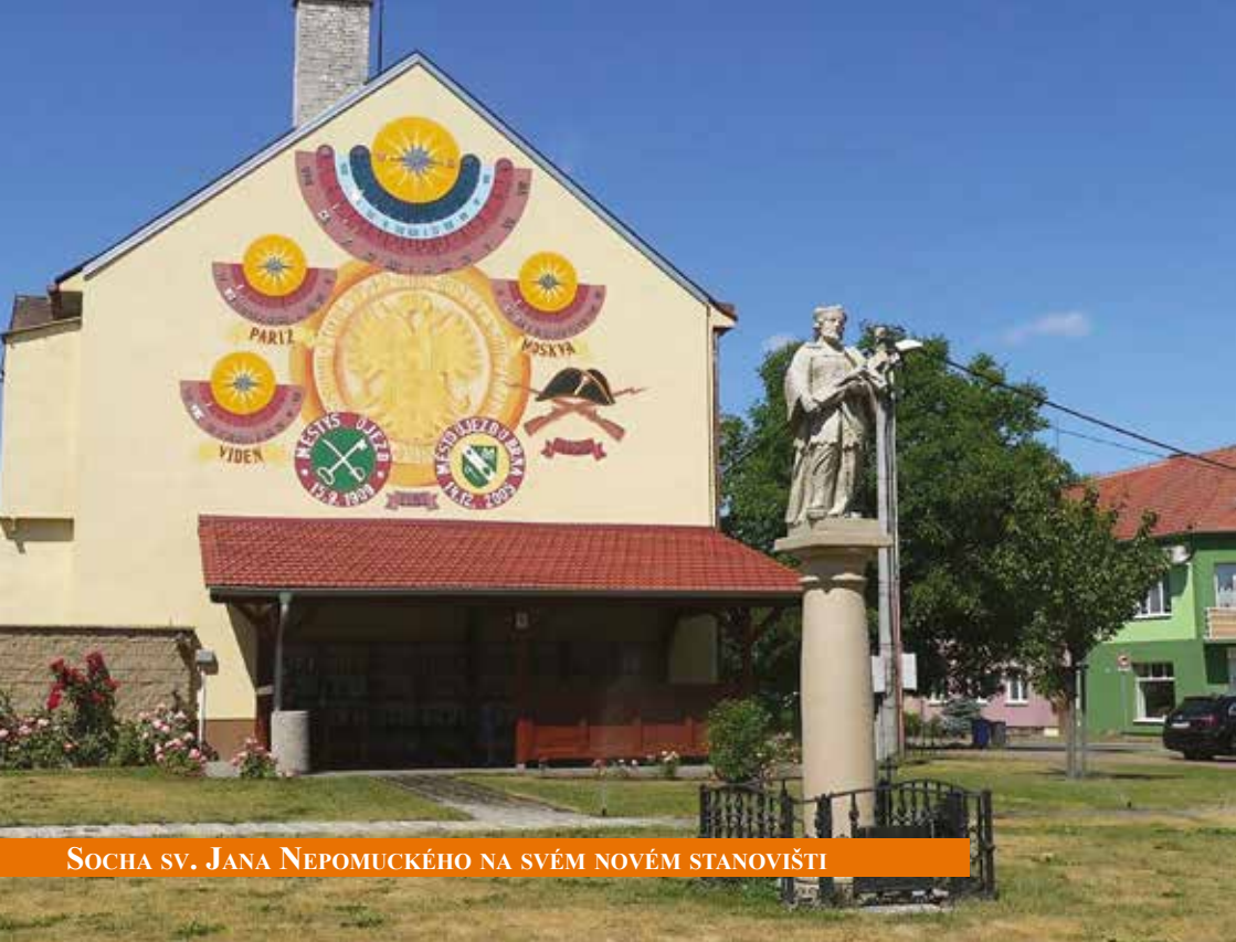
SOCHA SV. JANA NEPOMUCKÉHO NA SVÉM NOVÉM STANOVIŠTI