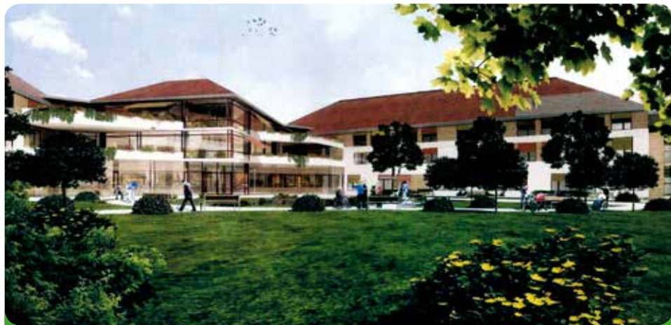
Vizualizace (exteriér) – soukromé zdravotnické zařízení