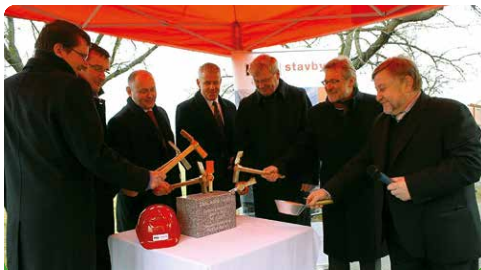
Základní kámen – a do roka dům stál