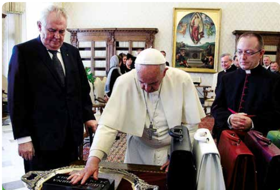
Požehnání základního kamene nového domova pro seniory