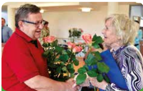
Starosta města gratuluje absolventce kurzu

Kurz bude ukončen slavnostním předáváním osvědčení o studiu, na které budou pozváni rodinní příslušníci a blízcí studentů-seniorů a představitelé města Újezd u Brna, které se na tomto projektu, vedle Jihomoravského kraje, aktivně podílí.