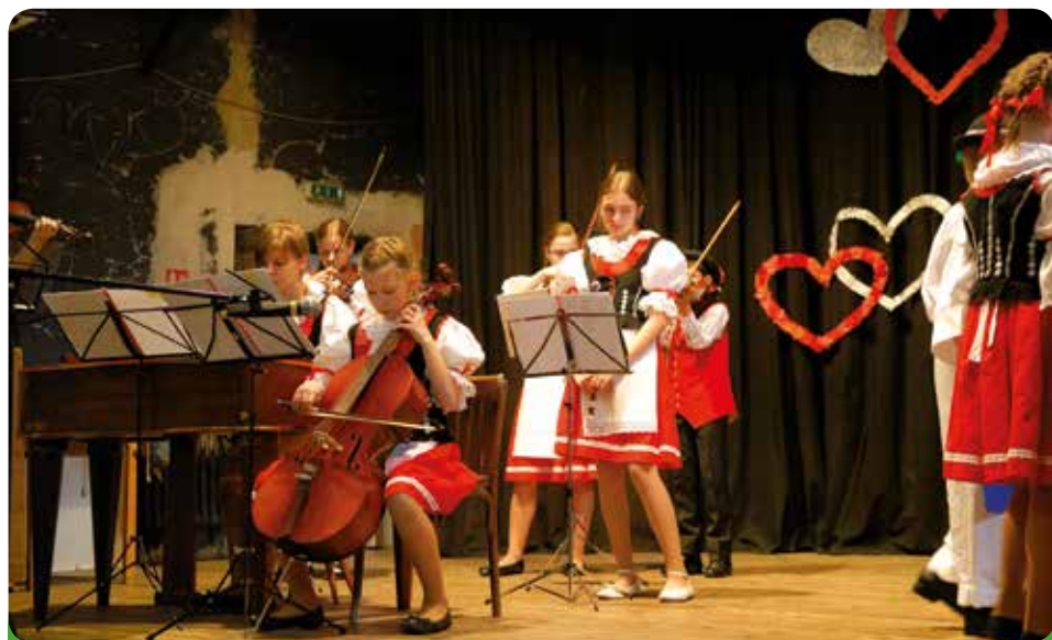
Den matek – vystoupení