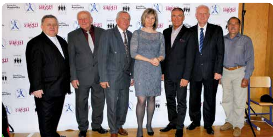
Starostové na Grand Prix Austerlitz