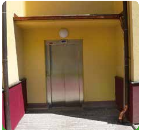
Vchod do výtahu

Nesmíme však zapomenout, že v Domově u Františka je také jeden výtah. Nyní se ovšem chystá nový projekt druhého výtahu, protože jeden výtah na takové zařízení je evidentně nedostačující.