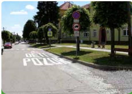
Přechod pro chodce

pohyb dětí. Tento typ starosti města o bezpečnost je nutný, obzvláště dnes, kdy doprava hrubě přesahuje možnosti komunikací.