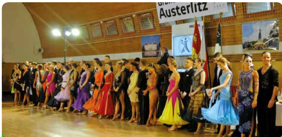
Taneční soutěž Grand Prix Austerlitz