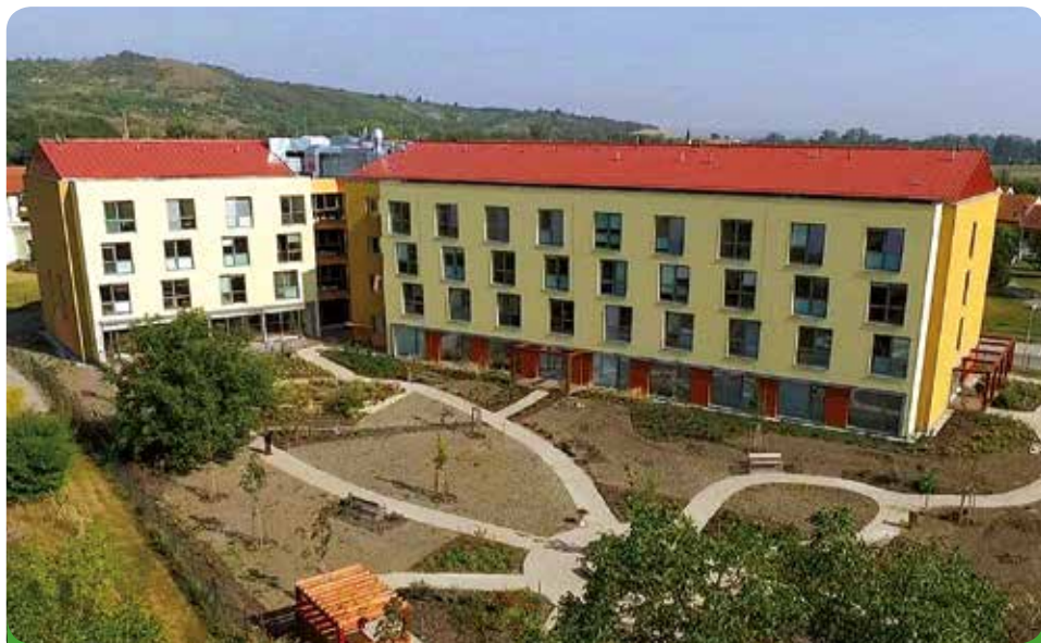
Domov u Františka