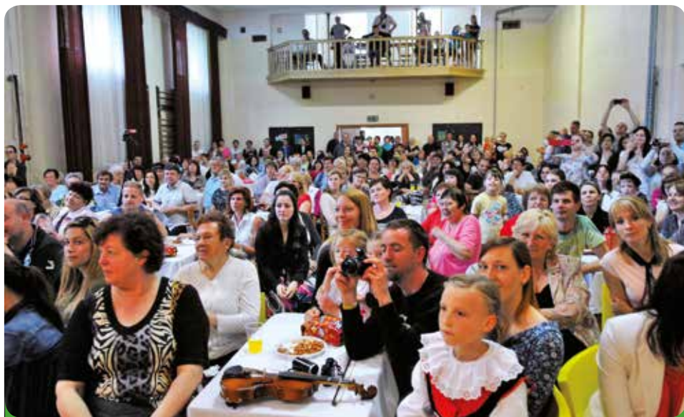
Den matek – pohled do sálu