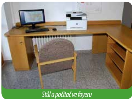
Stůl a počítač ve foyeru