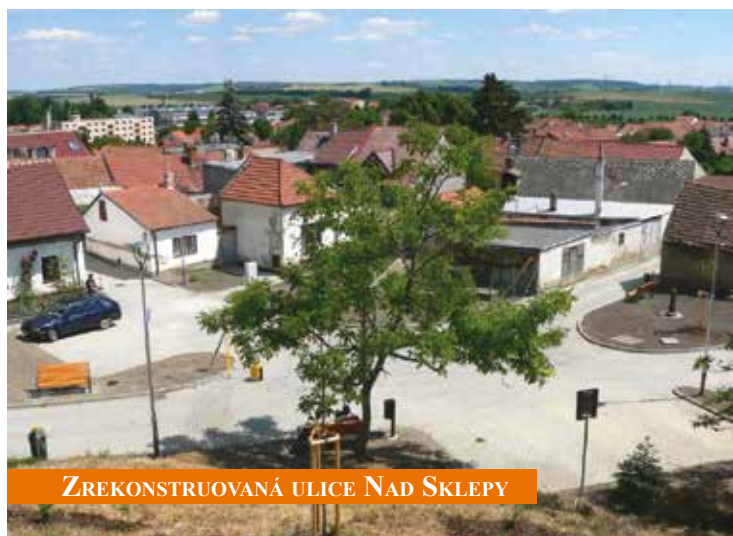
ZREKONSTRUOVANÁ ULICE NAD SKLEPY