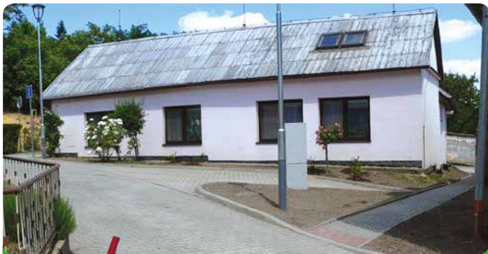
Nad Sklepy – kde dřív bylo bláto a marast jsou dnes vydlážděné chodníky, silnice a odpočívadla