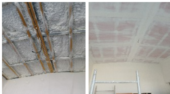
Oprava stropu v bytě na Penzionu