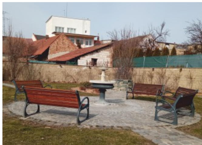
Renovované lavičky v parku před radnici